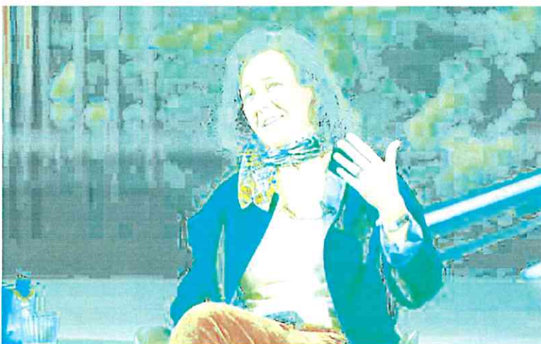
La presidenta de Banco Santander, Ana Botín, en la conferencia internacional de banca que celebró ayer.