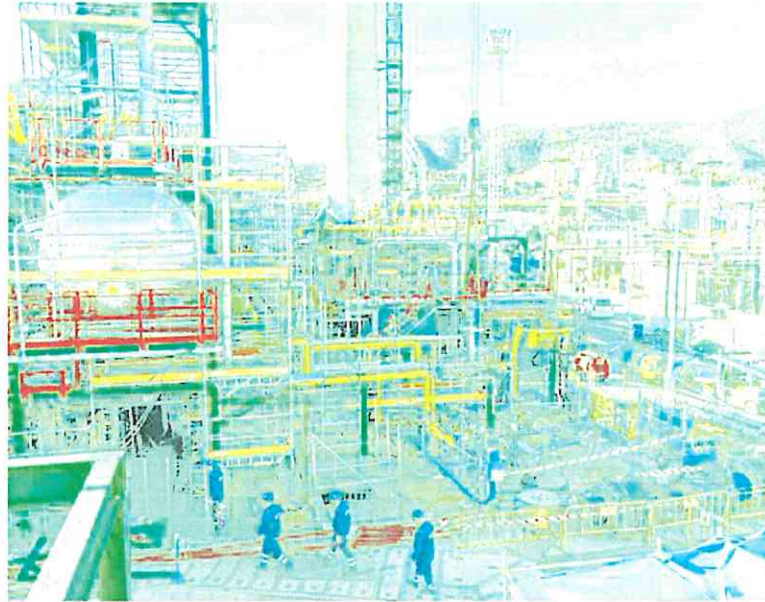
Obreros en el montaje de la planta de biocombustibles de Repsol, en una foto de octubre.