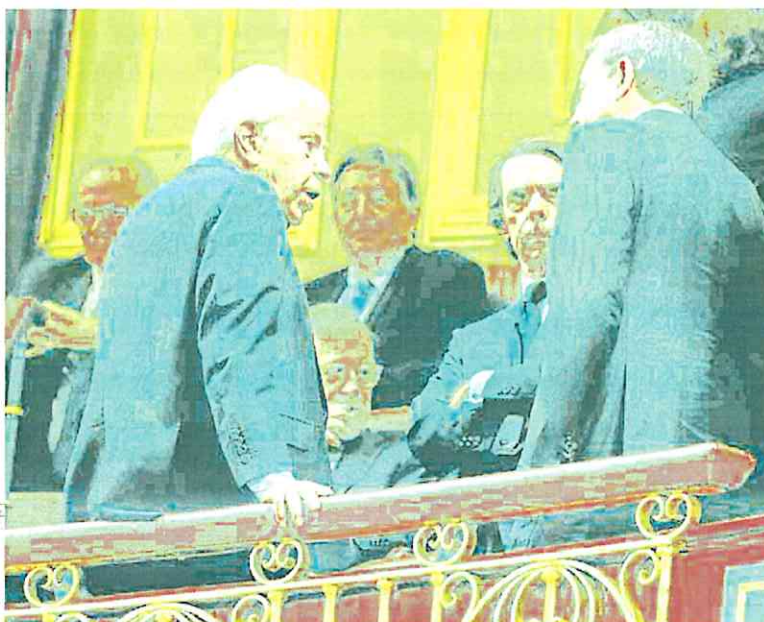
Felipe González, crítico con la amnistía, charla con Rodríguez Zapatero y Aznar en la Jura.

En esta ocasión, y a diferencia de lo que ocurrió en 2019, cuando ERC y Bildu optaron por la abstención, y los números solo daban para una mayoría simple, Sánchez no necesitará ir a una segunda vo-