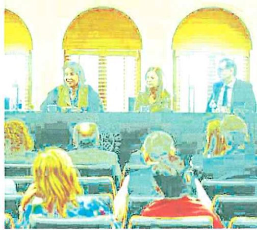
La directora de la ANECA, a la izquierda, en la UMU.