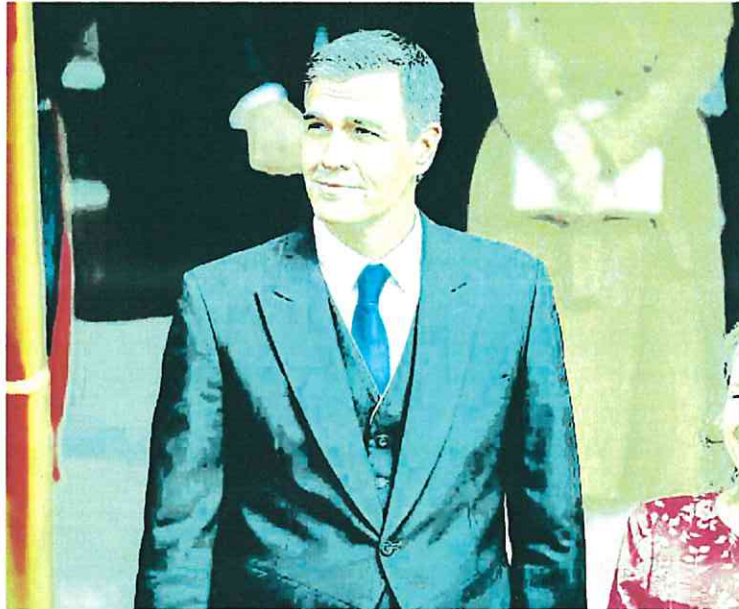
Pedro Sánchez, durante el acto de la jura de la Constitución de la princesa Leonor.

La endiablada aritmética obliga a tener el apoyo de todos los socios de la investidura para sacar adelante cada ley. El respaldo a los próximos Presupuestos Generales del Estado es la garantía mínima para estirar la legislatura. Al menos, hasta su ecuador, tirando del comodín de la prórroga si fuese necesario. En las conversaciones está sobre la mesa la tramitación de las próximas cuentas, y desde el Ministerio de Hacienda llevan semanas trabajando en el proyecto. La propia mi-