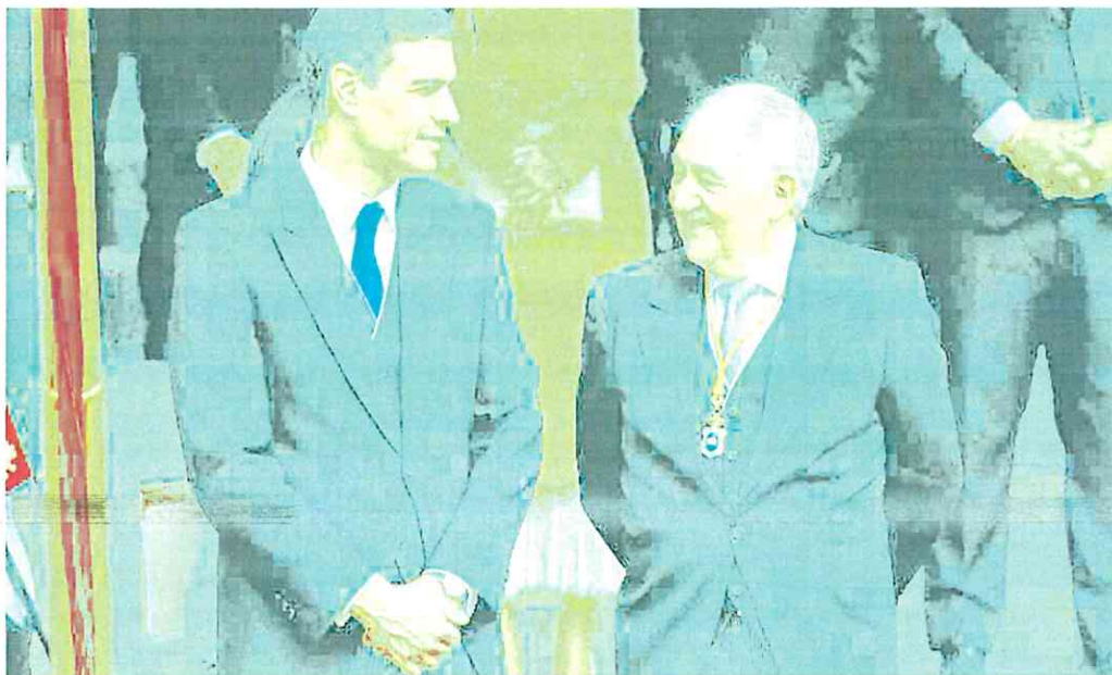
El presidente del Gobierno conversa con el máximo responsable del Constitucional, Cándido Conde-Pumpido, en la jura de la Princesa de Asturias. e. p.

Con el resto de las carpetas negociadoras pendientes de solven-