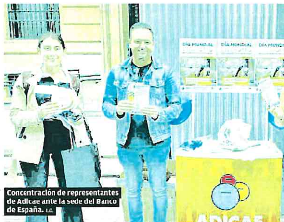
Concentración de representantes de Adicae ante la sede del Banco de España. I.A.

Adicae recuerda que los casos de fraude descubiertos en los últimos años han generado «una deuda de cerca de 1.000 millones de euros a 417.233 hipotecados de la Región