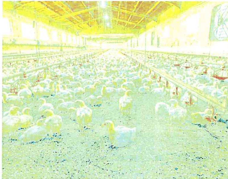
Granja de pollos en Los Vivancos, en el término municipal de Fuente Álamo.

«El Gobierno de España va a incrementar los recursos hídricos procedentes de la desalación, pero el volumen no va a suplir el déficit de la Cuenca del Segura, que, además, en 2027 no va a poder utilizar agua subterránea y verá cómo el Trasvase se recorta en 105 hectómetros», advirtió. Cano lamentó que «siguen sin ofrecer una planificación hídrica a nivel nacional que dé respuesta a las necesidades del sector».