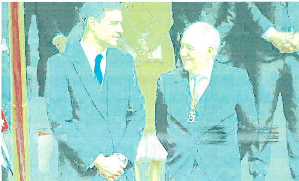
El presidente del Gobierno conversa con el máximo responsable del Constitucional, Cándido Conde-Pumpido, en la jura de la Princesa de Asturias. e. a.

Con el resto de las carpetas negociadoras pendientes de solven-