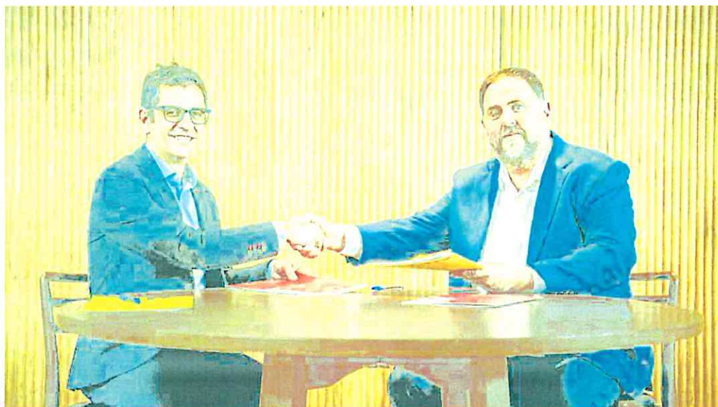
El ministro socialista Félix Bolaños y el líder de ERC, Oriol Junqueras, sellan ayer el acuerdo para investir a Sánchez en Barcelona.

El propio ministro, uno de los puntales del equipo negociador designado por Sánchez para la in-