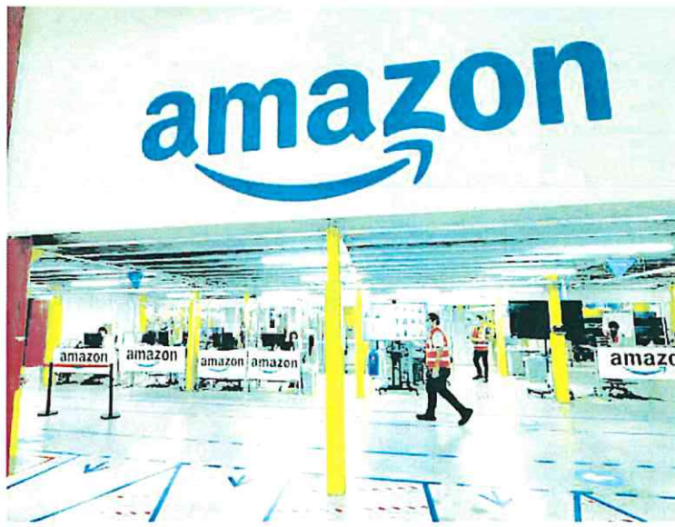
Instalaciones de una de las plantas de Amazon en la pedanía de Corvera.

Añade que a raíz de la denuncia, la Inspección ha iniciado un expediente sancionador contra Amazon y señala, entre otros extremos, que «en lo sucesivo y conforme a lo