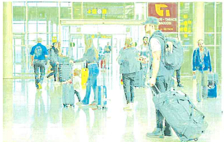
Un grupo de turistas en el aeropuerto de Barcelona.

El gasto medio por turista fue de unos 1.271 euros, con un incremento anual del 7,9%, mientras su promedio diario creció un 8,8% hasta los 185 euros. La duración media de los viajes internacionales se situó en 6,9 días, cifra similar a la del año pasado.