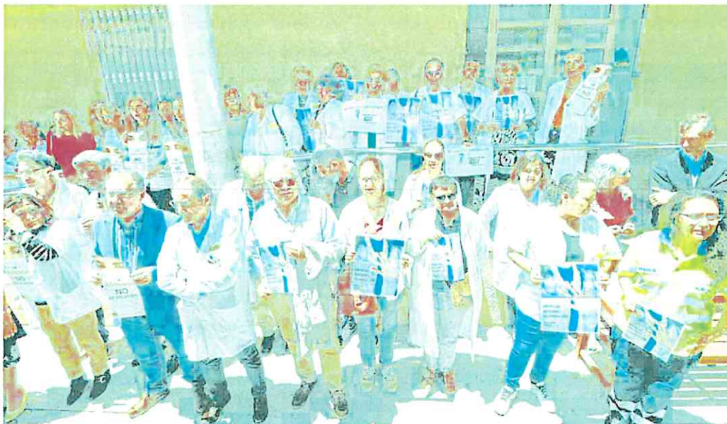
Sanitarios del centro de salud de San Andrés, en Murcia, protestan contra la agresión a un compañero, a finales de mayo pasado.