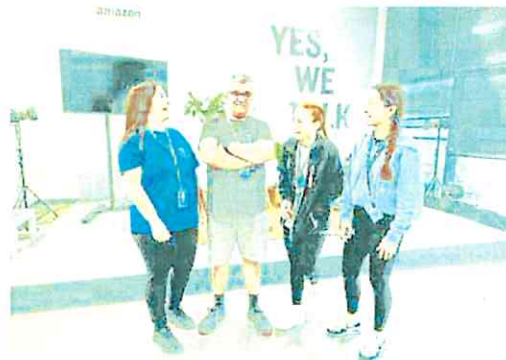
Cuatro trabajadores de Amazon, miembros de la misma familia, ayer durante la presentación del estudio en la sede de Corvera.

«Garantizar el bienestar laboral de las personas que trabajan en Amazon es fundamental. Para lograrlo, empezamos por escuchar sus necesidades», afirmó