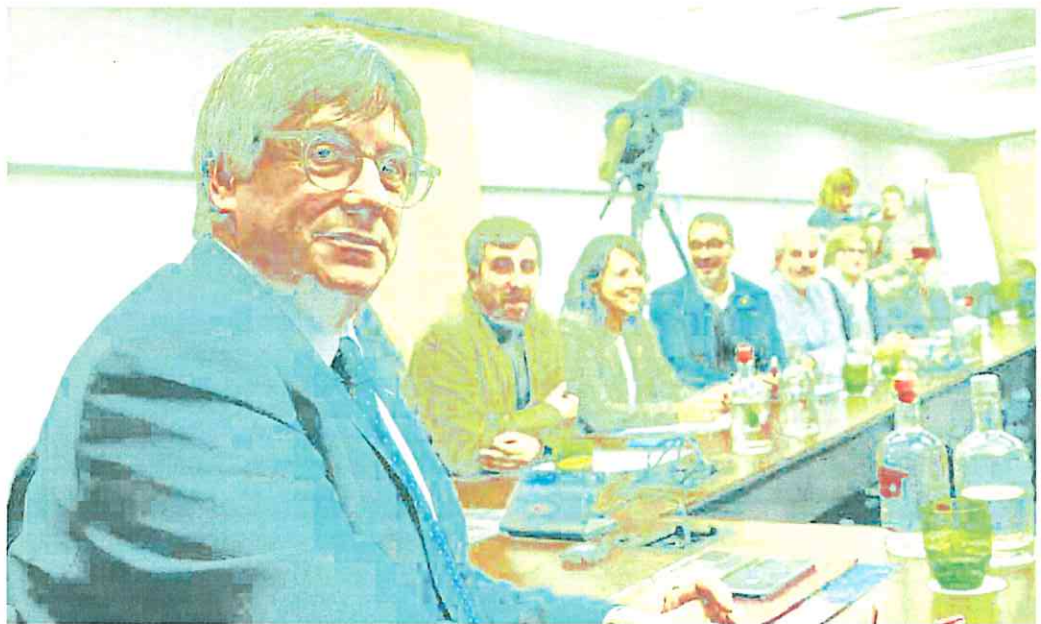
Puigdemont presidió la permanente de la cúpula de Junts en el mismo hotel en que hace dos meses fijó las condiciones para la negociación.

El expresidente reclama que el perdón cubra también a dirigentes implicados en casos ajenos al 1-O como Borrás