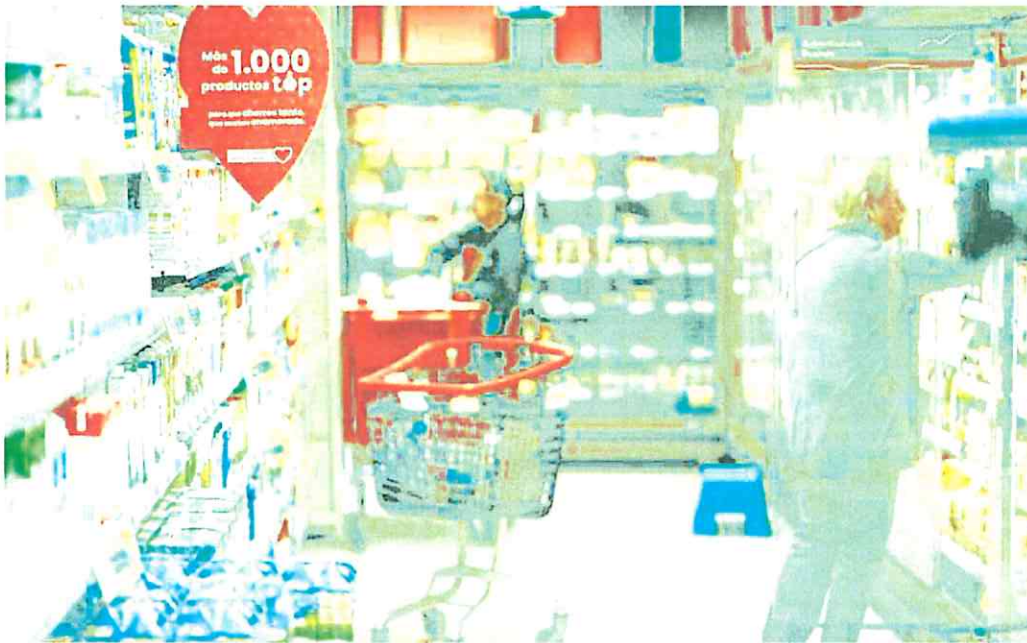
Dos personas hacen la compra en un supermercado.