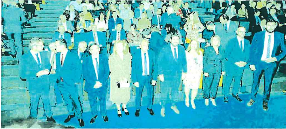
El Batel de Cartagena acogió este viernes por la tarde el acto del XXIII Día Mundial del Cooperativismo organizado por Ucomur.