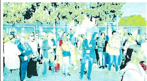
Madres y padres se concentraron a las puertas del colegio, este viernes.

ción preferente» o que el profesorado adscrito a estos puestos tuviese «compensaciones en su vida laboral como el poder acogerse a comisiones de servicio» para poder conseguir que al menos estén los dos cursos del ciclo.