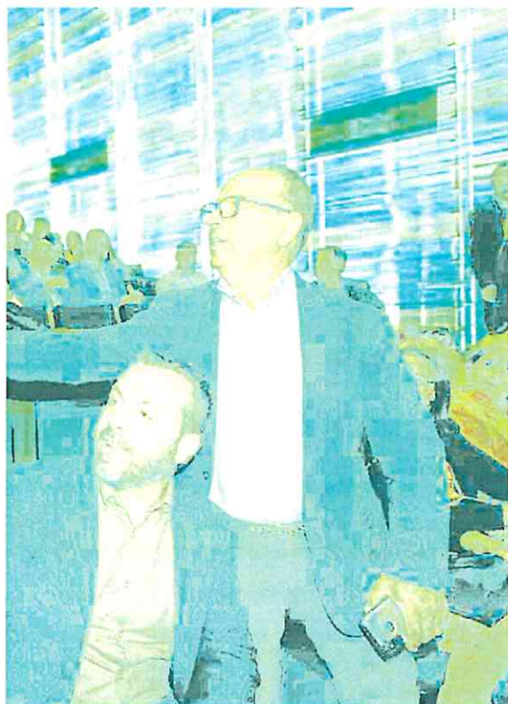
Ucomur celebrado en el Auditorio El Batel, en Cartagena.