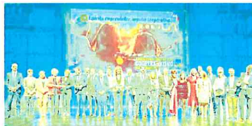
Los premiados ayer en la gala de Ucomur, en El Batel.

CARTAGENA. Con motivo del Día Mundial del Cooperativismo, Ucomur entregó anoche sus tradicionales galardones en el Auditorio El Batel, en Cartagena. La organización distinguió a Jacema, especialista en PVC y aluminio, y a Circúbica, una empresa de reciente creación pero que acumula éxitos debido a su apuesta por la economía circular y la reutilización de materiales rescatados y puestos al servicio de la enseñanza y el ocio infantil. En la misma gala, Marco Visual y Marbyt,