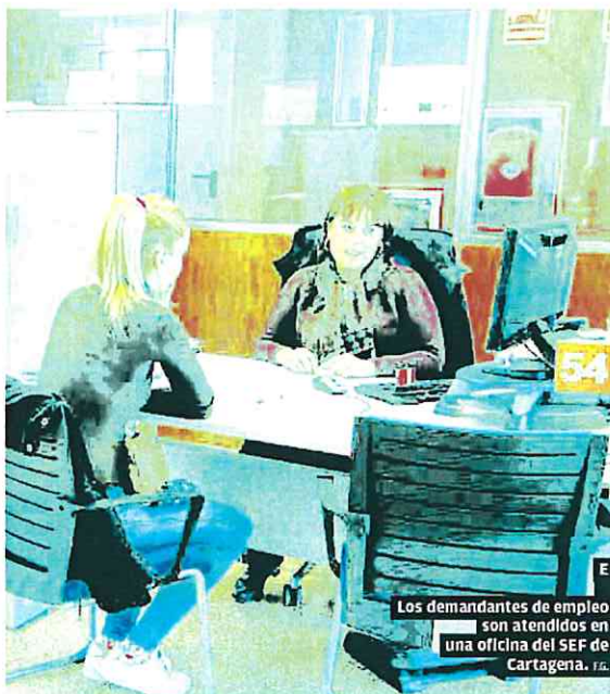
Los demandantes de empleo son atendidos en una oficina del SEF de Cartagena. 16.

En España el número de afiliados a la Seguridad Social ha crecido en 500.094 personas en los diez primeros meses del año y se ha situado en 20.740.988 trabajadores de alta.