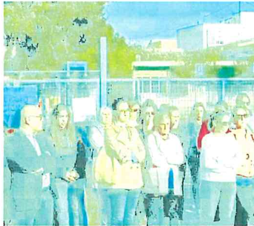
Concentración de protesta, ayer, a las puertas del colegio.

Madres y padres de alumnos del colegio Sagrado Corazón de Librilla protestaron ayer por la mañana a las puertas del centro escolar por los «problemas de seguridad» en las instalaciones, después de que se desprendiera parte de la cubierta del techo del pabellón de Infantil por el viento y cayera en el patio donde horas antes jugaban decenas de niños. De hecho, muchos padres decidieron que sus hijos no fueran a clase este viernes para evitar cualquier incidente porque «los pabellones no son seguros y el de la cubierta del techo no ha sido un caso aislado», según fuentes del AMPA. Los padres llevan pidiendo un nuevo colegio «desde hace una década», y ya en 2015 protestaron por el mal estado del