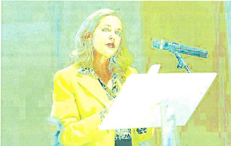
La vicepresidenta económica, Nadia Calviño, ayer en una jornada organizada por la APIE.