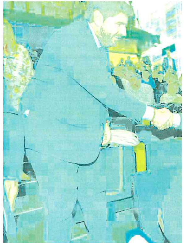
El presidente López Miras saluda a unos cooperativistas a su llegada al acto de

El presidente sostiene que hay que sentar a todas las comunidades y cambiar el sistema, en lugar de «ayudar a los de siempre»