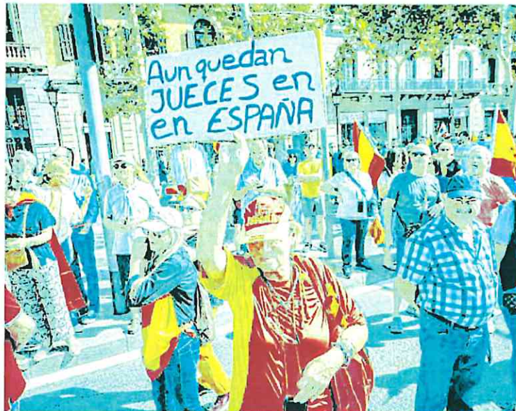
Manifestación de SCC contra la amnistía en Barcelona, el pasado mes de octubre.

Para que la declaración propuesta salga adelante los vocales proponentes necesitarían de al menos uno de sus dos compañeros del bloque conservador que no han suscrito la propuesta: el propio Guillarte o el vocal y también magistrado del Supremo Wenceslao Olea, que no siempre se alinea con este grupo en las votaciones que se vienen produciendo desde la dimisión en octubre de 2022 de Carlos Lesmes. Una muestra más de que los bloques conservador y progresista ya no existen como tal en el seno del órgano de gobierno