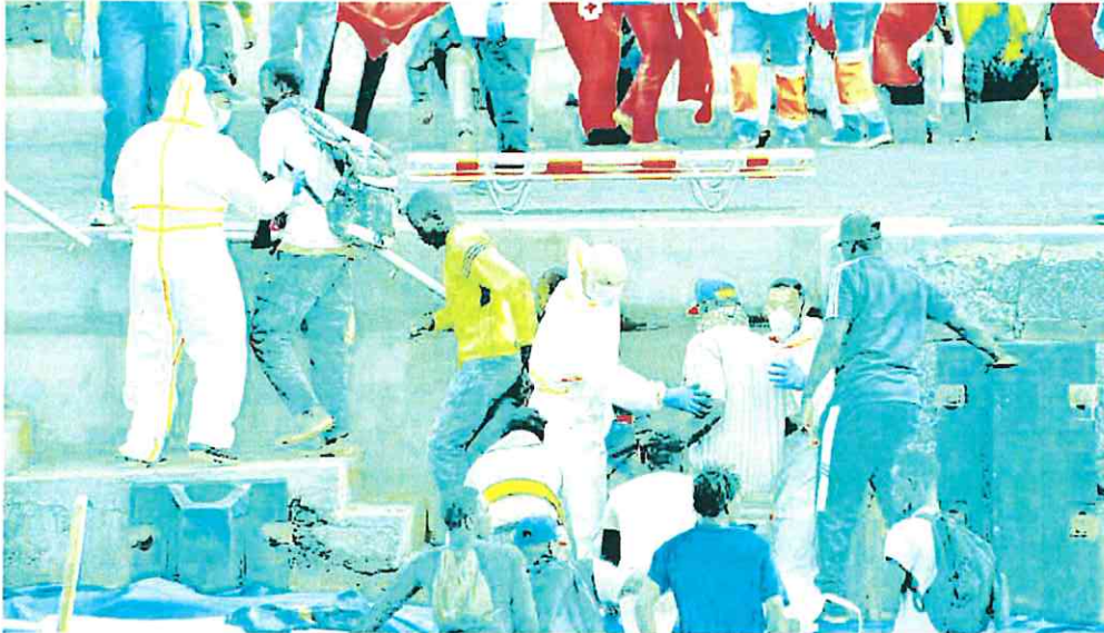
Migrantes llegados en un cayuco son desembarcados: posteriormente fueron repartidos por España, muchos por la Región.