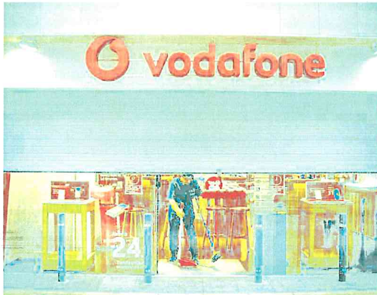
Una tienda de Vodafone. YVONNE ITURGAIZ

Y la situación se puede complicar aún más. «Lamentablemente esta es la baza comercial de los últimos quince años. A cor-