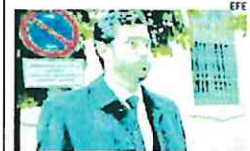
Cándido Conde Pumpido-Varela.

► La Policía investiga una denuncia telefónica contra tres hombres formulada por una mujer de origen brasileño