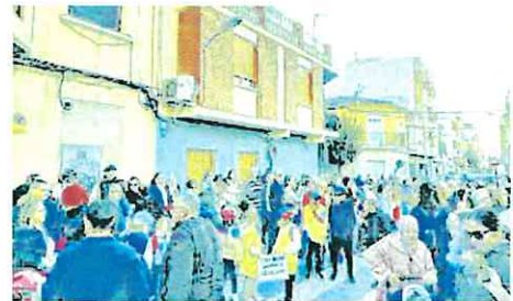
La protesta se realizó por la mañana en Cieza. J.G.B.

Desde el AMPA se mostraron disconformes con la decisión de reanudar las clases y varios padres y niños se manifestaron en la puerta del centro educativo,