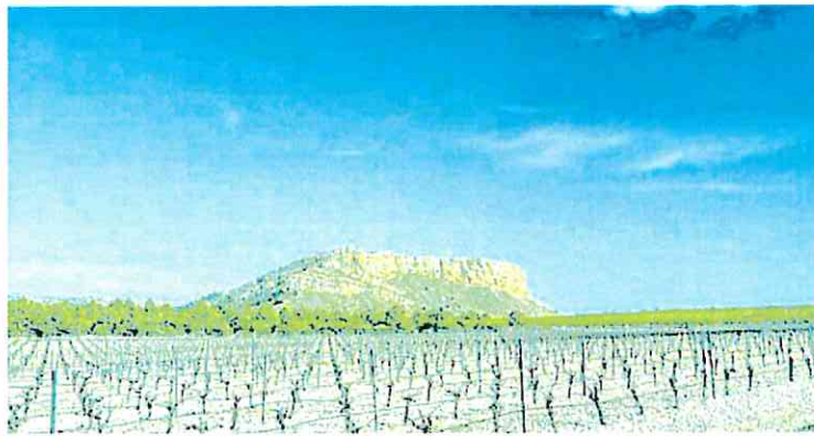
Imagen de cultivos leñosos en Jumilla.

Hay que tener en cuenta que las plantas entran en periodo invernal cuando la temperatura baja de los siete grados, de ahí la importancia de que haya suficientes horas de frío. Los meses fuertes para estas temperaturas se dan entre mitad de diciembre y mitad de febrero. Ese re-