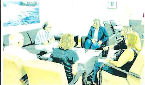
Reunión de la alcaldesa con la asociación EMACC.

Afirman que el índice de subcontratación supera «con creces» la plantilla propia del astillero cartagenero