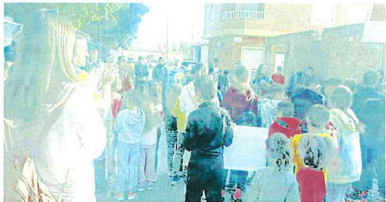
Madres, padres y alumnos se concentraron este lunes por la mañana a las puertas del colegio. L.O.

En este sentido, desde la Consejería aseguran que está previsto que los trabajos «se reanuden antes de final de año tras la resolución de expediente de modificación de gasto que ha sido necesario tramitar, y que las obras estén finalizadas en marzo de 2025».