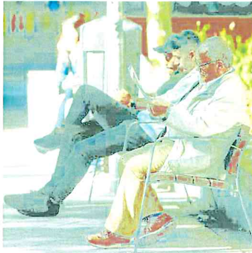
Un jubilado leyendo el periódico en el banco de un parque. J. R. LADRA

Porque el sistema de financiación de las pensiones contributivas que rige en España es el de reparto: las cotizaciones de los trabajadores pagan cada año las jubilaciones de los mayores. Y lo que la Seguridad Social ingresa por las cuotas de sus más de 20,8 millones de afiliados no llega para pagar las diez millones de pensiones que debe abonar cada mes, pese a las diferentes reformas que los go-