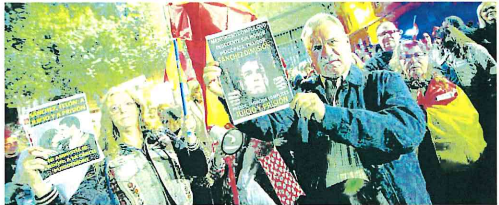
Centenas de manifestantes se agolparon anoche frente a la sede del PSOE murciano, en la calle Princesa.

Durante una hora se estuvieron manifestando mientras gritaban insultos a los socialistas, aunque dentro de la sede ya no quedaba nadie. Esa concentración no fue comunicada a la Delegación del Gobierno, pero no ha sido la única que se ha producido en ciudades españolas y tras su convocatoria por redes sociales está la asociación juvenil Revuelta, surgida hace solo un mes e im-