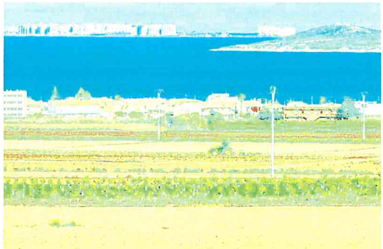
Fincas agrícolas en producción junto al Mar Menor.

La Ley de Participación Institucional aprobada en el año 2017 obliga a incluir en la Ley de Presupuestos partidas con asignación nominativa para compensar los gastos en los que incurran las organizaciones empresariales y sindicales más representativas.