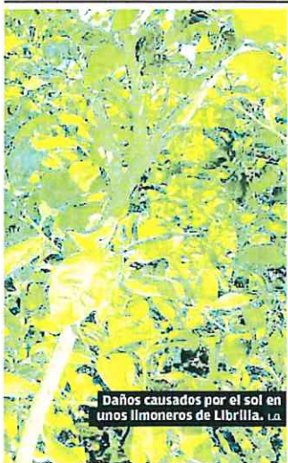
Daños causados por el sol en unos limoneros de Librilla. LA

Además, la Comunidad de Regantes pidió información sobre el acuerdo a suscribir con Actamed relativo a la concesión de la ampliación de la Instalación Desaladora de Agua de Mar (IDAM) de Águilas. La CHS respondió que, una vez establecido el correspondiente a la IDAM de Torre Vieja, se podría preparar el correspondiente a la IDAM de Águilas, en términos similares. Los regantes lorquinos se interesaron por la situación del resto de los recursos hídricos para la planificación de las próximas campañas de cultivos. La CHS dijo que había que ajustarse a los recursos que hay.