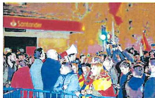
Un manifestante pide a los radicales que no participen.

Sobre las 19:20 horas se empezaron a congregarse ciudadanos en la confluencia de las calles Ferraz y Marqués de Urquijo, algunos con banderas de España, que han coreado frases como «Puigdemont a prisión», «España nunca jamás será vencida», «Pedro Sánchez dimisión», «No es un presidente, es un delincuente», «España está que arde», «España una y no 51» u «Hoy a Ferraz, mañana a Moncloa». Varios de ellos portaban una gran pancarta con