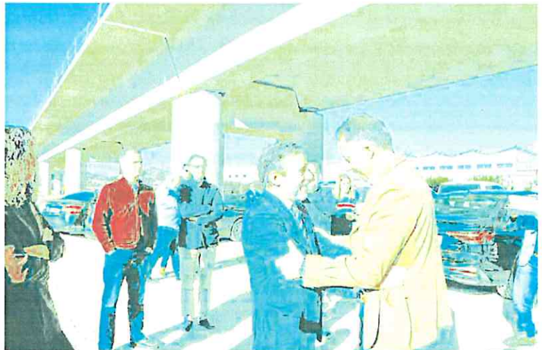
El delegado del Gobierno y el alcalde de Lorca, durante la visita a las obras del AVE en Terça.