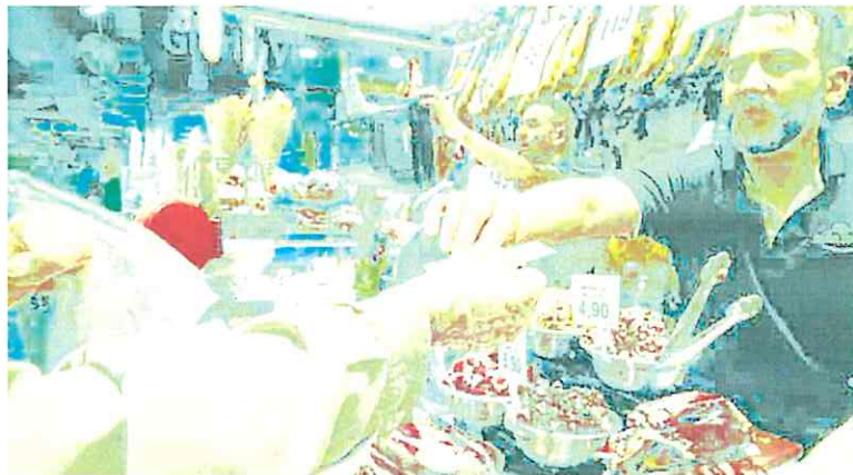
Una persona paga la compra hecha en un puesto de charcutería de un mercado. EVA PAREY

están protegidos bajo el paraguas de un convenio y los que han tenido una subida media de sus ingresos del 3,4%, la mayor de los últimos quince años aunque una décima por debajo del IPC. Hay que retrotraerse hasta 2008 para