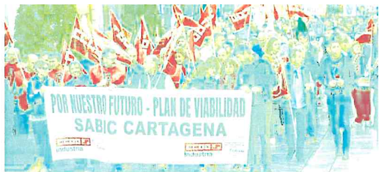
Participantes en la manifestación contra el ERE de Sabic, a su paso por la calle del Carmen.

«Hemos puesto en marcha un plan social y creemos que con recolocaciones y prejubilaciones podríamos conseguir que ningún compañero vaya al paro, aunque aún no hay nada cerrado, hay que