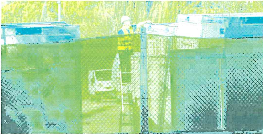
Un obrero monta casetas modulares para alojar a los inmigrantes, en el recinto del antiguo Hospital Naval, ayer.