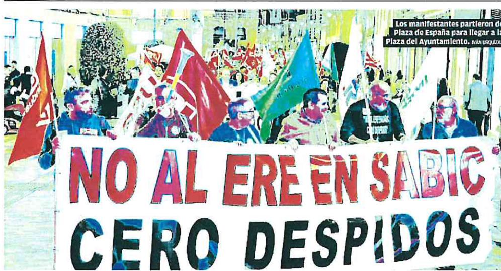
Los manifestantes partieron de Plaza de España para llegar a la Plaza del Ayuntamiento. IWÁN URQUIZAR