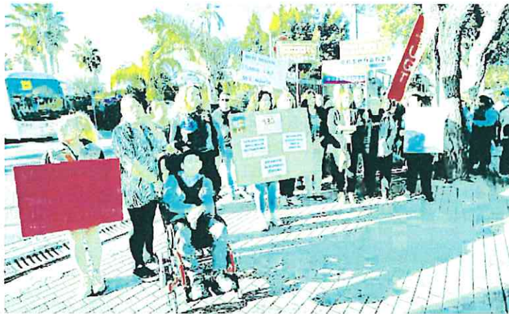
La protesta se realizó este viernes a las puertas del centro educativo de Murcia.

En el acto convocado por las madres y padres también se sumaron miembros de la oposición en la Asamblea Regional, como las di-