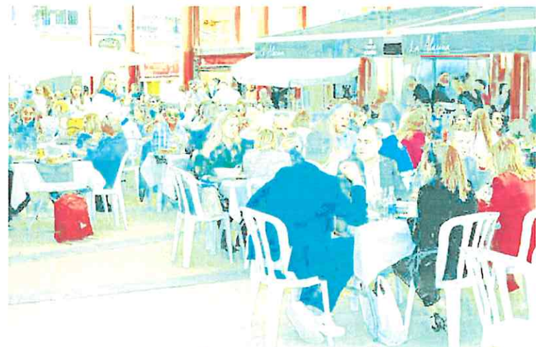
Terraza de un restaurante abarrotada de clientes.

Por otra parte, la exministra francesa de Economía insistió en la importancia de que los Estados sean prudentes en su política fiscal. Y es que un gasto excesivo podría obligar al BCE a subir los tipos de nuevo para contrarrestar el mayor gasto aportado por políticas presupuestarias expansivas. Las declaraciones de Lagarde estuvieron precedidas por el discurso del presidente de la Reserva Federal de Estados Unidos, Jerome Powell, el día anterior. Este afirmó que quizá la política monetaria no estaba aún lo suficientemente tensionada y el precio del dinero tal vez no fuera lo suficientemente alto para terminar la batalla contra la inflación, despertando así nuevos temores a otra alza de tipos.