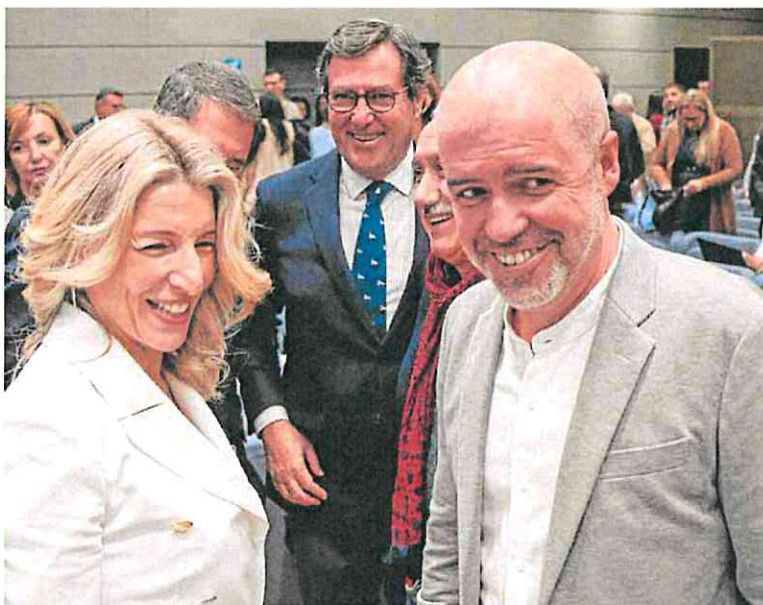
Yolanda Díaz, con el presidente de la CEOE, Antonlo Garamendi (c), y los secretarios generales de UGT y CC OO, Pepe Álvarez y Unal Sordo, durante la toma de posesión de su cargo como ministra, el martes.

Díaz planteó una contrapropuesta que no se aleja demasiado de la CEOE y que puede ser perfectamente asumible por ellos: subir el salario mínimo al menos un 3,7% o 3,8%, en línea con lo que se ha elevado la inflación media este año, frente al 3% que ofrece la patronal. El sueldo de los más de 2,5 millones de trabajadores que menos ganan, situa-