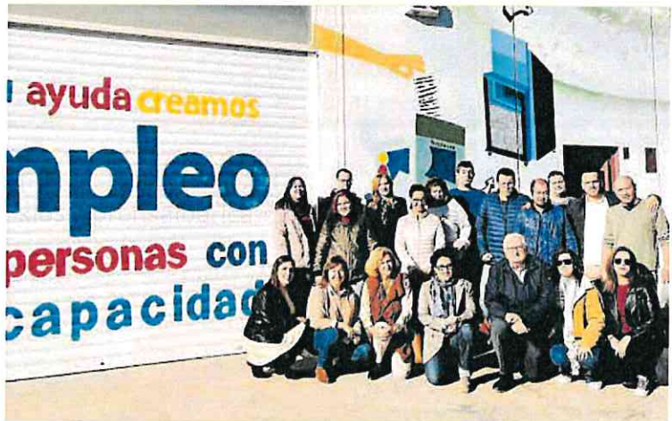
Participantes del curso 'Auxiliar de Manipulado y Finalización de Productos Gráficos'.

El curso cuenta con 220 horas teóricas y 80 prácticas que las realizan en Labor Viva, el centro de