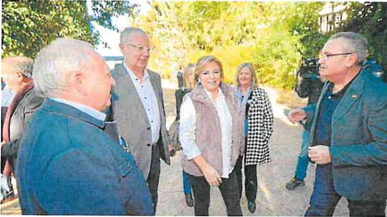
Antonio Jiménez, José Antonio Rulz Vivo, Elena Valenciano y Santiago Navarro, ayer, antes de la tertulia.