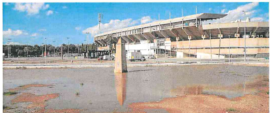
Los terrenos del Plan Rambla, en Cartagena, han sufrido algunas correcciones en el nuevo mapa de la CHS.

Desde 2021 y hasta julio de este año, la Comunidad también ha abierto 189 informes por daños al patrimonio natural o 28 multas a granjas de cerdos por no cumplir las limitaciones a una actividad condicionada por la declaración de zona vulnerable a los nitratos.