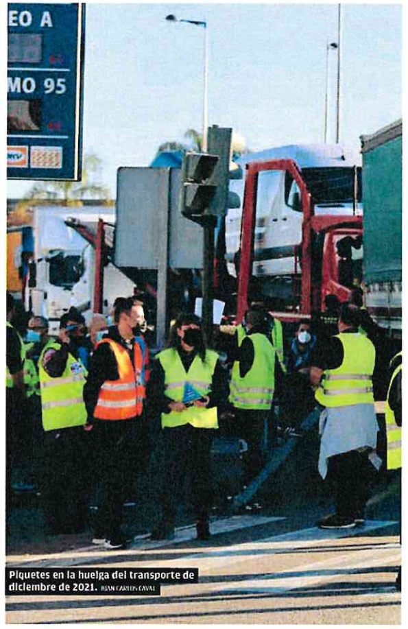
Piquetes en la huelga del transporte de diciembre de 2021.