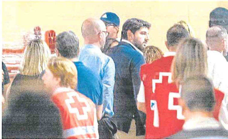
El presidente López Miras se reunió ayer por la tarde con familiares de las víctimas.

Miras, visiblemente emocionado al salir de su encuentro con los familiares que estaban siendo atendidos en un espacio habilitado en el Palacio de los Deportes, indicó a preguntas de los medios de comunicación que aún no se conocen con certeza las causas que provocaron el siniestro, y que hay que dar tiempo a los investigadores de la Policía Nacional para que realicen su trabajo. En cuanto a la identificación de los 13 cuerpos recuperados, comentó que también la Po-