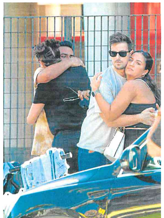
Varias personas se abrazan en las inmediaciones de las discotecas, ayer.

«Mis condolencias en estos momentos tan tristes para nuestros vecinos de la Región de Murcia»