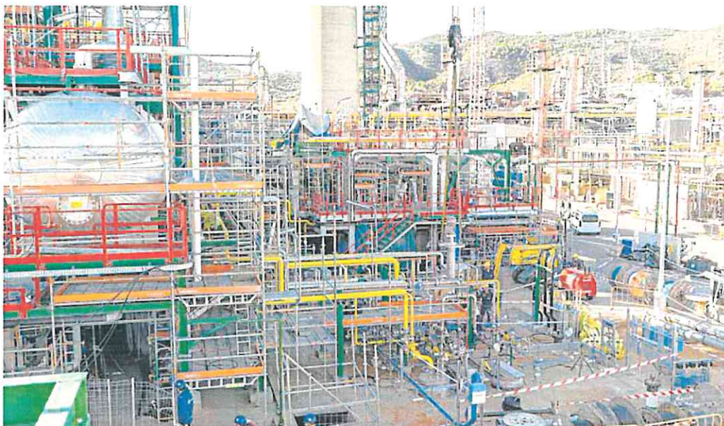
Vista general de parte de la planta de biocombustibles que Repsol acaba de construir en su complejo industrial de Escombreras.