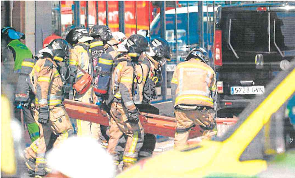
Bomberos extraen uno de los cadáveres de la discoteca Fonda Milagros de Murcia, en las labores de rescate.