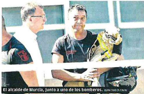
El alcalde de Murcia, junto a uno de los bomberos.