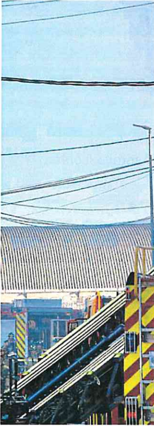
afectado por el fuego.