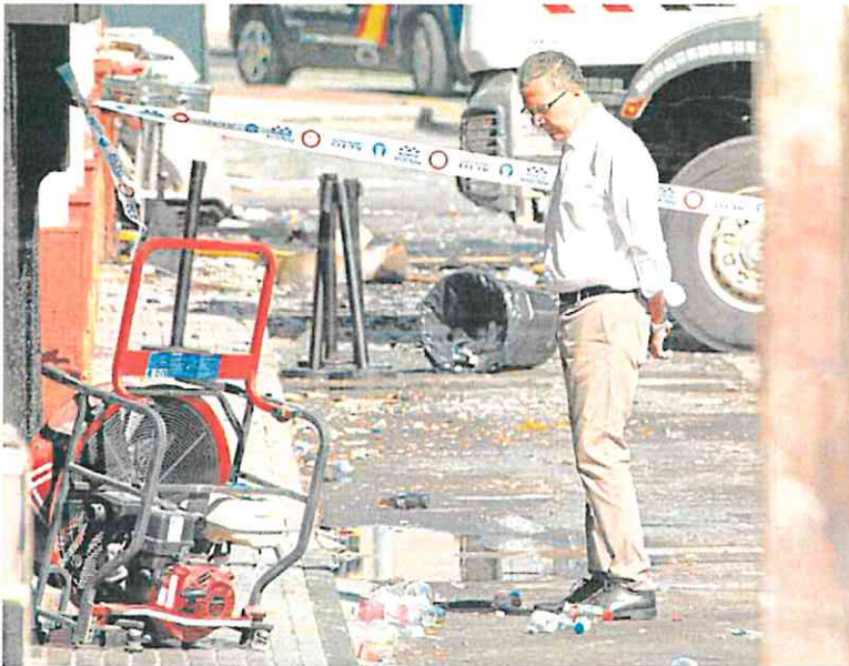
El alcalde de Murcia, José Ballesta, ayer en la zona del siniestro.