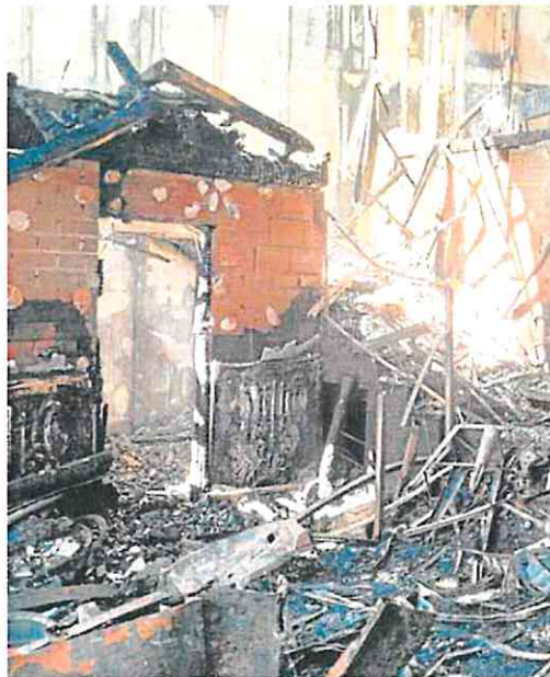
Estado en que quedó la zona calcinada.