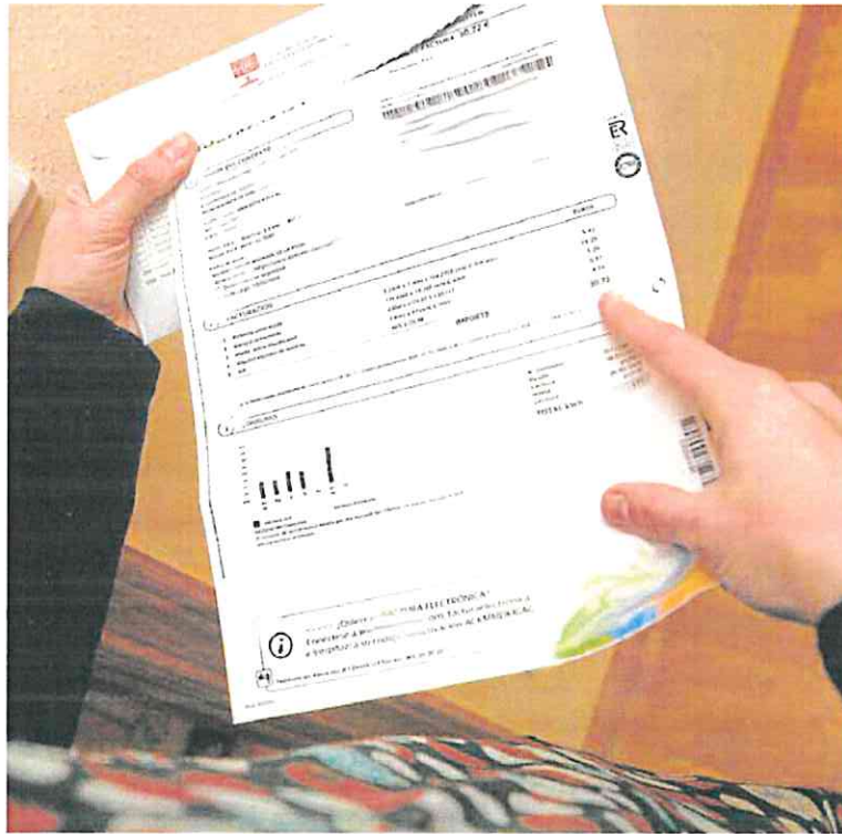
Una mujer analiza su recibo de la luz. R. C.

El otro impuesto energético que se encuentra reducido a su mínima expresión es el Especial