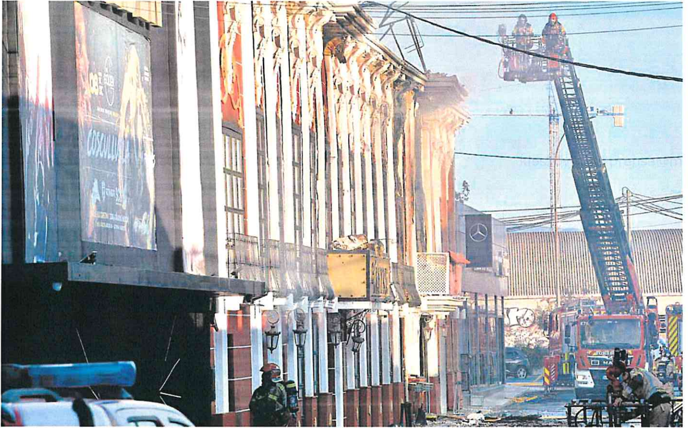
Bomberos tratan de sofocar las llamas en el interior de la discoteca Fonda Milagros de Murcia, cuyo interior colapsó por las altas temperaturas, y en Teatre, el local de ocio nocturno contiguo