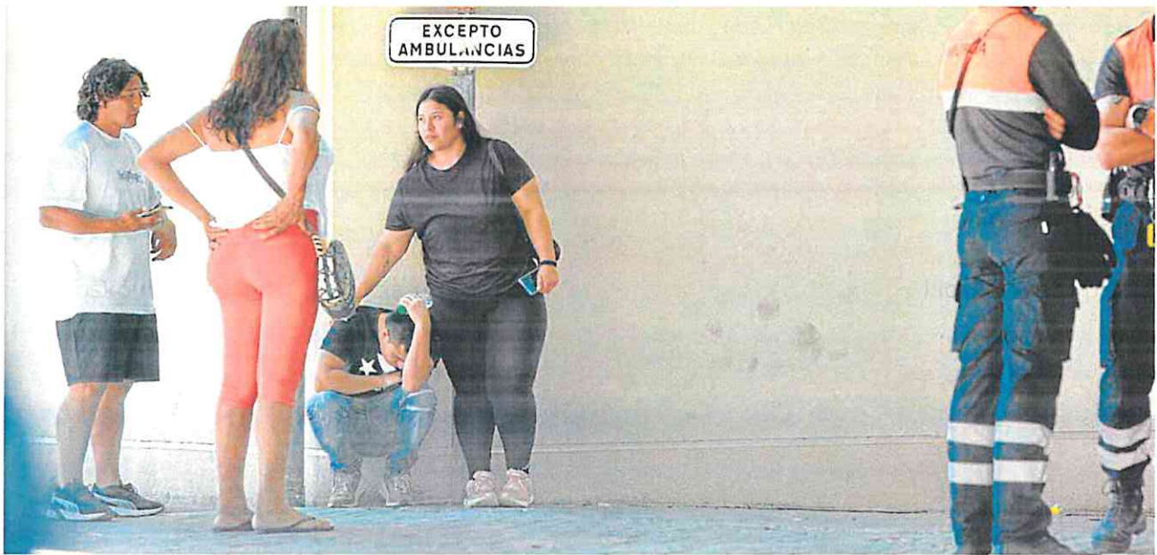
Una persona del entorno de las víctimas del incendio, abatida por la tragedia, recibe muestras de consuelo en el Palacio de Deportes de Murcia.