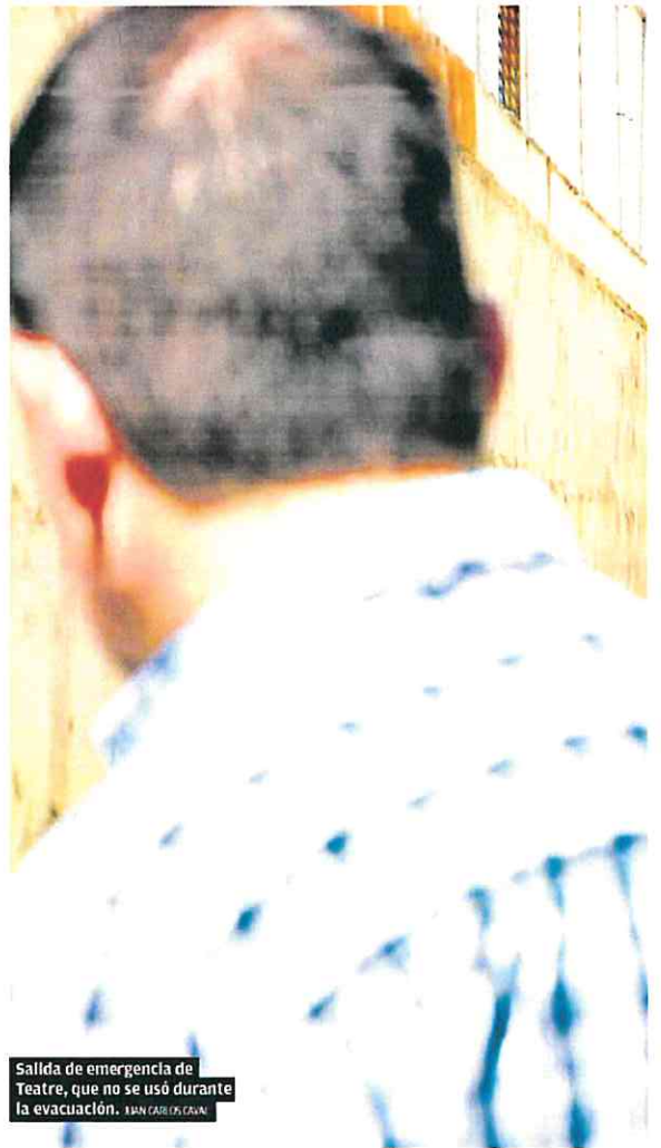
Salida de emergencia de Teatre, que no se usó durante la evacuación.