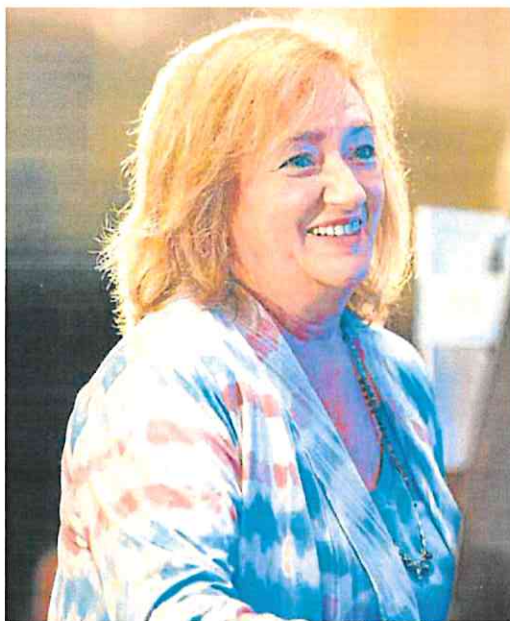
La presidenta de la AIReF, Cristina Herrero.

La primera fase de la evaluación supuso revisar 33.000 millones de gasto y la próxima apenas alcanza los 10.000 millones