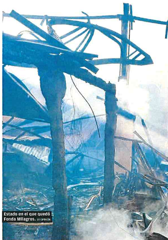
Estado en el que quedó Fonda Milagros. LA OPINIÓN

Este fue el caso, precisamente, de Teatre. Tal y como ya informó este diario, el inspector de actividades respondió el orden de precinto del edil socialista asegurando que había « contactado » con el titular de la discoteca y que este aportó la « documentación técnica que les faltaba para la tramitación de la legalización ». El inspector cerró su informe asegurando que daba parte de estos hechos « para sus efectos oportunos ». Una información que, según Guerrero, no le llegó en ningún momento. A partir de este momento, el Consistorio murciano no ejecutó el precinto durante más de un año y permitió que las discotecas continuaran funcionando sin licencia.