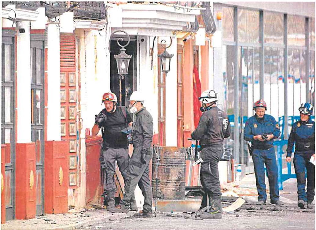
Investigadores forenses recogen pruebas en las discotecas de Las Atalayas incendiadas el pasado domingo.

Casi surrealista resultó la rueda de prensa del pasado lunes en la que se informaba de que dos de los locales siniestrados no contaban con licencia de actividad desde hace más de año y medio y de que la Fonda Milagros ni siquiera existía formalmente para el Consistorio. Tanto el anterior responsable del departamento, el socialista Andrés Guerrero, como el actual descargaron la respon-