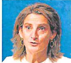
Teresa Ribera.

Fuentes del Gobierno regional indicaron que el informe de Medio Ambiente se halla «en fase final de elaboración» y estará listo «en unos días»; y que la Dirección General de Salud Pública emitirá su informe «en breve». Respecto a Medio Ambiente, añadieron: «Nos nos consta que nuestro informe condicionara la tramitación ordinaria del expediente, dado que el Ministerio nos transmitió que se-