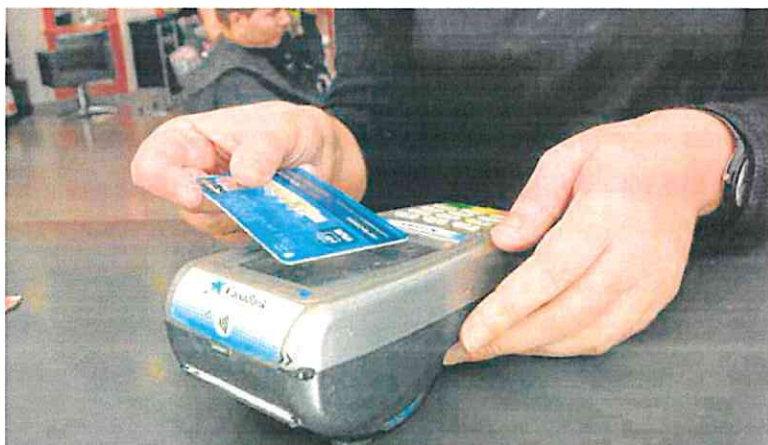
Un cliente paga con una tarjeta de crédito en un establecimiento comercial. R. C.