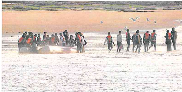
Un grupo de inmigrantes desembarca en la playa francesa de Le Portel después de un intento fallido de cruzar el Canal de la Mancha, el pasado lunes.

El acuerdo cerrado ayer afecta, más concretamente, al mecanismo de gestión de crisis. Esta herramienta se activaría en caso de llegadas masivas al bloque co-