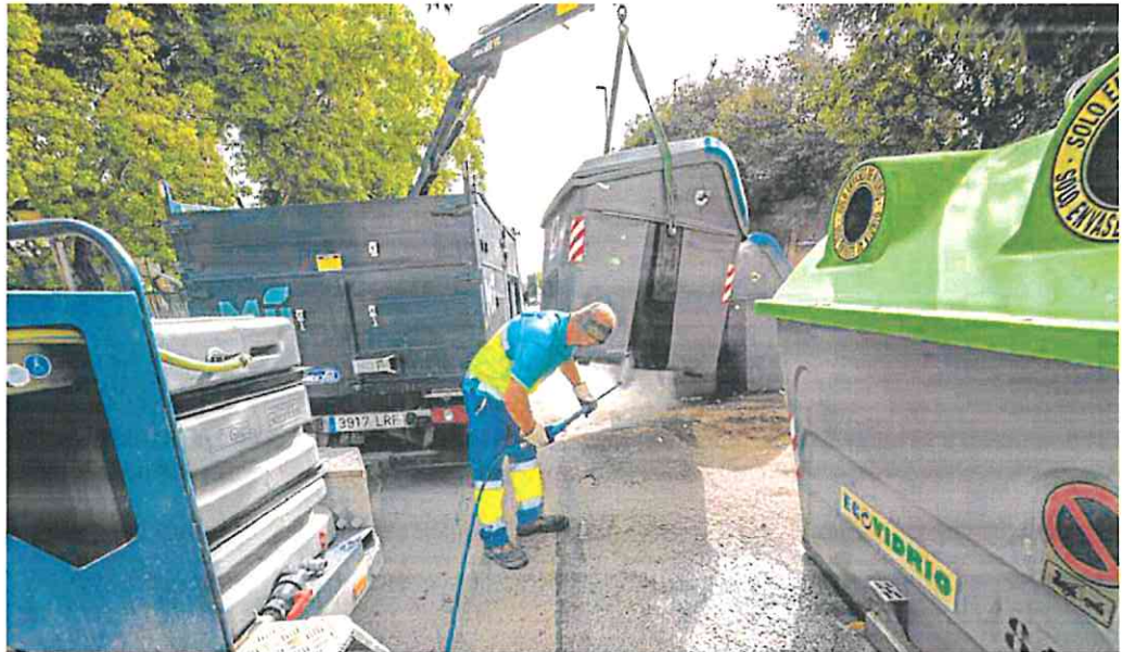
Un operario de la empresa que realiza la limpieza viaria en el municipio lava uno de los contenedores.

Por lo que se refiere al recibo de la basura, Muñoz manifestó que el Consistorio murciano cumplirá con su obligación de aplicar la tasa estatal de residuos y suelos contaminados que el Gobierno de España ha derivado a las entidades locales y que se incluye en la ley 7/22 de Residuos