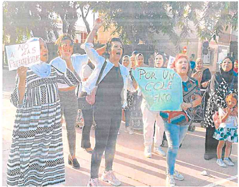
Un grupo de madres durante la protesta, ayer, en el colegio Bienvenido Conejero, en Los Alcázares.

«Es una falta de respeto. Las aulas prefabricadas no están climatizadas, ni insonorizadas, cuando llueve parece que se cae el mundo, y ahora hace un calor