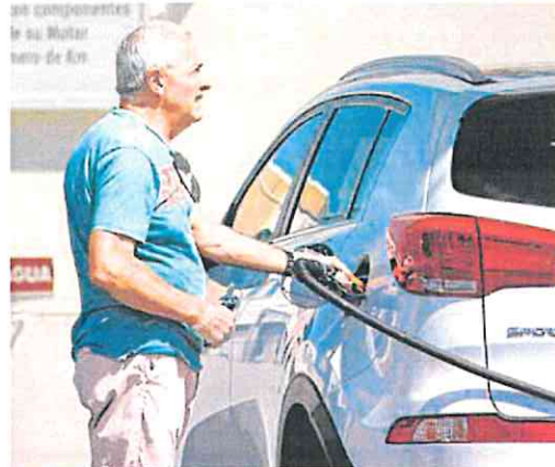
Un conductor en una estación de servicio.

El precio de ambos carburantes está consolidado por encima de los niveles en los que se situaba antes del estallido de la guerra de Ucrania por la invasión rusa, que comenzó el 24 de febrero de 2022 y que, en el caso del diésel, era de