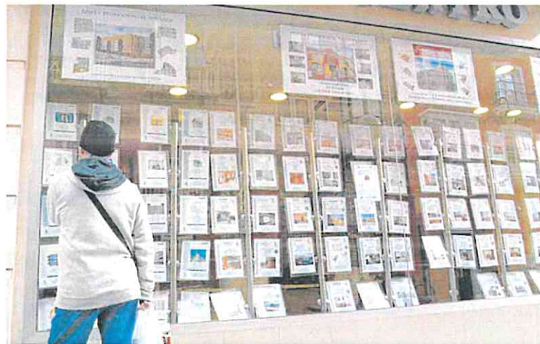
Ofertas de viviendas en una agencia Inmobiliaria de Cartagena.

Pese a la incertidumbre sobre la operación, en Telefónica transmiten que, de salir adelante, supondrá un revulsivo para su cotización, que apenas ha variado desde el anuncio. Sus acciones se movían entonces en 3,75 euros, con lo que apenas han subido un 0,8% hasta los 3,78 actuales.