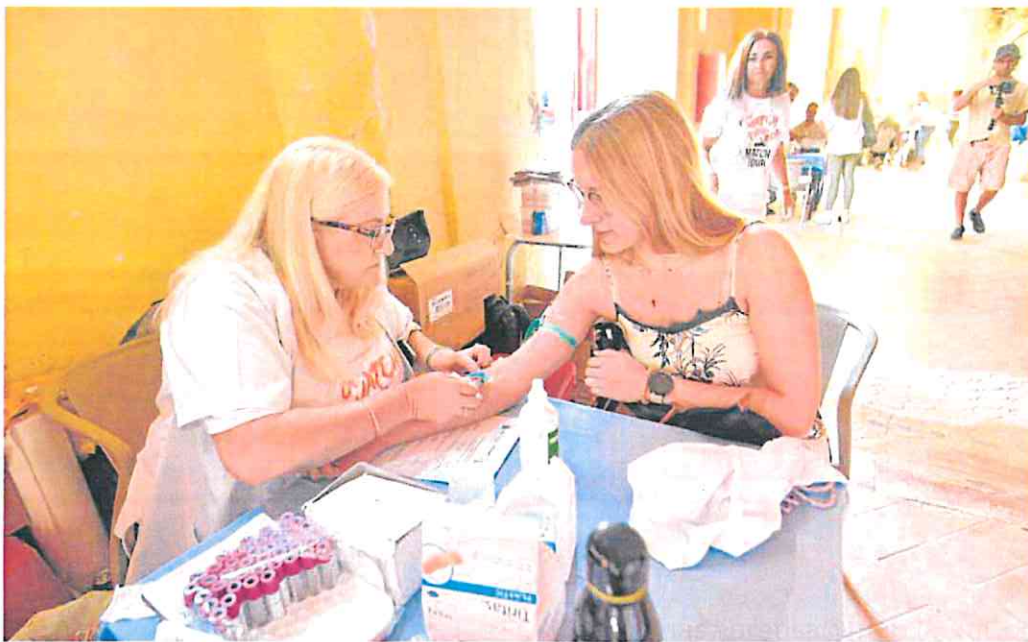
Una enfermera saca sangre para una analítica a una nueva donante de médula, ayer en la plaza de toros de Murcia.

Cesm defiende el nuevo modelo pero reclama una nueva instrucción que aclare las dudas, porque el documento está «mal redactado». Mientras, el SMS niega cualquier problema. La actividad en el Morales «se está incrementando por la tarde», aseguran en este departamento, y no solo «no hay confusión» sino que la instrucción «clarifica perfectamente» la regulación de las peonadas, defienden. «Mediante la modificación aprobada se pretende homogeneizar los regímenes aplicables. Todos los profesionales tendrán las mismas posibilidades y unas retribuciones similares», señala el SMS. Se introduce, en definitiva, «una mayor flexibilidad».