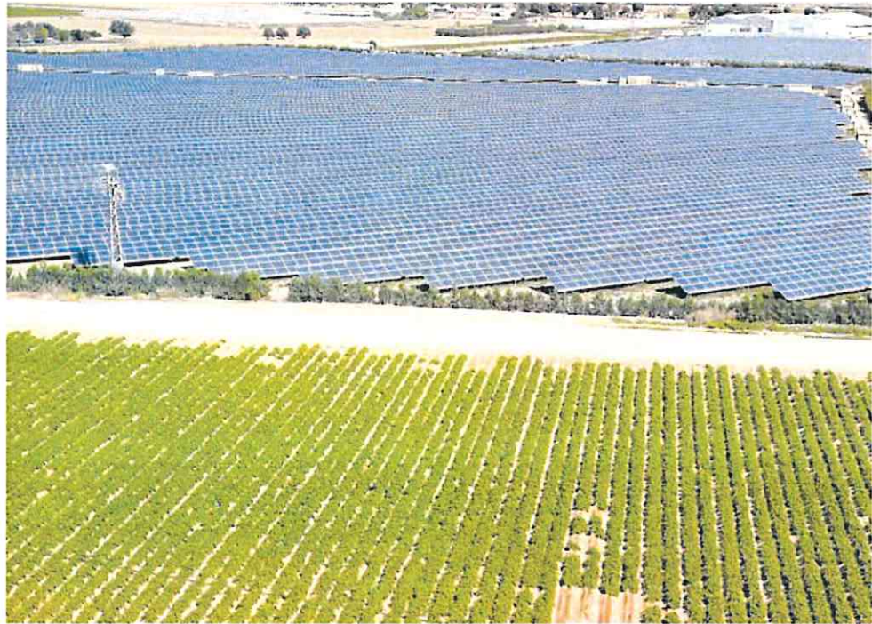
Placas solares en el Campo de Cartagena. FUNDACIÓN INGENIO

Desde un primer momento comentan los protagonistas de esta historia que ellos, los agricultores, no se oponen a la transición energética, pero claman por un equilibrio. Proponen que las placas solares sean complementarias y se instalen en tierras improductivas,