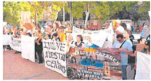
Pancartas de protesta frente a la Consejería, ayer.