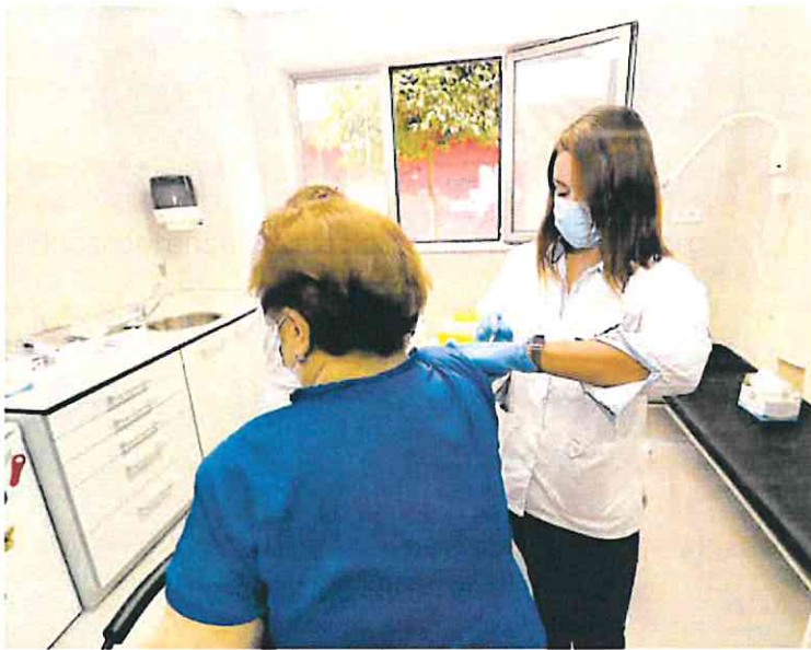
Vacunación contra la gripe en el centro de salud Floridablanca de Murcia.