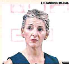
La líder de Sumar, Yolanda Díaz.

Redactada por un equipo de reconocidos penalistas, el borrador de la norma solo consta de dos artículos. En el primero, deja claro el perímetro de la futura