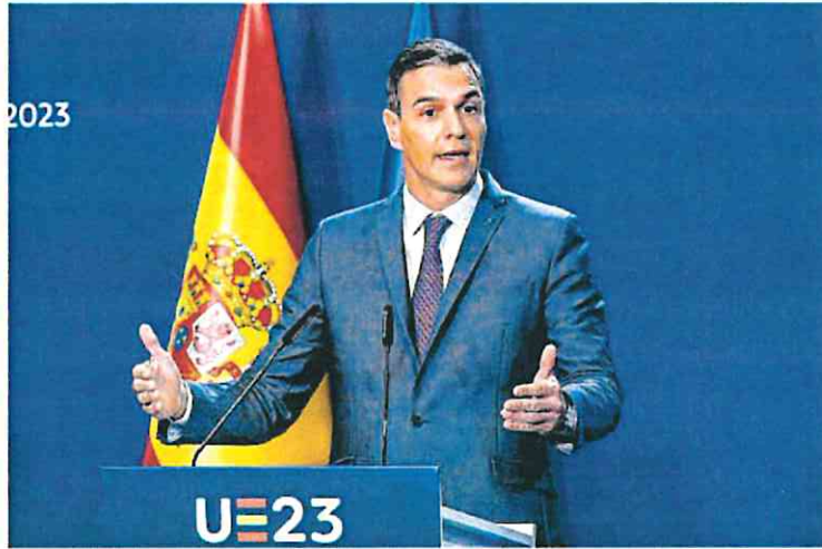
El presidente del Gobierno en funciones, Pedro Sánchez, ayer, en la cumbre de Granada.

Esa propuesta de Sumar, eso sí, le sirvió para que la palabra «am-