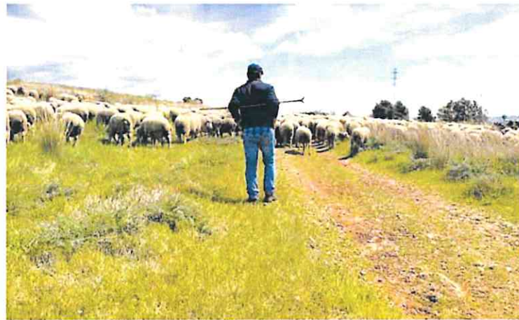
Un pastor junto a su rebaño de ovejas.

► En toda España más de 70.000 productores de carne de vacuno, ovino y caprino y productores de leche se beneficiarán de 332 millones