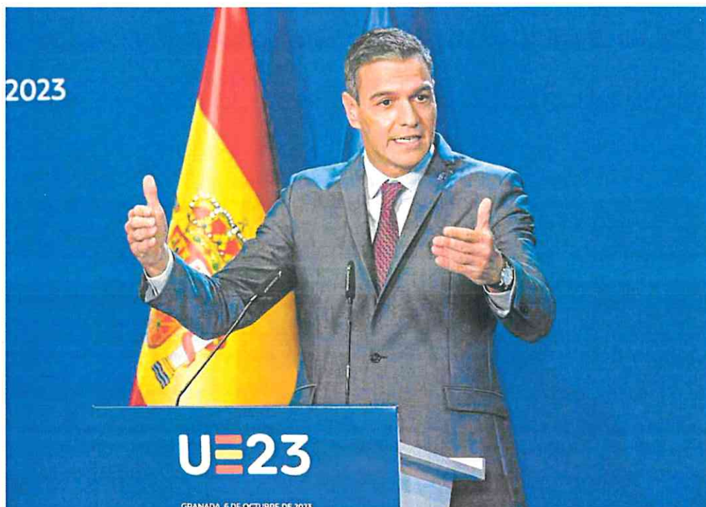
El presidente Sánchez, en la comparecencia que protagonizó en Granada al término del Consejo Europeo.

Félix Bolaños evidencia el malestar de los socialistas con la vicepresidenta y pide «trabajar con discreción»