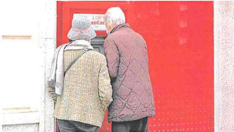
Una pareja de jubilados utiliza el cajero automático de un banco.

El origen de este conflicto entre banco y cliente se debe al incremento de las comisiones anuales sobre las cuentas corrientes, una práctica que hasta hace poco tiempo se encontraba desaparecida o, en su caso, se bonificaba directamente por parte del banco sin generar ningún tipo de problema. Pero el mantenimiento de los tipos de interés al 0% desde 2014 hasta bien entrado el 2022 y la necesidad de generar más recursos para la entidad ha resucitado un