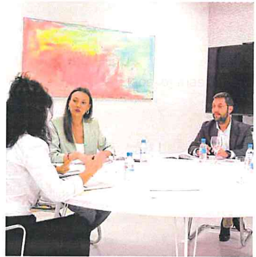
La consejera Conesa y el director del Itrem en la reunión, ayer.

Respecto a los resultados de este último puente festivo se informó de que los hoteles de las tres principales ciudades (Murcia, Cartagena y Lorca) registraron una ocupación media del 80%, mientras que los de la Costa Cálida llegaron al 93%, lo que equivale a alcanzar una ocupación con niveles de temporada alta. Asimismo, en las otras modalidades alojativas, los apartamentos turísticos