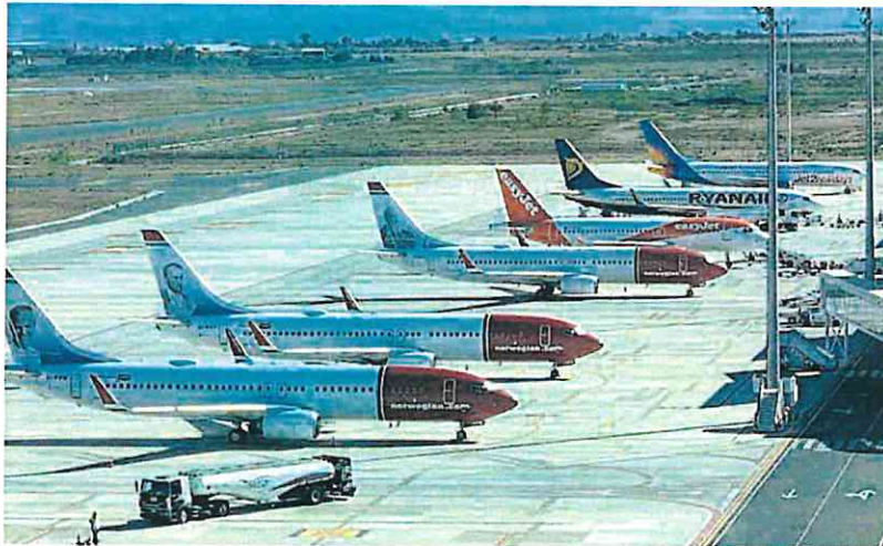
Aviones en el Aeropuerto de Corvera