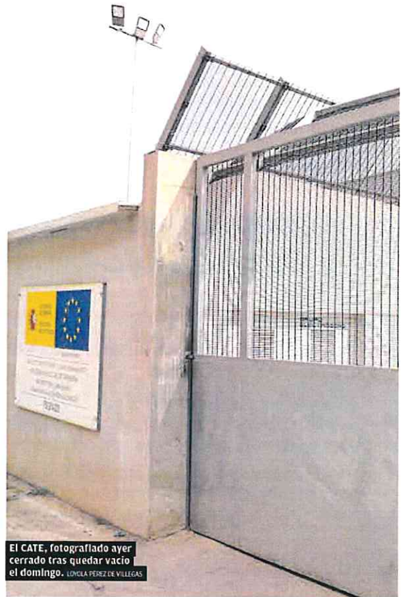
El CATE, fotografiado ayer cerrado tras quedar vacío el domingo. LUCILA PÉREZ DE VILLEGAS

El extranjero pendiente de concesión de asilo puede circular libremente por España. Pero, imposibilitado de ganarse la vida en condiciones normales, no tendrá un domicilio fijo o no se lo dirá a las autoridades. Su última dirección conocida será el centro de estancia temporal en el que fue acogido. Esto es, será muy difícil notificarle la expulsión.