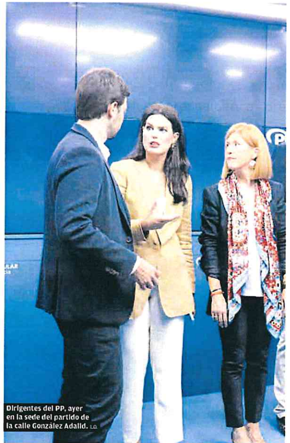
Dirigentes del PP, ayer en la sede del partido de la calle González Adalid. Lo