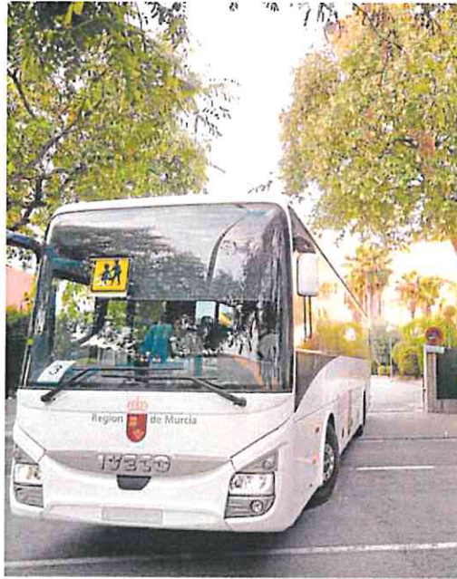
Un autobús de transporte escolar en Espinardo.

La Consejería de Educación insiste en que «continúa trabajando junto a las empresas para poder ofrecer este servicio a la mayor brevedad posible», pero no concreta cuándo dispondrán de transporte escolar todos los estudiantes murcianos. La Administración y la patronal Froet explicaron la pasada semana que «el 90% de las rutas de transporte escolar están ya cubiertas, y trabajamos conjuntamente para el restablecimiento total del servicio. La caducidad de la vida útil