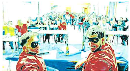
Ponencia especial a cargo del dúo satírico Cojera Murciana.

dolos a la realidad social de las personas con discapacidad física y orgánica, según explican desde Famdif. Este año, el enfoque de las jornadas se centra en la importancia del bienestar psicosocial, el derecho a la salud y en ellas destaca una ponencia a cargo del dúo «Cojera Murciana».