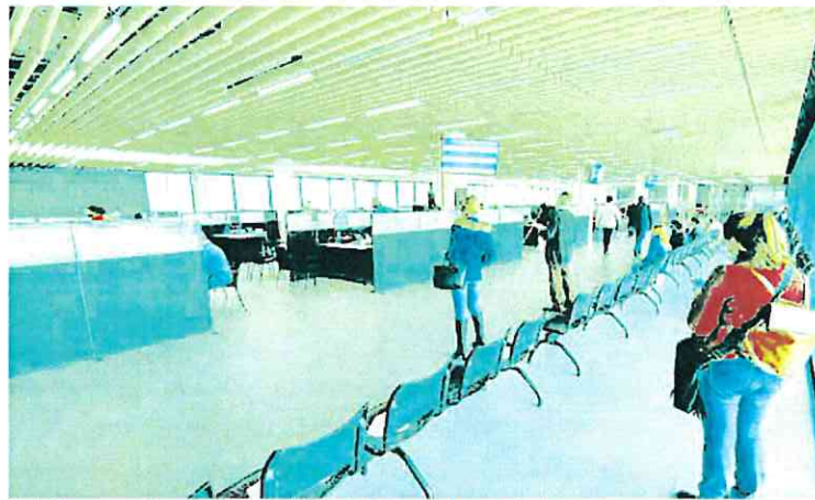
Contribuyentes en la sede de la Agencia Tributaria durante la campaña de la renta.

► Una sentencia del Supremo les permite reclamar una compensación por no haberse podido deducir las cuotas abonadas a su antigua mutualidad