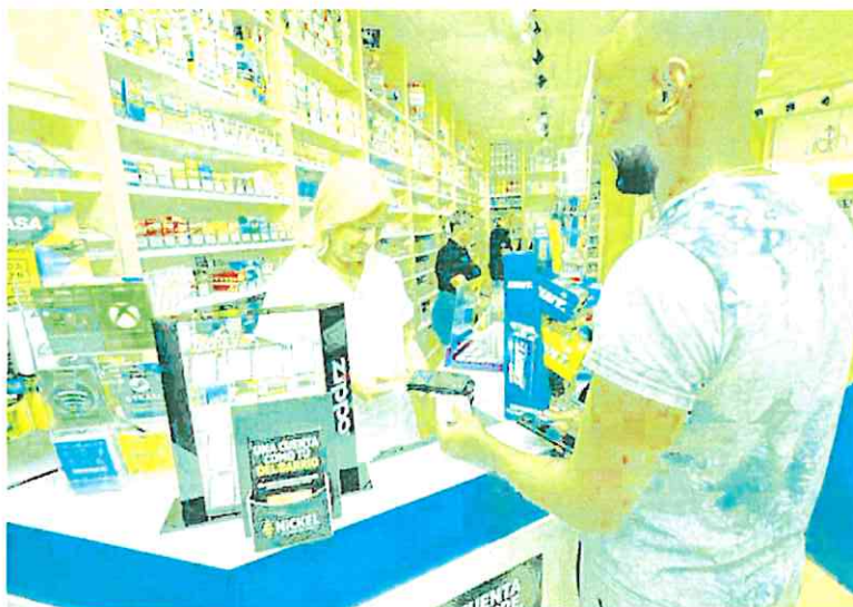
Un estanco murciano atiende a un cliente como 'cajero Nickel'.

4 Megasucursal especializada. CaixaBank ha abierto su primera oficina 'Store Premier' en Cartagena, en las dos primeras plantas del Palacio Pedreño (Calle del Carmen, 1). Ocupa más de 680 m 2 . Con su apertura ya son once las oficinas de la entidad de su modelo 'Store Premier' en la Región, situadas en Murcia, Cartagena, Lorca, Molina, Cieza y Caravaca. Este tipo de grandes sucursales están concebidas para prestar servicios especializados a clientes muy solventes y a empresarios.