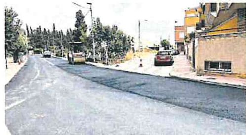
Máquinas trabajando en esas vías de Cabezo de Torres

vé que las obras finalicen este viernes. Se trata de una actuación demandada por los vecinos, ya que esta vía tiene mucho uso, al conectar dos viales arteriales dirección este-oeste de la pedanía. También se ha renovado el pavimento en la Avenida Juan XXIII, muy transitada por conectar con Zarandona.