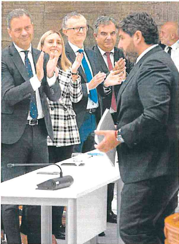
aplauden a López Miras tras pronunciar su discurso.

«El sector agroalimentario, las empresas, los autónomos y comerciantes, cada vez más asfixiados, seguirán recibiéndolo todo nuestro apoyo».