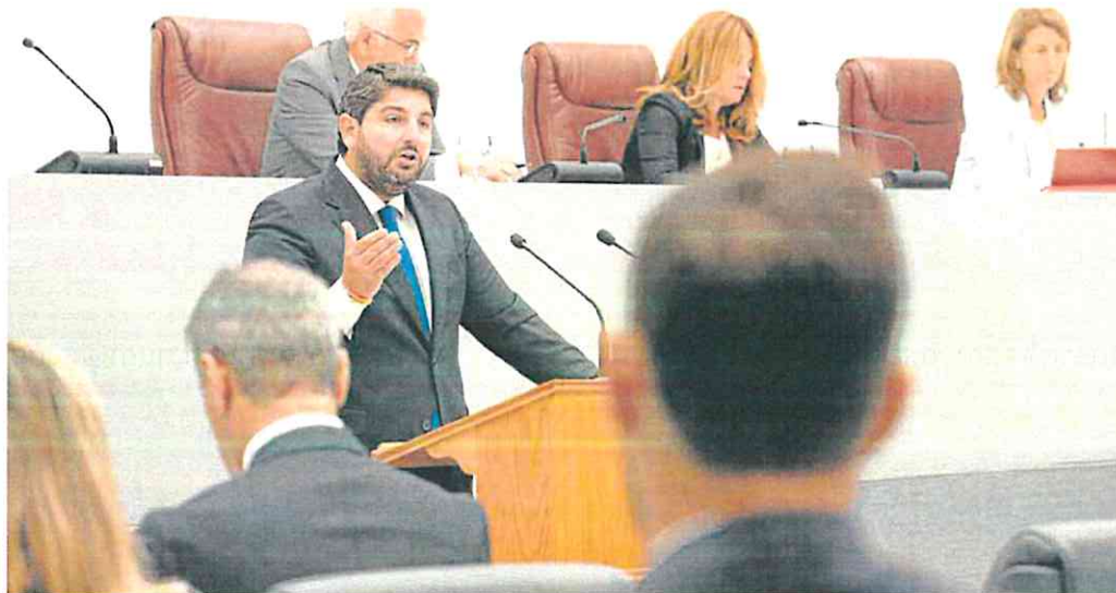
El candidato Fernando López Miras, en un momento de su discurso de poco más de 25 minutos de duración.

Además, el portavoz popular avanzó que ese Gobierno que salga hoy del Parlamento será reivindicativo para que no haya una España a dos velocidades. «No queremos más que nadie, pero tampoco ser menos que nadie», concluyó.