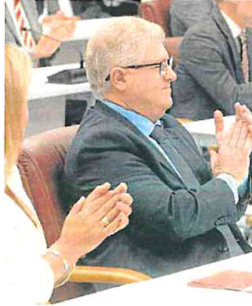
Vélez, durante el pleno en el Parlamento.

El socialista no cree que esto sea un pacto 'in extremis'. Está convencido de que López Miras «lleva más de tres meses engañando a la ciudadanía de la Región». Y en este punto le recordó