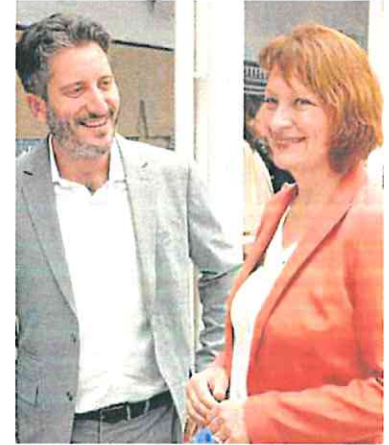
Egío y Marín, ayer, en la Asamblea.

que fue el primer presidente en meter a Vox en el gobierno la legislatura pasada y ahora «se ha hecho el estrecho».