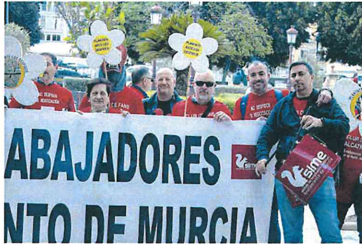
Una de las últimas manifestaciones de funcionarios municipales este año

► El recorte también afectará a otros complementos ante la subida del presupuesto de Personal del Ayuntamiento ► El Gobierno local advierte a los empleados públicos que pelagra la paga de diciembre y la extra