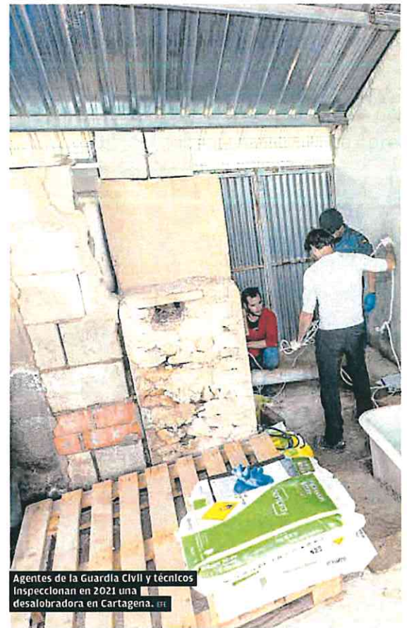
Agentes de la Guardia Civil y técnicos inspeccionan en 2021 una desalobradoras en Cartagena.

A G's España, Ciky Oro, y Vanda Agropecuaria se le ha achacado, por la cantidad de rechazos, una infracción tipificada como