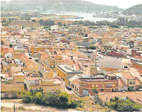
descenso de la cantidad de polvo en suspensión.

hasta donde llega la previsión, avisa que las concentraciones de estas partículas se situarán entre las 10 y las 20 micras/m 3 de máximo. «Es decir, que el ambiente no se limpia al 100% pero los aerosoles minerales se sitúan en los valores de este verano; son concentraciones lige-