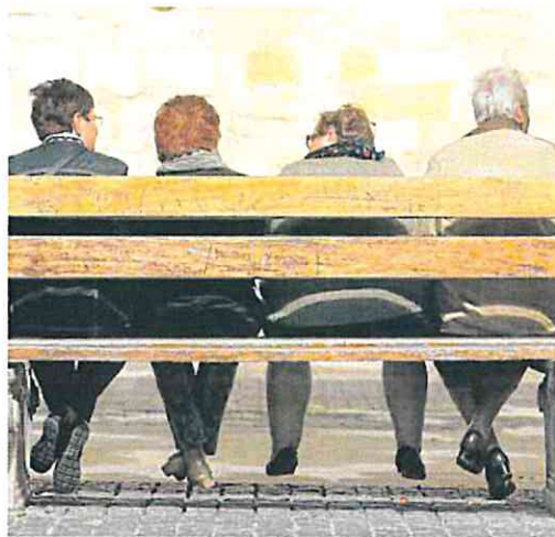
El envejecimiento en España será de los más rápidos de Europa.

El comisario de Mercado Interior, Thierry Breton, defendió que esta ley abre una ventana de oportunidad para los «pequeños competidores». Por el momento, tanto Samsung como X –antigua Twitter– han quedado fuera de la lista de las empresas señaladas por Bruselas.