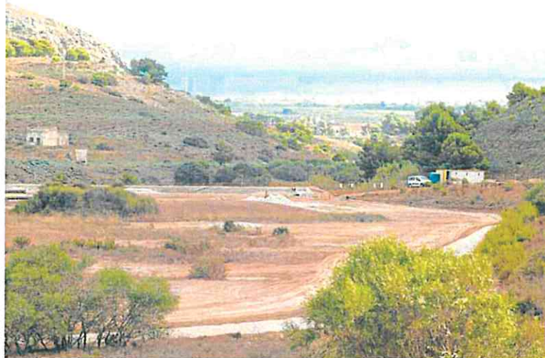
Trabajos de sellado de la balsa Jenny, en una imagen de archivo. Al fondo, el Mar Menor.

Sin embargo, el Comité de Representantes del Mar Menor no podrá personarse en este caso