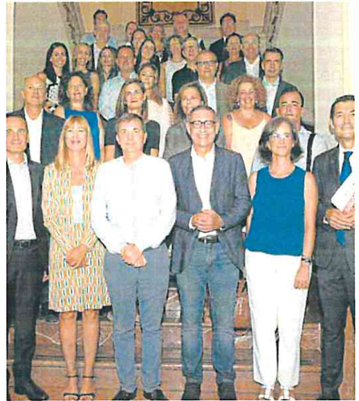
Los autores del estudio con el rector y las empresas colaboradoras.

El estudio vuelve a situar a El Pozo Alimentación como la empresa murciana que los consumidores identifican como la más responsable (25,1%), seguida de Estrella de Levante (14,7%) y Hero España (13,9%). Por detrás, le siguen Disfrimur, Hefame, Aguas