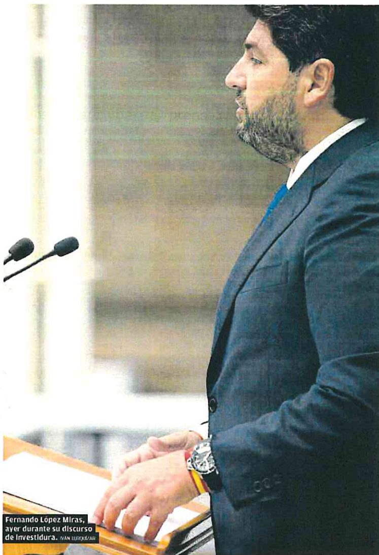
Fernando López Miras, ayer durante su discurso de investidura.