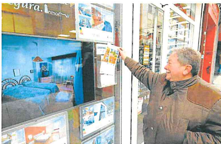
Escaparate de una agencia Inmobiliaria con varias ofertas de casas. A. GÓMEZ