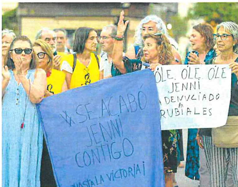
Manifestación feminista por los casos mortales de 2023 y en apoyo a Jenni Hermoso, en Valencia.

El año pasado terminó con 50 víctimas mortales de violencia de género. El 44% de las asesinadas había denunciado: 22 víctimas habían formulado 37 denuncias con 17 procesos judiciales con sobreseimiento provisional