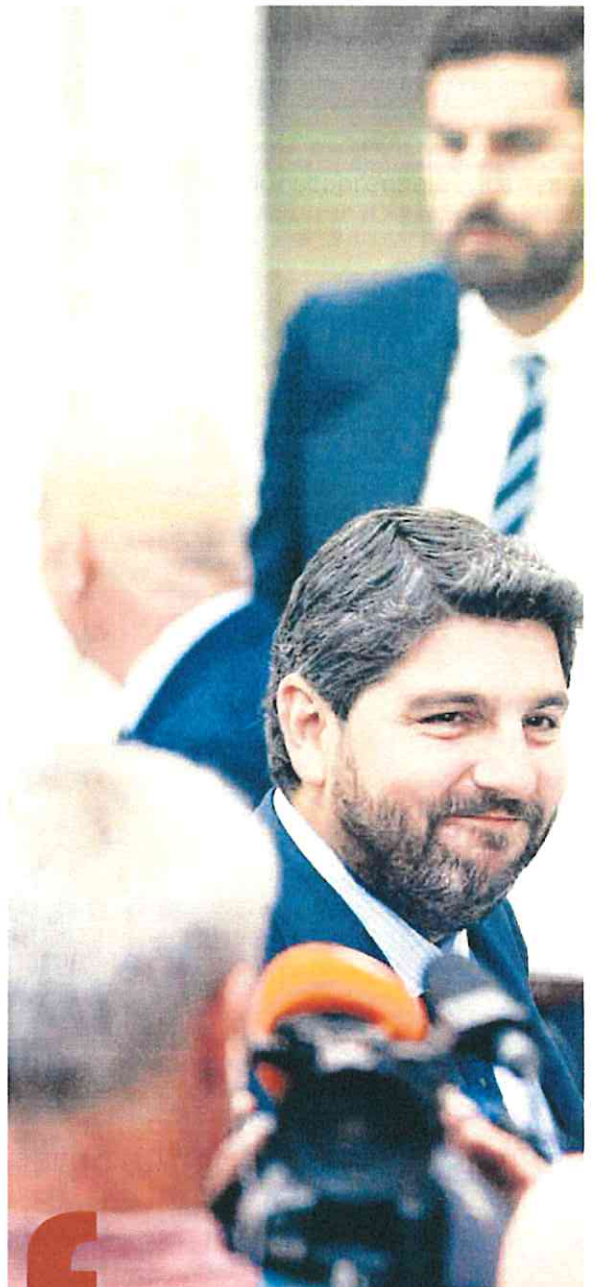
Las frases de López Miras

«Hablan de Sanidad pero evitan decir que Murcia es la que más invierte en sanidad pública. Hablan de infraestructuras pero no apoyaron el Pacto regional. No nos dice cuándo tendremos un AVE con Madrid con tiempos y frecuencias dig-