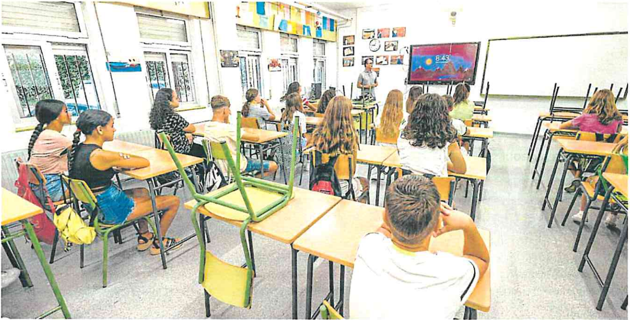
Alumnos de Secundaria del IES Alquibla de La Alberca, en Murcia, durante la Jornada de presentación del primer día del curso.