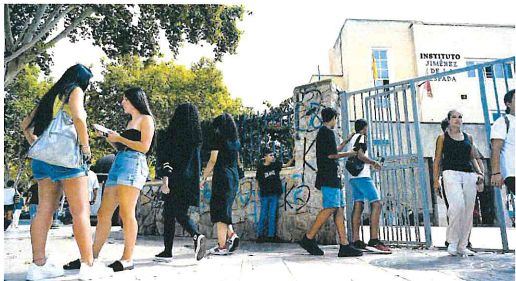
Primer día de curso en el Instituto Jiménez de la Espada de Cartagena.

Durante el curso 2023-2024 se ha incrementado el número de alumnos de Secundaria en 1.157 y alcanza los 77.891, así como el número de estudiantes de Bachillerato, que aumenta en 1.288 y llega a los 24.306 estudiantes. Más de 300.000 alumnos estudiarán en centros educativos de la Región durante el curso escolar