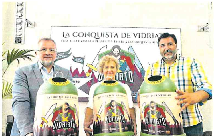
'La conquista de vidriato' se presentó ayer en el Palacio Consistorial.

Con estos dos nuevos ecoparques el equipamiento municipal de este tipo de instalaciones se doblaría al pasar de dos a cuatro. Actualmente, el Ayuntamiento cuenta con sendos puntos de reciclaje en La Asomada y en La Vaguada. Además, existen tres rutas de ecoparques móviles que cubren la totalidad del municipio durante toda la semana en horarios concretos. De esta forma, la ruta 1 abarca la zona oeste, la ruta 2 estaría centrada en la parte norte y el centro del municipio, mientras que la ruta 3 daría servicio a la zona este.