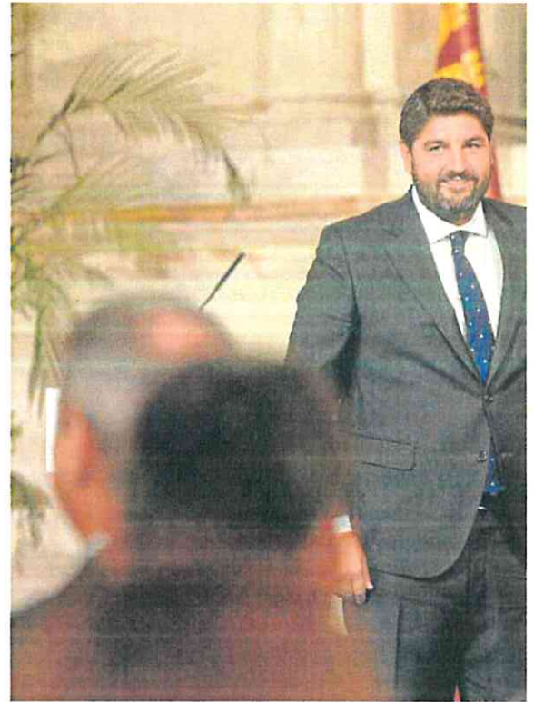
Fernando López Miras junto a la presidenta de la Asamblea Regional, Visitation

La Región de Murcia, subrayó, «debe seguir creciendo, debe seguir cumpliendo objetivos sociales y económicos y debe ocupar el lugar que le corresponde en España».