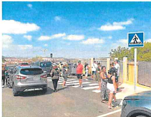
Entrada al colegio de Educación Especial Enrique Viviente de La Unión.

Más de 6.000 alumnos de Primaria, Secundaria y Bachillerato se encontraron, como ya ocurrió la semana pasada, sin autobús escolar, y con el problema de tener que buscar por sus propios medios formas de transporte alternativas para asistir a clase.