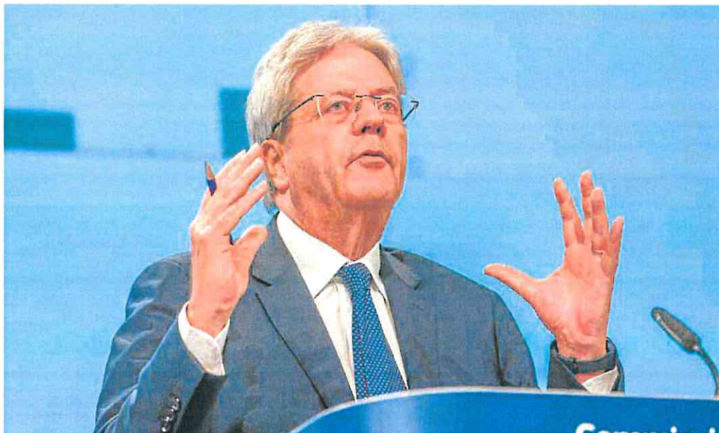
El comisario de Economía, Paolo Gentiloni, alabó ayer «la efectividad» de la política económica comunitaria.

Pero Bruselas avisa de que el endurecimiento de la política monetaria «podría lastimar la actividad de la eurozona más de lo esperado». Eso sí, destaca que una mayor presión de los tipos también podría acelerar la caída de la inflación y generar una recuperación más rápida. Su documento destaca que el primer semestre «ha ido mejor de lo previsto», aunque prevé una ralentización mayor en los próximos meses; afectará especialmente al sector industrial y los servicios también perderán impulso.