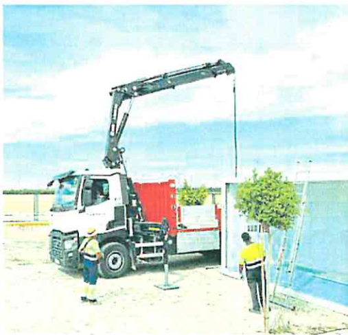
Montaje de uno de los barracones que faltan en el Menárguez Costa.

Pero la Ampa asegura que «hay muy poco espacio entre las mesas y algunos ya se han quejado del mal olor que se genera». La Consejería prohibió ayer que se hicieran fotos del montaje de las