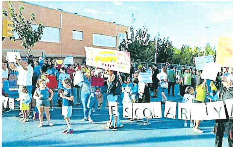
Protesta a las puertas del colegio de Fátima de Molina por la falta de transporte escolar, este jueves.