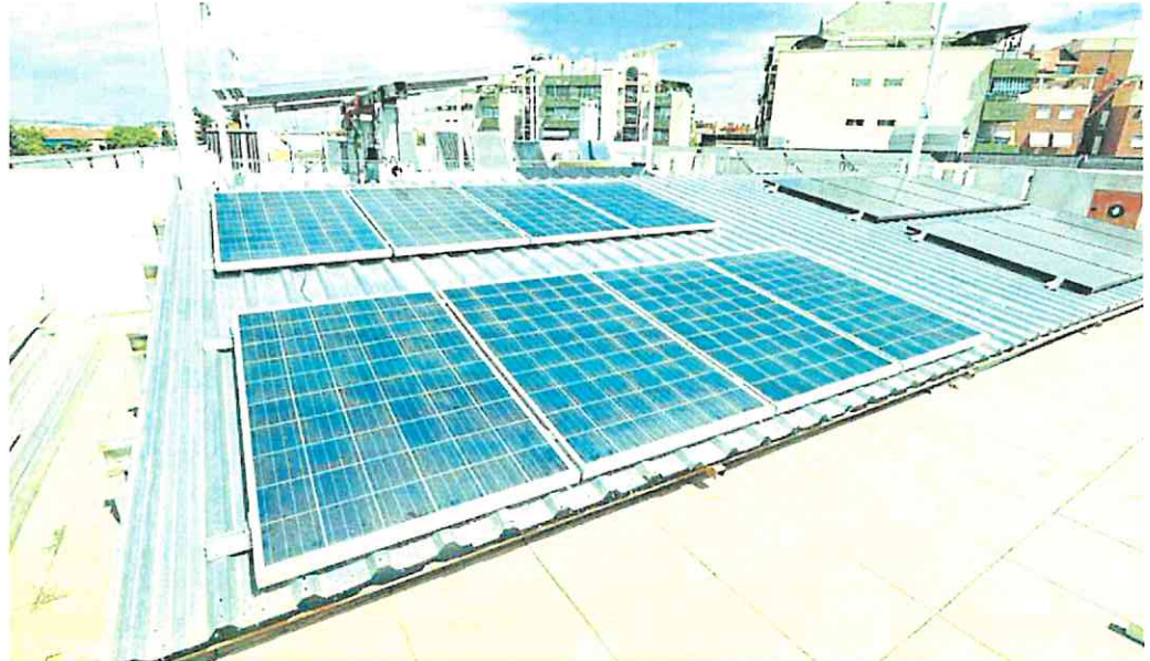
Placas solares instaladas en la terraza de la sede de Fremm, en Murcia.

Estos incentivos surgieron para impulsar las instalaciones de autoconsumo energético en el sector servicios y otros sectores productivos, sector residencial, administraciones públicas y tercer sector y aplicaciones térmicas en el sector residencial. Hasta el 31 de diciembre las pueden pedir las personas físicas o agrupaciones, así como personas jurídicas –empresas, instituciones, entidades locales, el sector público institucional, organizaciones del tercer sector, comunidades de propietarios y comunidades de ciudadanas de energía. El programa se divide en dos líneas: solo la instalación de autoconsumo hasta los 2.400 euros y otra con la fuente de energía renovable incluida hasta los 4.800 euros.