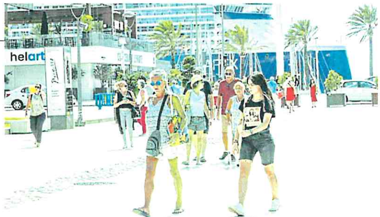
Turistas paseando por la Plaza Héroes de Cavite, ayer. Al fondo, el crucero 'Celebrity Apex', en el muelle Juan Sebastián Elcano.

El buque tiene diez bares y salones, ocho restaurantes distintos y una variedad de lugares públicos adicionales. El diseño del casco y la propulsión permite un ren-