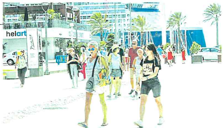
Turistas paseando por la Plaza Héroes de Cavite, ayer. Al fondo, el crucero 'Celebrity Apex', en el muelle Juan Sebastián Elcano.

El buque tiene diez bares y salones, ocho restaurantes distintos y una variedad de lugares públicos adicionales. El diseño del casco y la propulsión permite un ren-