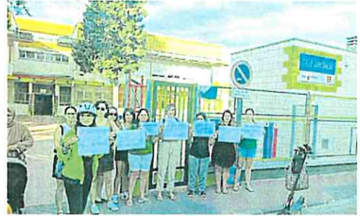
Docentes y padres del colegio Juan Carlos I de Llano de Brujas.