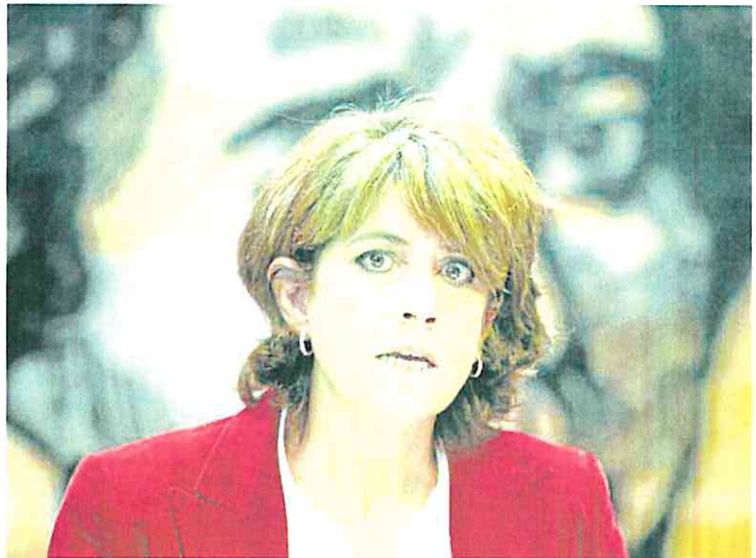
Dolores Delgado, fiscal de Memoria Democrática, durante una comparecencia en el Congreso.

El caso de las fotos trucadas en Tierra de Barros —no solo hay menores de Almendralejo, sino de otros pueblos de la comarca— no solo camina en estos momentos por la vía penal. La Agencia Española de Protección de Datos inició actuaciones previas de investigación sobre lo sucedido. Contactó con el Ayuntamiento de Almendralejo y la Junta de Extremadura para que difundieran entre las familias de las agraviadas que se puede solicitar la retirada urgente de las imágenes publicadas en internet a través del Canal Prioritario, que se puede encontrar en su página web.