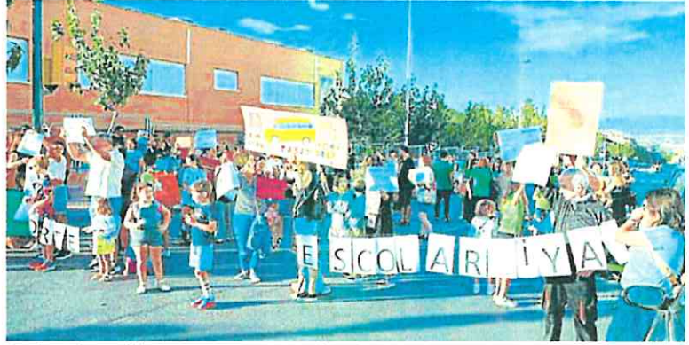
Familias y alumnos del colegio Nuestra Señora de Fátima de Molina de Segura. J.L.V.

El AMPA del colegio Juan Carlos I de la pedanía murciana de Llano de Brujas celebró otra concentración a las puertas del centro, a la que las madres acudieron con carteles con la leyenda 'los buses somos las madres', en alusión a la obligación creada por la Consejería de Educación a las familias para que sean ellas mismas las que lleven a los menores a clase. También protestaron las familias del IES Poeta Sánchez Bautista, en la misma pedanía; y las de La Aljada, en Puente Tocinos.