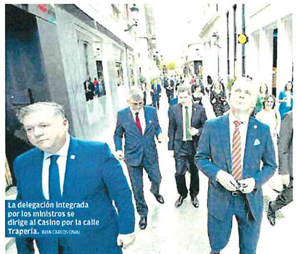
La delegación integrada por los ministros se dirige al Casino por la calle Trapería. JEAN CARLOS ORRAL