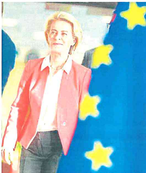
La presidenta de la Comisión Europea, Ursula von der Leyen.

Años después, en 2014, la Comisión Europea dictaminó que las medidas del Gobierno español eran «incompatibles con el mercado interior» y ordenó que se retiraran de la legislación. Eso