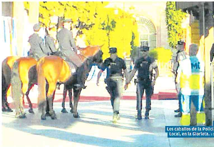
Los caballos de la Policía Local, en la Glorieta.

ministros de Economía y Hacienda de los Veintisiete que este viernes asistirán a la cumbre convocada bajo el lema 'Hacia una política de cohesión 2.0', en la que se debatirán las pautas a seguir en la confi-