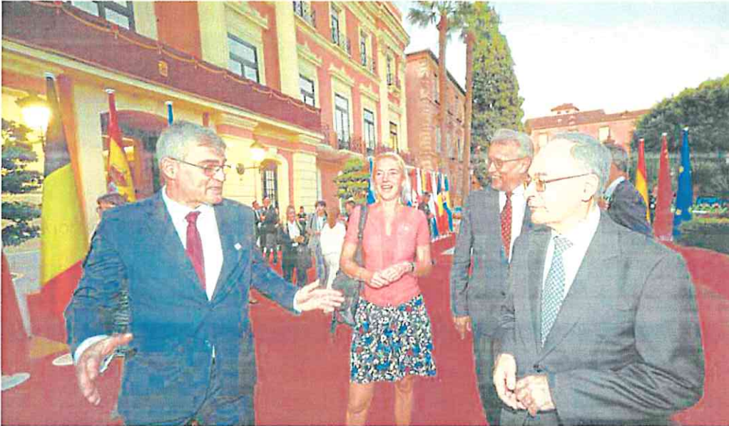
Varios participantes en la cumbre europea, ayer, a su llegada a la recepción en el Ayuntamiento de Murcia.