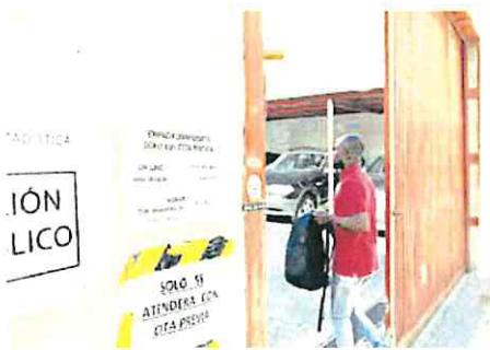
Oficina del Padrón de Lorca, ayer.

Del mismo modo, hasta la fecha, los procesos puestos en marcha por la Unidad han generado la apertura de 9 expedientes de baja de oficio, es decir, el reconocimiento por parte de los órganos competentes de la irregularidad llevada a cabo.