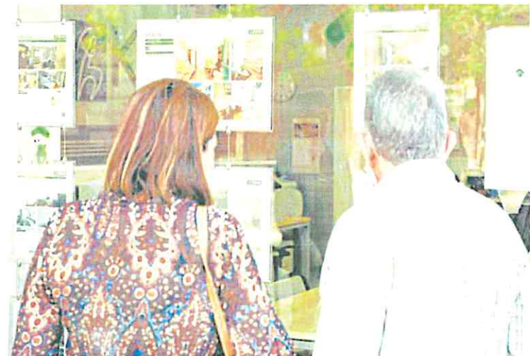
Dos personas junto al escaparate de una inmobiliaria.

Los datos revelan cómo la gestión del patrimonio impacta más en las familias con menor poder adquisitivo por el uso que realizan de sus activos. La rentabilidad de los depósitos bancarios, el producto más utilizado en este colectivo, apenas ha despuntado en el último año a pesar de las subidas de tipos de interés. En el caso de la vivienda, son estos mismos hogares los que más han sufrido las subidas de las cuotas hipotecarias a raíz de la escalada experimentada por el euríbor.