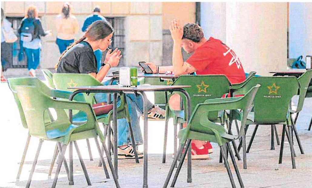
Dos jóvenes clientes fuman en una terraza de Murcia, ayer.

Por su parte, el Comité Nacional para la Prevención del Tabaquismo (CNPT) hizo un último llamamiento «al consenso». «Este plan incluye medidas clave como la regulación de los nuevos productos de tabaco, espacios libres de humo y una mayor fiscalidad y control publicitario», subrayó esta comisión.