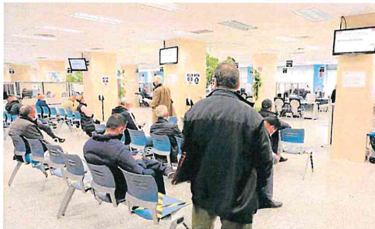
Varlos contribuyentes esperan su turno en una oficina de la Agencia Tributaria.

El pasado 25 de marzo la SEPI comunicó a la Comisión Nacional del Mercado de Valores (CNMV) la adquisición de un 3,044% de Telefónica, aunque el mandato es adquirir hasta un 10%. El Ejecutivo necesitaría, al menos, alcanzar un peso similar o superior al que ahora tienen otros accionistas como CaixaBank o BBVA.