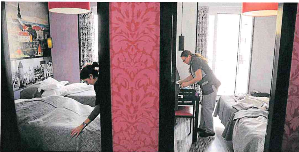
Las camareras de piso conforman uno de los colectivos que podrán beneficiarse en un futuro de esta jubilación anticipada por su trabajo.

Sigue pendiente es la reforma de la jubilación parcial. Sindicatos y la patronal confían en que el próximo lunes Seguridad Social lleve a la mesa una propuesta concreta. En todo caso, descartan un acuerdo si no se amplía compatibilizar trabajo con pensión.