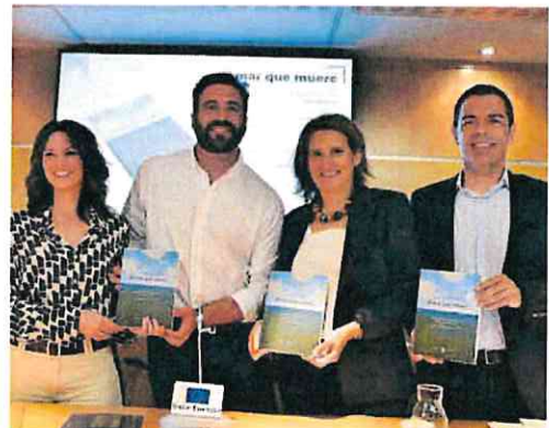
Imagen de la presentación del libro 'El mar que muere'.

Además, Ribera aseguró que una vez arraigado el concepto emocional, hay que ligarlo con el