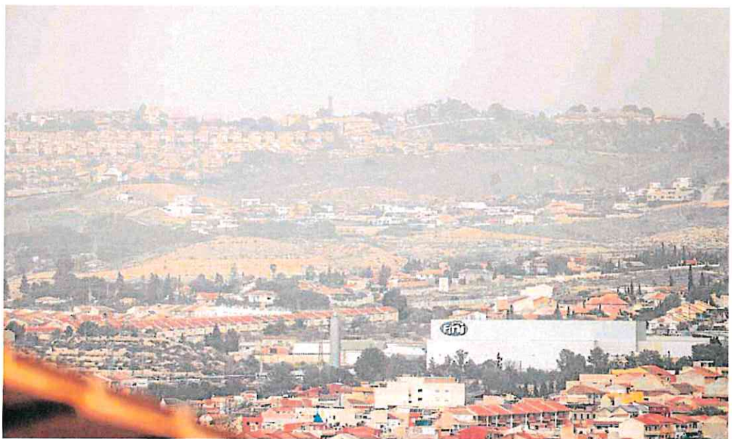
Panorámica de Molina de Segura y Altorreal, ayer a primera hora de la tarde, envueltas por los efectos de la calma.

La operadora estatal ha incrementado un 20% la venta de billetes en todas las frecuencias con una promoción de primavera