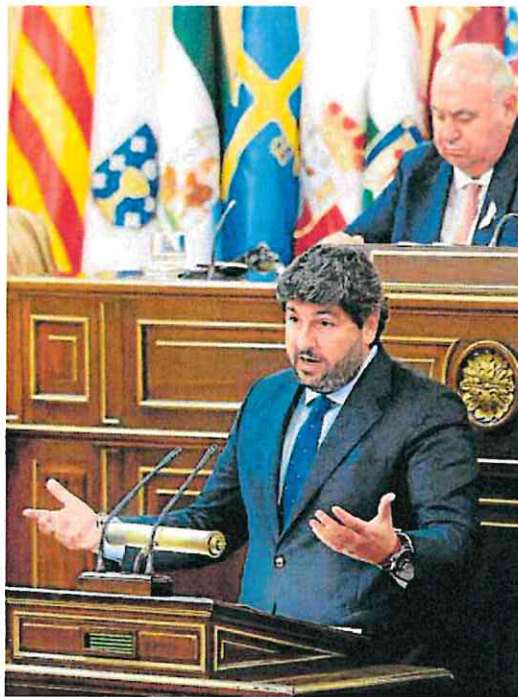
Fernando López Miras, durante su intervención en el Senado en octubre de 2023, cuando ya se debatió sobre la ley de amnistía.

En la Comunidad, añaden que el jefe del Ejecutivo autonómico pondrá de manifiesto que, «en ese marco de derechos desiguales que genera la ley y las conse-