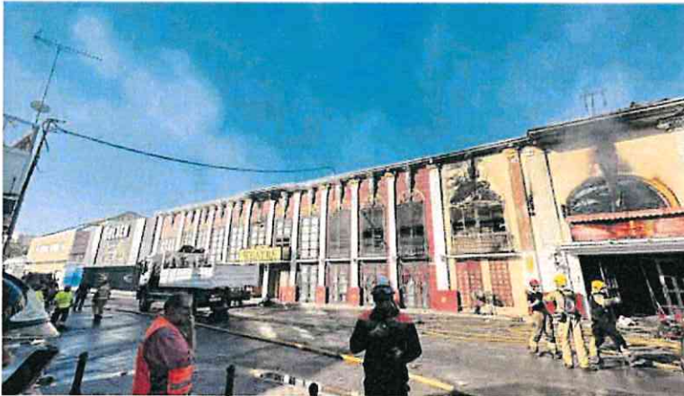
La discoteca Teatre, en Atalayas, tras el incendio.

► El juzgado de instrucción número 4 de Murcia sí acepta que sean investigados, pero lo deriva al 3 por ser el tribunal que investiga el suceso