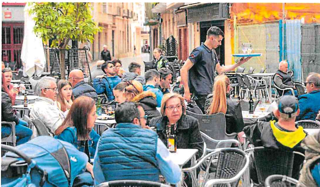
Un camarero con una bandeja atiende las mesas instaladas en la terraza de un bar del casco antiguo, esta Semana Santa.

El objetivo es diseñar itinerarios formativos que encajen con precisión en las demandas de las empresas. Además, para dar respuesta a las necesidades empresariales, la Agencia de Desarrollo Local y Empleo (Adle) ya ha diseñado para este año una veintena de cursos, de los que la mitad ya están en marcha con 150 alumnos orientados hacia la industria. También se han diseñado cursos propios de hostelería con prácticas, que ya están en su segunda edición.