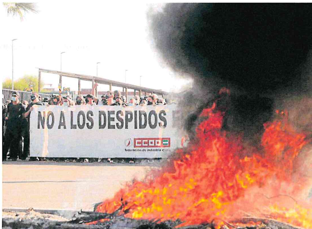
Trabajadores de la empresa aeronáutica Alestis se manifiestan en Cádiz contra los despidos que se habían decretado en la factoría.

Además de un tope, el sindicato liderado por Pepe Álvarez denuncia que la persona trabajadora tiene derecho a una indemnización predeterminada de forma puramente automática por la ley, únicamente fijada en atención al tiempo de antigüedad. Argumenta así que es excluyente y no tiene conexión con la reparación del daño causado, «de modo que no existe una posibilidad efectiva de que un órgano jurisdiccional valore y reconozca un daño mayor sufrido por la persona trabajadora como consecuencia del despido sin cau-