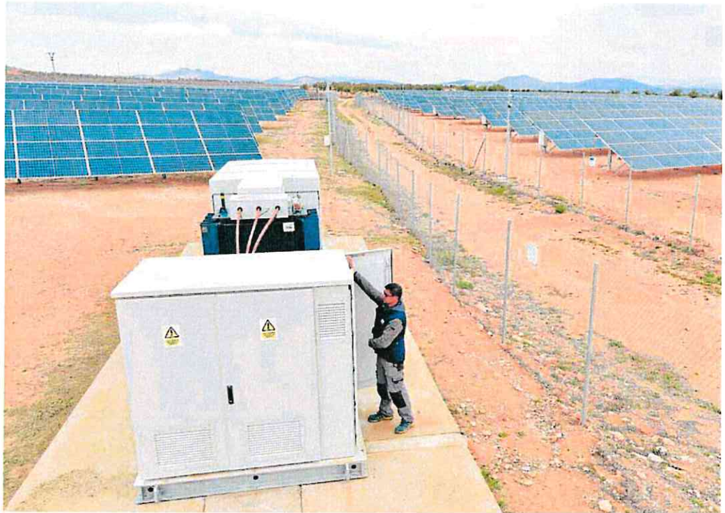
Un operario, en una planta de energía solar fotovoltaica situada en el municipio de Yecla, en una imagen de archivo.

El gran empuje de este sector en el país, que puso en servicio