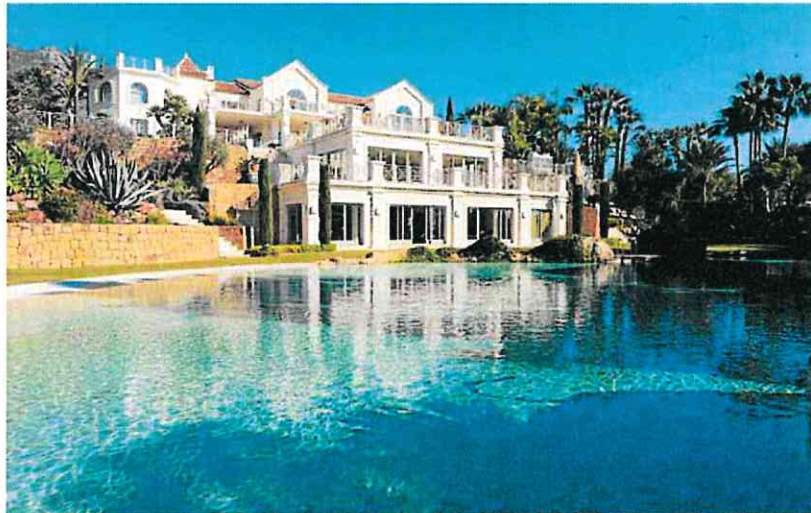
El mercado de la vivienda de lujo en Marbella, como la de la imagen, está en plena ebullición.

«Es a partir de 2022 cuando se encienden las alarmas», indicó la titular del ramo tras la reunión semanal del Gabinete. En su comparecencia apuntó directamente a inversores chinos y rusos como los más beneficiados de la medida en estos años –copan más de un 44% del total–, aunque también se ha detectado un fuerte interés de Reino Unido, Esta-