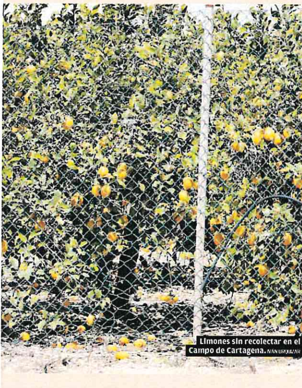
Limonos sin recolectar en el campo de Cartagena. MAN URBELAR