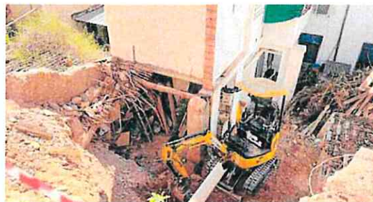
Una máquina excavadora trabaja en la zona afectada.

muro que cedió en esta zona como consecuencia de unas lluvias torrenciales, lo que generó un importante socavón. Los trabajos se han iniciado esta semana y tendrán un plazo de ejecución de dos meses, con un presupuesto final cercano a los 50.000 euros. El derrumbe de este muro se produjo a lo largo de unos 5,70 metros.