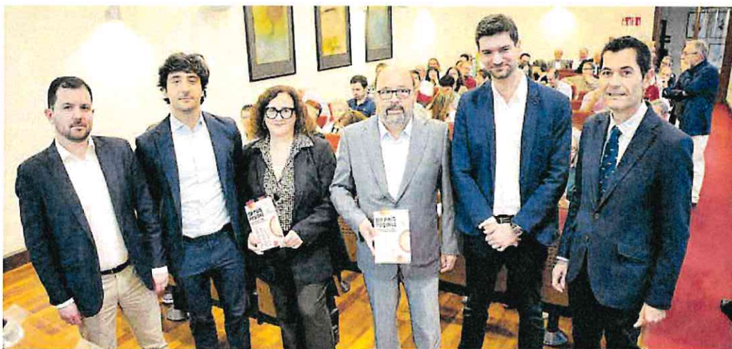
El presidente del Círculo de Economía (tercero por la derecha), con los participantes en la presentación del libro 'Un país posible'

Galindo añade que la brecha se acrecienta también entre ambos sexos, dado que la proporción de alumnas que accede a la Formación Profesional en especialidades científicas y tecnológicas está muy lejos de la tasa masculina.