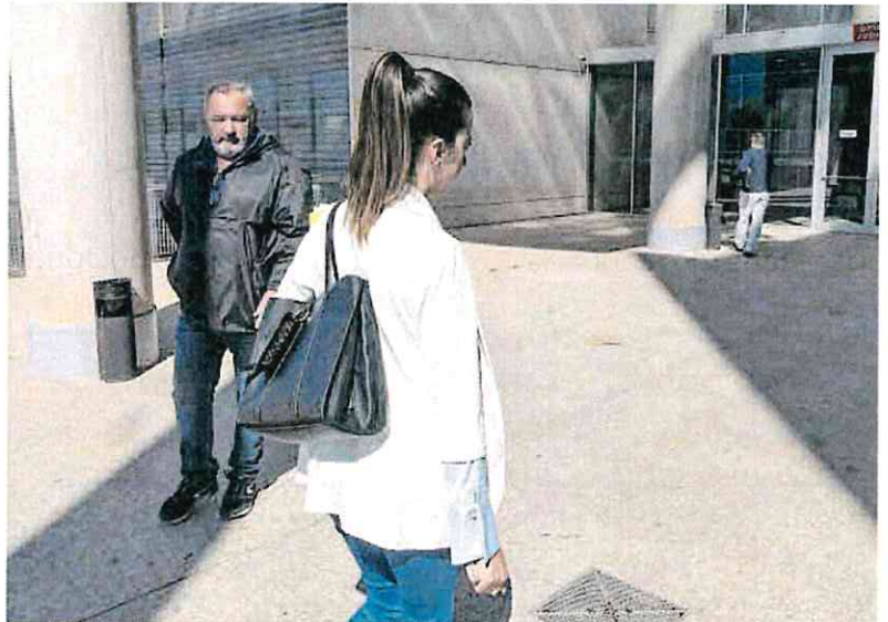
La inspectora que actuó como secretaria en el informe de la Policía Judicial sobre los hechos.

Una valoración similar ha hecho la inspectora secretaria, que ha sido la primera en prestar declaración ante la jueza, ha dicho el abogado