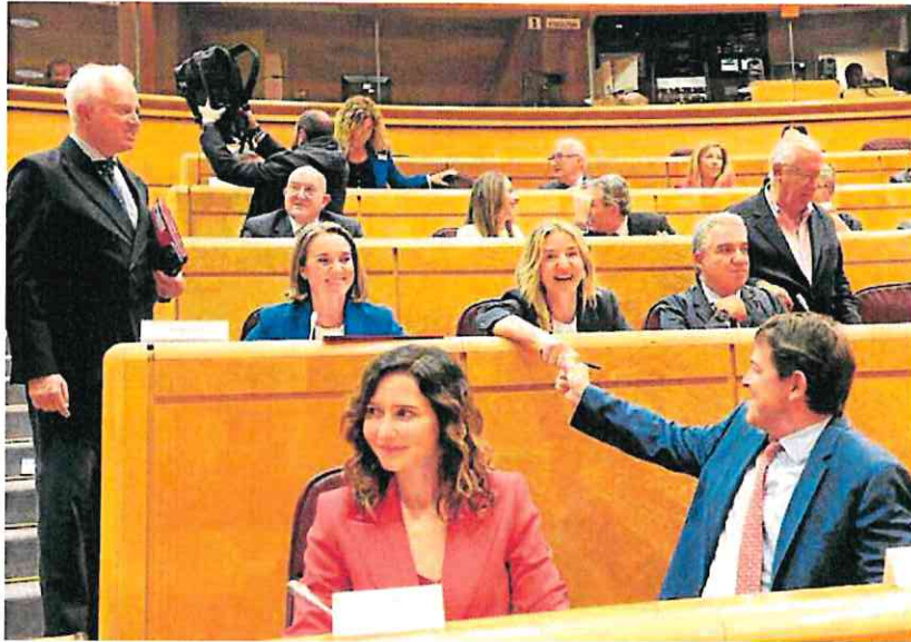
Ayuso y Mañueco asisten el lunes en el Senado al debate sobre la ley de amnistía.