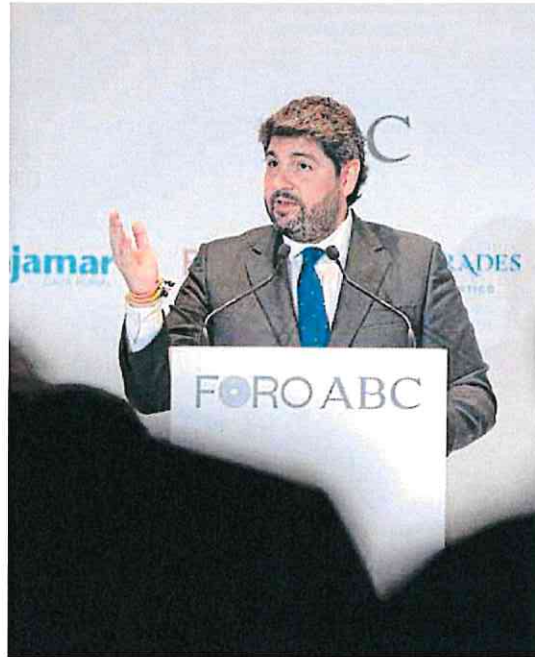
López Miras, ayer, en el Foro ABC.

López Miras denunció que el actual modelo de financiación es «injusto, insuficiente y caduco», y «lleva perjudicándonos quince años». Por ello, consideró que un nuevo modelo es «vital» y advirtió de que «seguiremos denunciando públicamente esta injusticia y el agravio comparativo. No voy a dejar que se juegue con el dinero que garantiza a los murcianos los servicios públicos». Para el presidente regional, el desigual reparto de fondos a las autonomías se hace más grave «cuando se celebran mesas bilaterales con el independentismo que tienen en su orden del día plantear privilegios