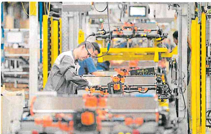
El sector de la automoción es el más afectado por esta reforma de la jubilación parcial.