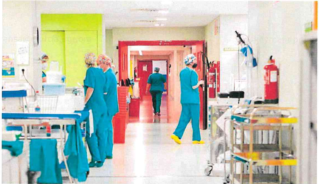
Sanitarios en una de las plantas del hospital Rafael Méndez.

El informe concluye que «el colapso afecta a un total de 34.658 personas» en el SMS: 27.066 pacientes en lista de espera de consultas externas y 7.592 en la lista de pruebas complementarias. Todos ellos son personas sin cita