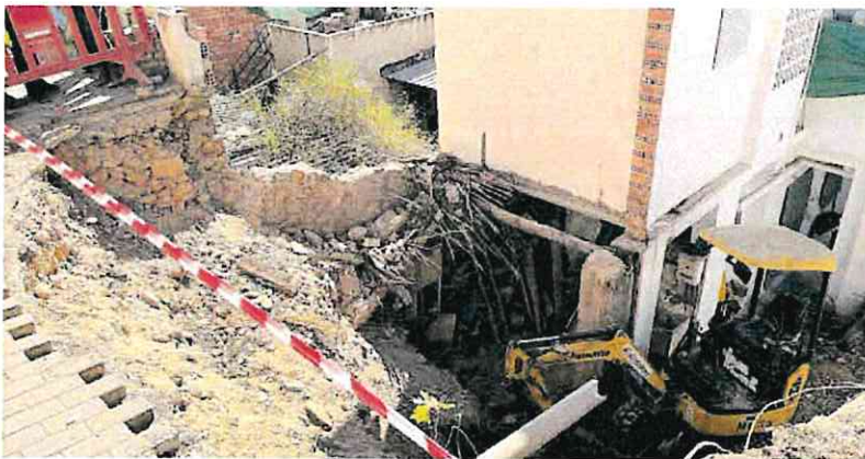
Las máquinas excavadoras ya trabajan en el socavón, que afectó a una vivienda.

cuando, se «derrocha» el dinero en fiestas, oficinas de eventos, caballos en la Policía Local o 'fichajes estrella' de funcionarios de otras administraciones.