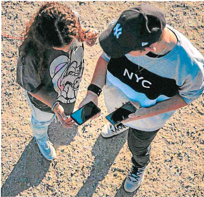
Dos jóvenes consultan sus móviles, uno de los instrumentos actuales para la agresión sexual.

El grueso de ataques sigue procediendo de un adulto familiar o conocido, pero más de uno de cada diez (11%) son agresiones grupales. Los asaltos en manada se multiplicaron por cinco desde 2008. El 13% de las víctimas había tomado estupefacientes y