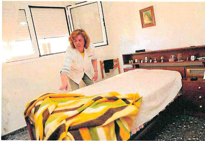
Una auxiliar de ayuda a domicilio realiza tareas domésticas en la vivienda de una anciana, ayer.

Castillo anunció que Lorca será pionera en la Región en el establecimiento del concierto social