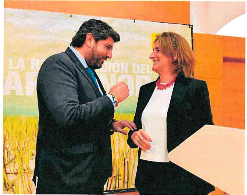
El presidente, López Miras, y la ministra Teresa Ribera, ayer, en San Esteban.

Otro asunto que estará resuelto este año es la constitución de las juntas de usuarios de los acuíferos de la comarca, cuyos programas de actuación estarán aprobados en diciembre.