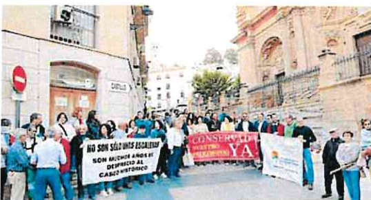
Decenas de personas protestan por la demolición de la escalera.