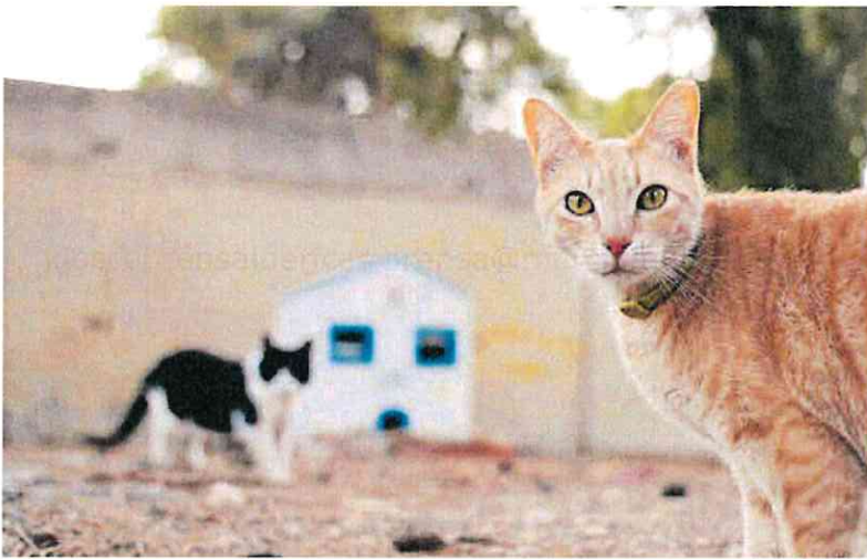
Una de las colonias felinas distribuidas por el municipio, en la barriada Villalba.