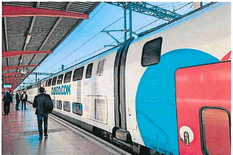
El primer tren de Ouigo que viajó ayer de Chamartín (Madrid) a Valladolid.

En enero de 2022 acudió como investigado a declarar a la Audiencia Nacional. Galán negó conocer al policía —«ni ordené, ni autoricé, ni conocí nada de este señor», dijo— y se presentó incluso como víctima de un complot. Meses después, García-Castellón decidió retirar la imputación que pesaba sobre el presidente de Iberdrola.