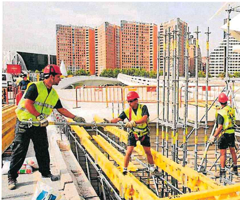
Obreros trabajando en una edificación, en Valencia.

De momento, el supervisor se muestra tranquilo y satisfecho con el control absoluto del riesgo inmobiliario. Y desde el sector mantienen que seguirán siendo extre-