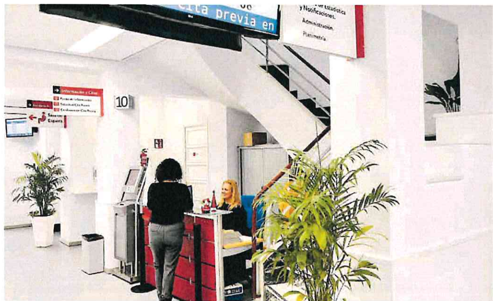
Una mujer solicita inscribirse en el padrón en el Ayuntamiento de Murcia, paso necesario para conseguir la nacionalidad.

Le sigue Bolivia, con 6.532 personas censadas en 2023. Una cifra muy superior a las 396 que se registraron en 2011 y que, al igual que Ecuador, va en aumento, pues en 2021 fueron 4.962 y 5.704 en 2022.