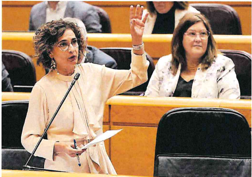
María Jesús Montero, vicepresidenta primera, durante una sesión de control al Gobierno en el Senado, el pasado diciembre.

De cara a 2024, según subrayan fuentes de este departamento, el objetivo es seguir por la senda de aumentar estas partidas para «garantizar la igualdad de oportunidades» entre los estudiantes. Asimismo, se prevé una subida del 5 % en los umbrales de las rentas para la próxima convocatoria y la reducción al 25 % del porcentaje de discapacidad que es necesario acreditar en caso de estudiantes con necesidades de apoyo, según recoge el borrador del decreto de umbrales elaborado por el Ministerio de Hacienda.