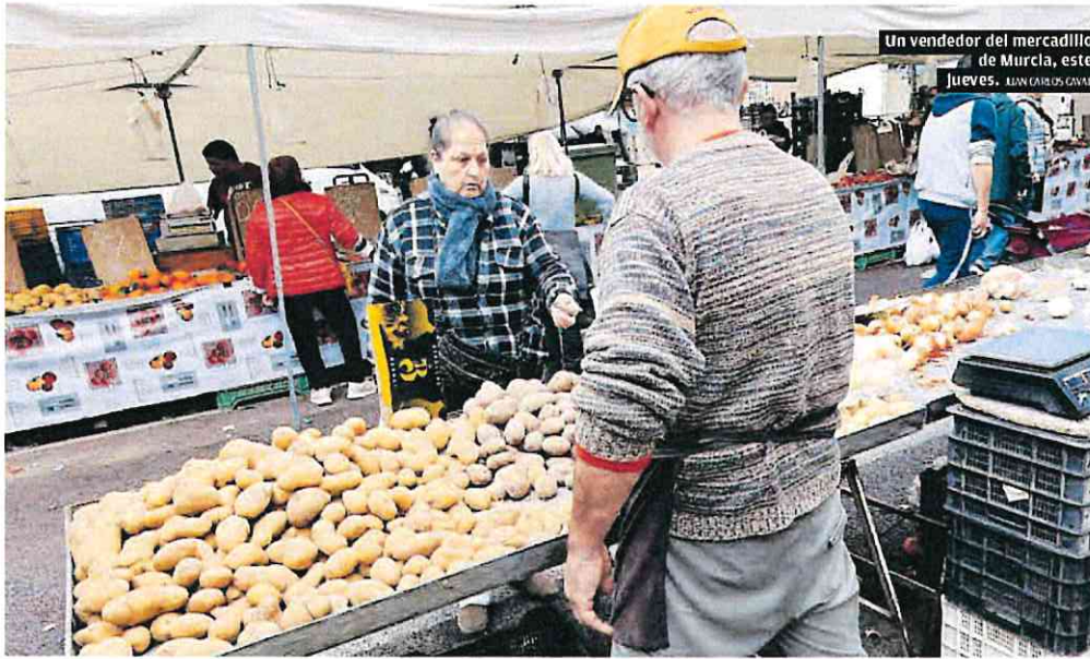
Un vendedor del mercadillo de Murcia, este jueves. ALAN CARLOS GAVIL