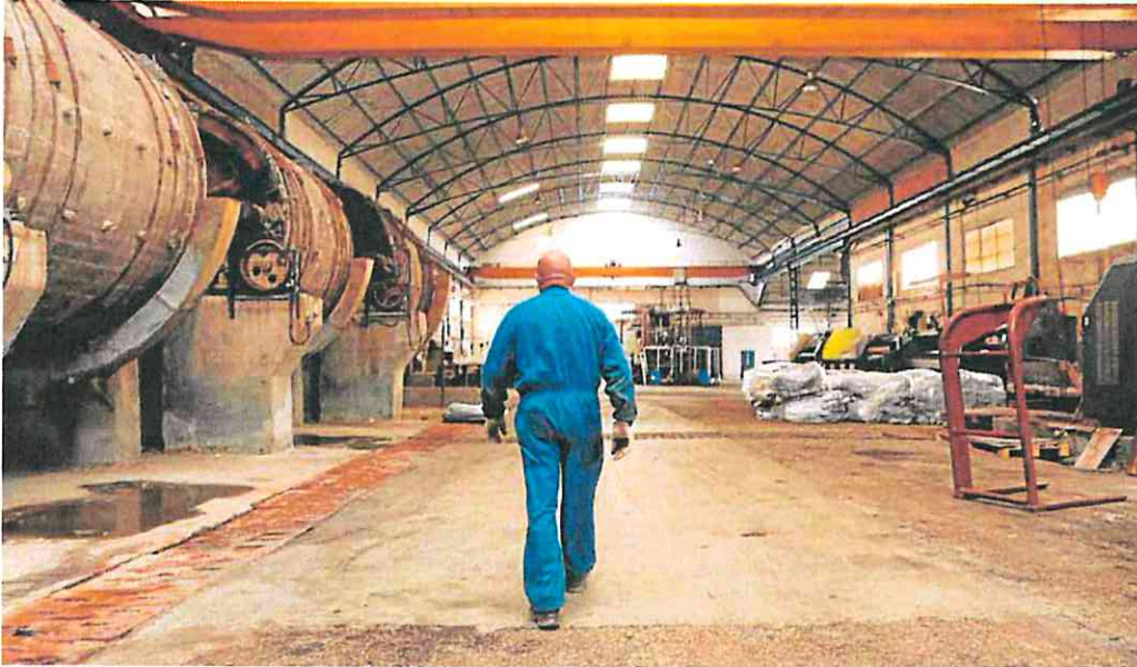
Un trabajador en una de las empresas de curtido del polígono de Serrata, en una imagen de archivo.