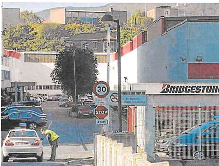
Entrada al centro de trabajo que la multinacional Bridgestone tiene en la localidad vizcaína de Basauri. e. c.

Sin embargo, no conforme, Bridgestone volvió a recurrir en casación al Tribunal Supremo, que en su reciente sentencia ha zanjado definitivamente el asunto. El Alto Tribunal, tras estudiar los casos de derecho comparado alegados por la empresa y concluir que no guardaban una similitud sustancial con este en cuestión, inadmitió dicho recurso contra la decisión del TSJPV, incidiendo en sus mismos argumentos de vulneración del derecho a la intimidad y declarando la firmeza de la sentencia que había emitido del Superior vasco.