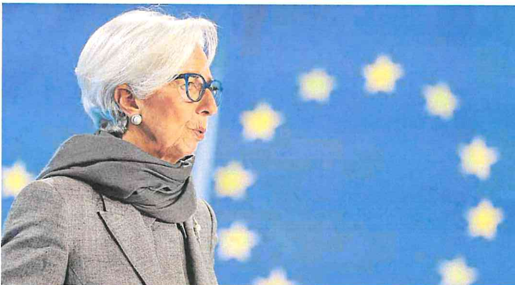
La presidenta del Banco Central Europeo, Christine Lagarde, tras la última reunión del organismo en diciembre pasado.

fue la inflación armonizada en Francia, mientras que en Alemania marcó un 3,8% y en España el 3,3%. En Italia y Bélgica fue de solo un 0,5% pero en Austria llegó al 5,7%.