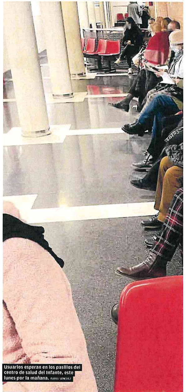
Usuarios esperan en los pasillos del centro de salud del Infante, este lunes por la mañana. FERRI SANCHEZ

En el Consejo Interterritorial también se planteó la obligatoriedad del uso de mascarillas en los centros sanitarios, algo que en la Región de Murcia ya se puso en marcha el pasado sábado debido al incremento de la incidencia de infecciones respiratorias.