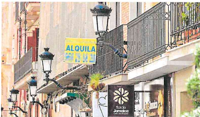
Una vivienda en alquiler en la calle Trapería de Murcia.

La rentabilidad bruta de la compra de un garaje para ponerlo en el mercado del alquiler en Murcia capital se ha situado en el 10,8% en 2023, superior a la media nacional del 7,2% y la tasa más elevada por capitales de provincia, según un estudio realizado por idealista. En el caso de los