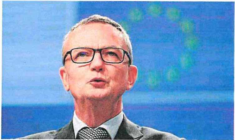
El portavoz del Ejecutivo comunitario, Eric Mamer.

Desde Sumar censuran, sin nombrarlos directamente, la postura de Podemos y de otros partidos como el PP o Junts, que se encuentran en el 'no' a los decretos. Ayer, su portavoz y ministro de Cultura, Ernest Urtaun, hizo una «llamada a la responsabilidad» y a «no hacer politiquería» con medidas que, afirma, «mejoran la vida de la gente». La formación que lidera Yolanda Díaz denuncia lo que considera taticismos en la postura de estas formaciones y niega las acusaciones de que el decreto de las medidas para el desempleo suponga un recorte.