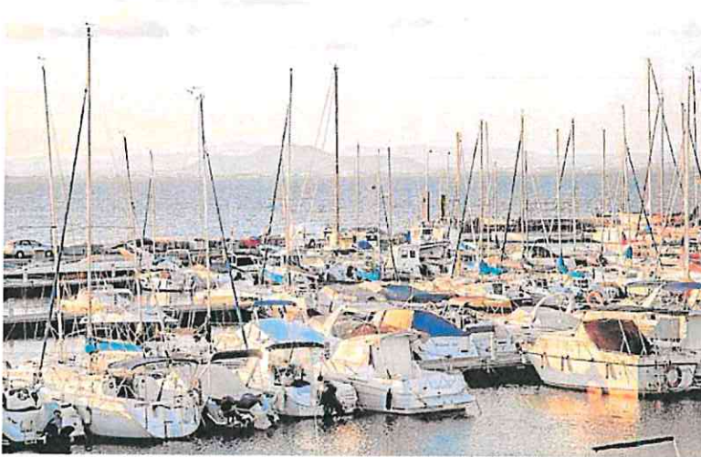
Embarcaciones en el puerto deportivo de Los Nietos, en una imagen de archivo.