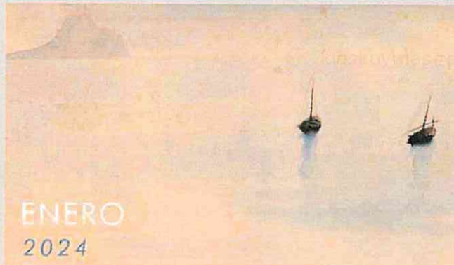
'Dos barcas', 1935. Ramón Gaya. Exposición Ramón Gaya 'Mediterráneo'