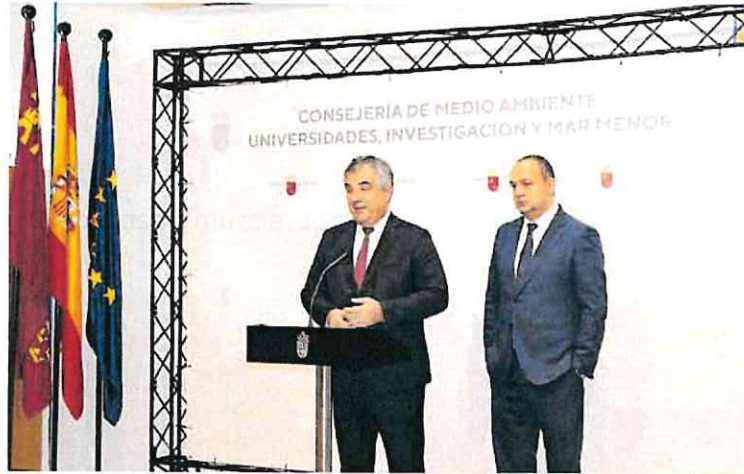
El consejero de Universidades junto con el director general de Universidades, ayer

La Ley 39/2015 del Procedimiento Administrativo Común de las Administraciones Públicas esta-