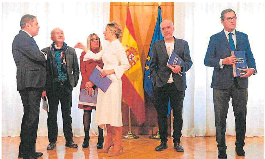
La vicepresidenta segunda, Yolanda Díaz, junto a los representantes de sindicatos y patronal, tras firmar el Acuerdo del Diálogo Social en 2023.

CC OO y UGT, por su parte, se mantuvieron en una subida del 5%, aunque todavía apuestan por un acuerdo tripartito. No obstante, el segundo pidió «coherencia» al Gobierno para elevar el SMI en los «mismos parámetros» que las pensiones mínimas, que se han revalorizado entre un 5% y un 7%, o bien las no contributivas o el ingreso mínimo vital, que han crecido un 6,9%.