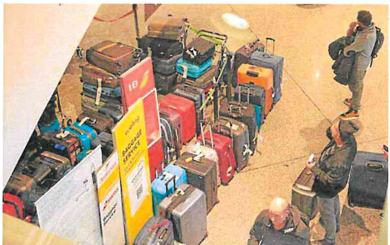
Todo tipo de maletas sin cargar en los aviones se acumulan en el aeropuerto de Bilbao.

Desde la aerolínea señalaron que han estado trabajando «intensamente» durante estos cuatro días para que esos equipajes lleguen a sus destinos y propietarios, al tiempo que añadió que durante la huelga se han trasladado más de 140.000 maletas. En casos como el de Bilbao, uno de los más problemáticos, Iberia ha tenido que habilitar durante el fin de semana el transporte por carretera de parte de los equipajes que no pudieron ser embarcados en las bodegas de esos aviones.