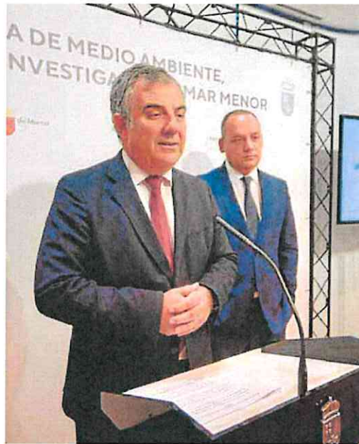
El consejero y el director general de Universidades, ayer.

La nueva norma regional debe abordar cuestiones como la regulación del personal laboral, la coordinación y complementariedad de las tres universidades de la Región,