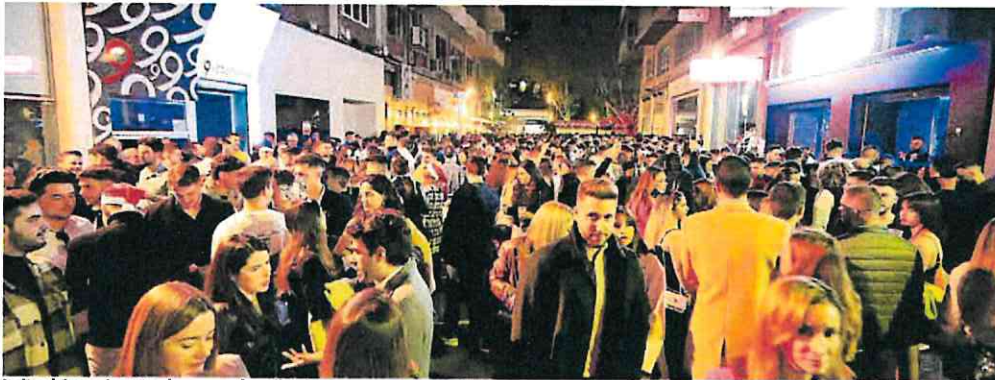
La 'tardebuena' en Murcia congregó a miles de personas en torno a los bares y restaurantes del municipio.