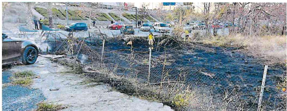
Los bomberos sofocaron rápidamente el nuevo incendio del Malecón, junto al parking disuasorio.

Un nuevo incendio se declaró ayer en el jardín del Malecón, junto al parking disuasorio. Según informaron fuentes del 112, a partir de las 16.52 horas, el Servicio de Emergencias recibió un total de 30 llamadas que informaban de que estaba ardiendo vegetación en el lugar y que el fuego habría afectado a varios vehículos, especialmente a una furgoneta blanca, que ha quedado parcialmente calcinada. Hasta el lugar del siniestro, que no dejó ningún herido, se movilizaron varios vehículos de los Bomberos de Murcia y agentes de Policía Local. Se da la circunstancia de que se trata del cuarto incendio en la misma zona en poco más de una semana. El pasado 29 de diciembre el fuego calcinó por completo un buen número de palmeras, además de cañas y maleza que se encontraba acumulada cerca del río