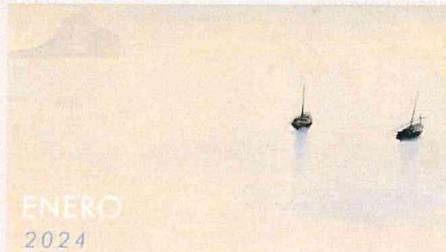
'Dos barcas', 1935. Ramón Gaya. Exposición Ramón Gaya 'Mediterráneo'