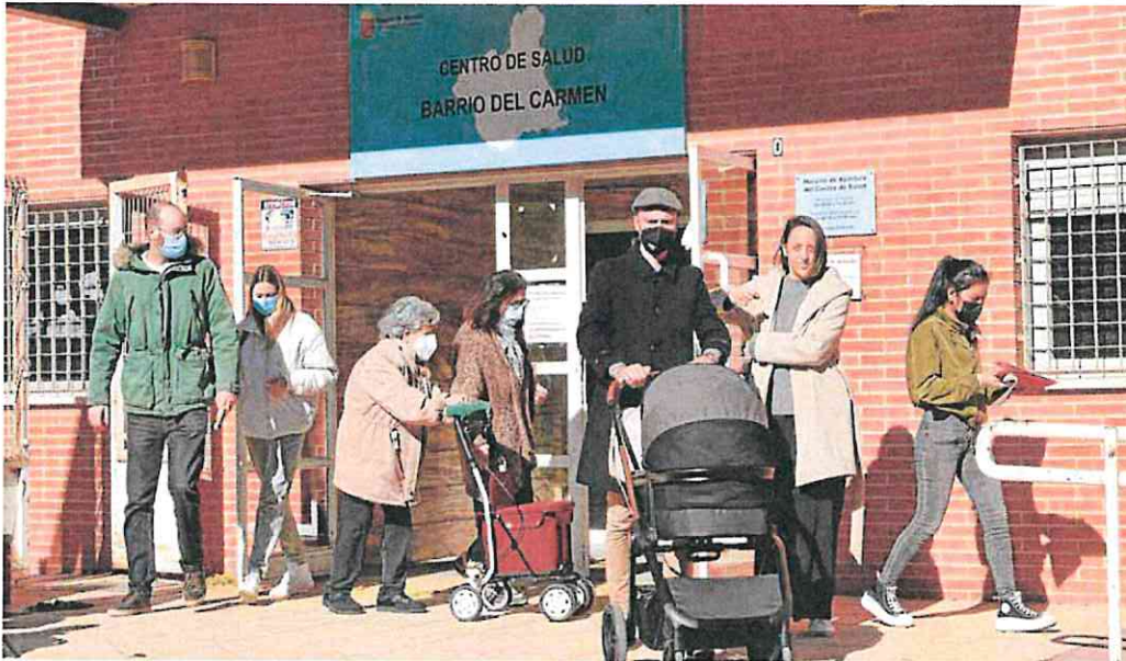
Pacientes y acompañantes, ayer, en los accesos al centro de salud de El Carmen, protegidos con la mascarilla obligatoria.