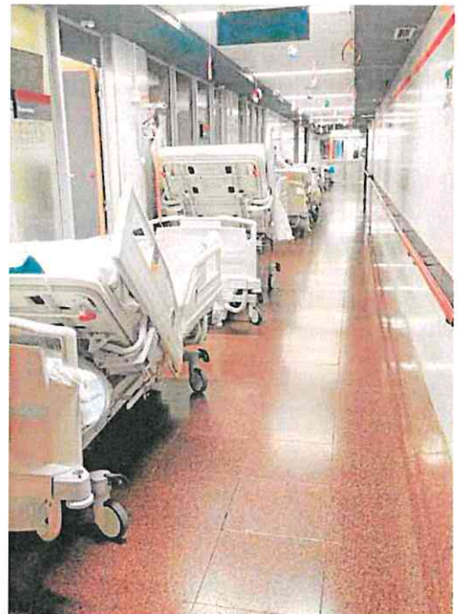
Camas en un pasillo de Urgencias de La Arrixaca, ayer.

El Sindicato Médico (Cesm) denunció en un comunicado «el