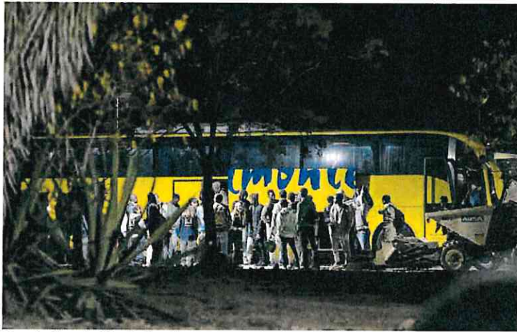
Migrantes llegando al Hospital Naval de Cartagena, donde se ha establecido un campamento.