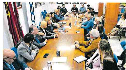
Junta directiva de COEC, la primera del año 2024.

COEC afronta este año 2024 con numerosos desafíos como, por ejemplo, la búsqueda de una nueva sede, asunto sobre el que fue informado la junta directiva.