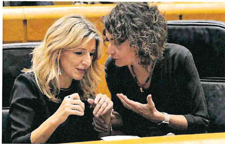
Yolanda Díaz y María Jesús Montero, vicepresidenta segunda y vicepresidenta primera.

El PSOE extrae sus propias lecciones, como la necesidad de atar los acuerdos con sus socios antes de llevarlas al Consejo de Ministros, y piden a la vicepresidenta hacer lo propio con los morados. Desde la ruptura entre Podemos y Sumar, los socialistas asumieron que los morados serían un actor más con el que negociar. También que no pondrían en riesgo la gobernabilidad, como le trasladó la líder del partido, Ione Belarra, al ministro de Presidencia y Justicia, Félix Bolaños. Pero sí que podrían tumbar «leyes menores» y que serían «más exigentes» con las pro-