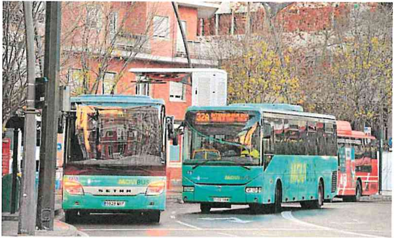
Dos autobuses interurbanos de la línea de Molina de Segura, en la plaza Circular de Murcia.

Además, Fomento descarta la gratuidad del billete ante alertas por contaminación del aire como las de la pasada Navidad, como pidió el PSOE. Pancorbo alega que «tal circunstancia no se encuentra recogida en los actuales contratos puente que operan los entornos metropolitanos de Murcia, Molina de Segura y Cartagena».