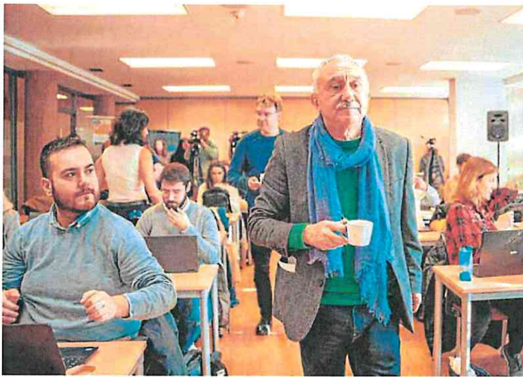
El secretario general de UGT, Pepe Álvarez, ayer durante un encuentro informativo.

Por otra parte, UGT acusó al Ministerio de Justicia de haber pedido a Bruselas que retrase la sentencia que saldrá en cualquier momento sobre el coste del despido.