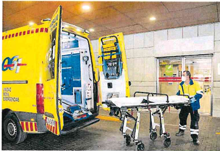
Un trabajador del 061 introduce una camilla en una ambulancia a las puertas del Reina Sofía.

► Paralizan los llamamientos para incorporarse el próximo lunes porque las gerencias se centran en reforzar la plantilla ante la epidemia de gripe