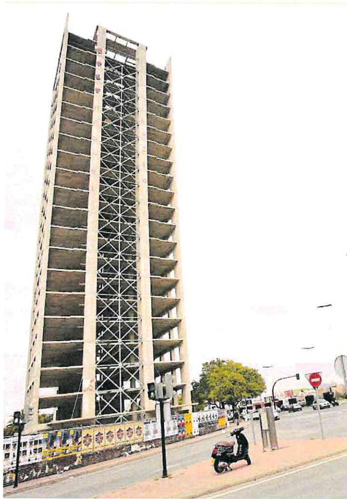
Torre Inacabada en la avenida Miguel Induráin de Murcia.

Fuentes de Fomento señalan que al tratarse de una Conferencia Sectorial «no se ahondó en los detalles de la propuesta del consejero», aunque sugieren que «la propuesta es aplicarla inicialmente en edificaciones residenciales para no tener que modificar el uso del suelo».