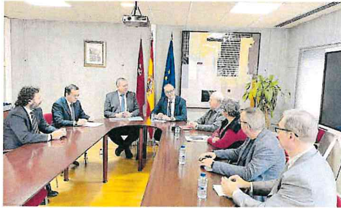
El consejero de Educación y Empleo preside la reunión con la Croem y los sindicatos.

► El consejero de Educación y Empleo reúne a los sindicatos y a la patronal para ultimar el documento que están a punto de firmar