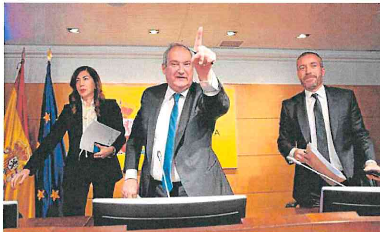
El ministro de Industria y Turismo, Jordi Hereu (C), ofreció ayer una previsión de la evolución del sector turístico en los primeros meses de 2024 y la participación del Ministerio en la feria Fitur, que dará comienzo el 24 de enero.

La economía de la eurozona está mostrando signos de desgaste por los elevados tipos de interés. Así, el PIB retrocedió un 0,1% entre julio y septiembre del año pasado, aunque el empleo registró un ligero avance del 0,2%.