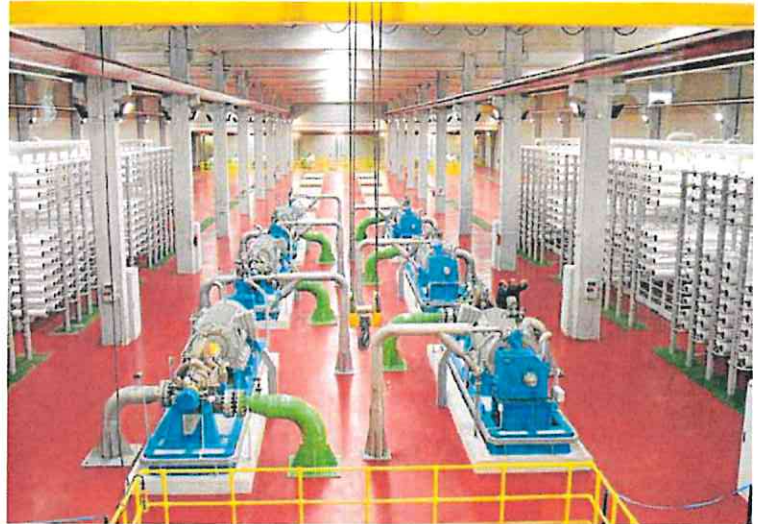
Interior de la desaladora de Valdelelencisco. A ambos lados se encuentran los bastidores con los tubos donde se realiza la ósmosis inversa. Cada bastidor tiene 150 tubos; uno de ellos reventó el miércoles.

ques que podrían verse afectados por plagas como bacterias o insectos que anualmente provocan daños en la naturaleza. Estas amenazadas son combatidas con tratamientos en zonas vulnerables a los distintos insectos para vigorizar la masa arbórea, eliminando los pies debilitados de forma que el resto de los árboles dispongan de más recursos hídricos y nutrientes, mejorando su vitalidad y dificultando el ataque de los perforadores.