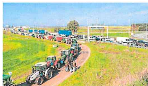
Bloqueo en una autopista de Portugal junto a la frontera con España.

que Asaja, Coag y UPA le pidieron el miércoles. Planas ya había anticipado su intención de mantener la devolución del impuesto especial del gasóleo agrícola esta legislatura. Ayer mismo, el presidente Pedro Sánchez recordó que el Ejecutivo ha habilitado 4.000 millones de euros, en medidas fiscales, laborales, sociales o de seguros. Respondió a las críticas de la ex primera ministra francesa Ségolène Royal a la calidad del tomate español. Sánchez la invitó para comprobar que se trata de un producto «imbatible» sin necesidad de otras ayudas.