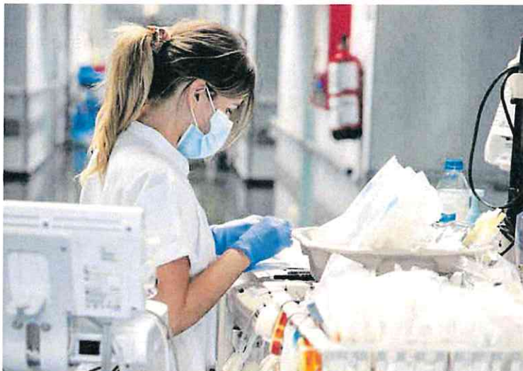
Una enfermera en el Hospital de Torrejón de Ardoz, en Madrid.

Aparte de las 123 que hicieron las maletas el pasado año, hay que sumar otras siete que también pi-