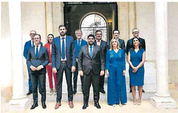
Los integrantes del Gobierno regional posan tras su toma de posesión.