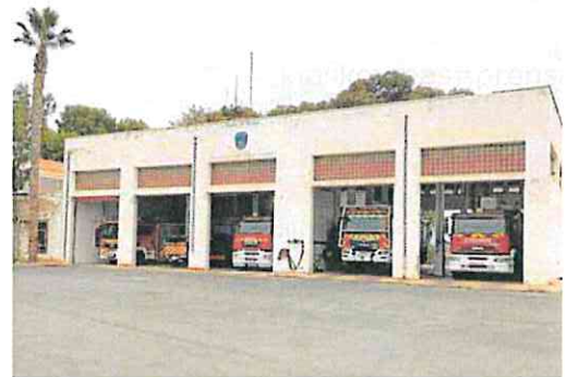
Instalaciones del parque de bomberos de Los Alcázares. A. S.

El deterioro del recinto es «vergonzoso y con problemas de in-