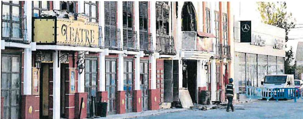
Fachada de Teatre, la discoteca siniestrada el pasado 1 de octubre, pocos días después del incendio.