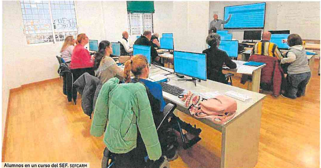
Alumnos en un curso del SEF.

La formación subvencionada que llega a través del SEF, permite que tanto ocupados como desempleados puedan disponer de una forma-