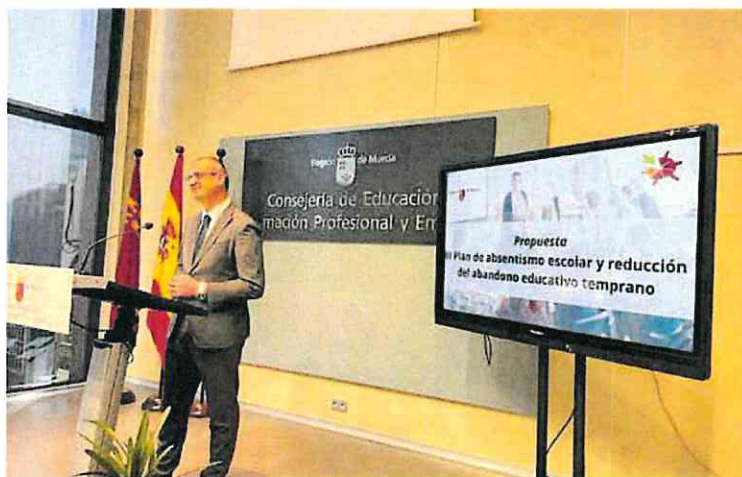
El consejero de Educación, Víctor Marín, presenta el III Plan de absentismo escolar, ayer.

El plan también plantea «simplificar el protocolo para la detección de casos de absentismo y abandono para actuar más rápidamente en los alumnos en esta situación», según explicó ayer el consejero de Educación, Víctor Marín. Además, «se reforzará la colaboración municipal con comisiones específicas de seguimiento de estos alumnos y la monitorización de datos en tiempo real para que la intervención surta efecto de manera inmediata», añadió.