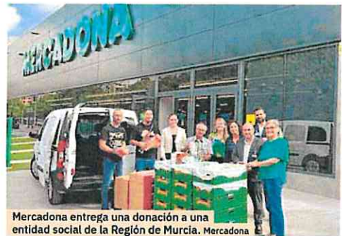
Mercadona entrega una donación a una entidad social de la Región de Murcia. Mercadona

En esta última edición, Mercadona ha puesto a disposición del proyecto un total de 1.632 tiendas en las que realizó distintas actividades de coordinación y de comunicación para que los clientes pudieran efectuar sus donaciones monetarias, en múltiplos de 1 euro, en el momento de la compra al pasar por caja. «Abogamos por esta modalidad porque permite adaptar las donaciones a las necesidades reales de los beneficiarios y, al mismo tiempo, multiplicar su