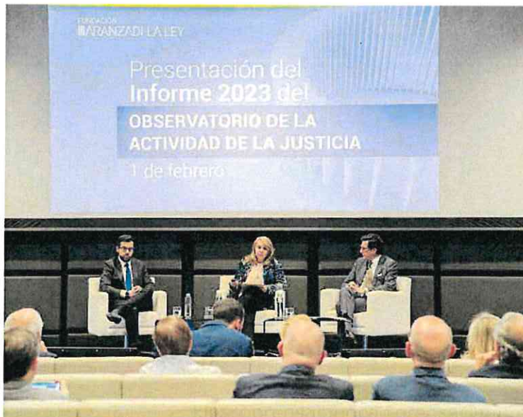
Presentación del Informe 2023 del Observatorio de la Actividad de la Justicia.