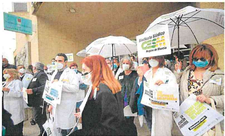
Protesta de médicos por la situación en Primaria, el año pasado en Murcia.

Este plan incluyó la creación de 111 nuevas plazas de Medicina de Familia en la primavera de 2023. Pero, un año, después, solo están cubiertas 37, advierte Cesm. Detrás de este pobre balance está el déficit de médicos, un problema que afecta a todas las comunidades, pero el sindicato está convencido de que la Consejería podría