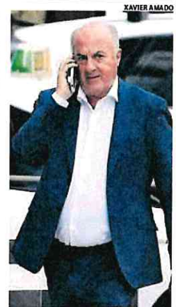
El juez García Castellón.

Pero el fiscal lo hace justo para argumentar lo contrario. No ve suficiente indicio para actuar contra el expresidente las conversaciones que le presentan como conocedor del nacimiento de Tsunami o con el empresario Josep Campmajó, en la que admitía la posibilidad de que se produjera un muerto de cualquiera de los dos lados en las movilizaciones.