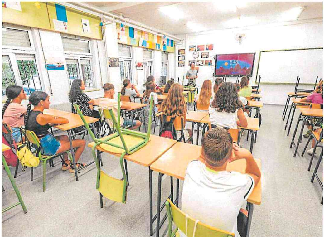
Alumnos de primero de Secundaria en el Instituto Alqubla de Murcia, el primer día de este curso.

El complejo procedimiento que los institutos, la Administración, las familias y los servicios sociales deben completar para iniciar los procesos contempla en la ac-