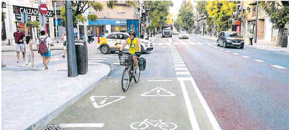
El primer parking subterráneo que se va a construir será el de la calle Floridablanca, donde este martes comienzan las catas.