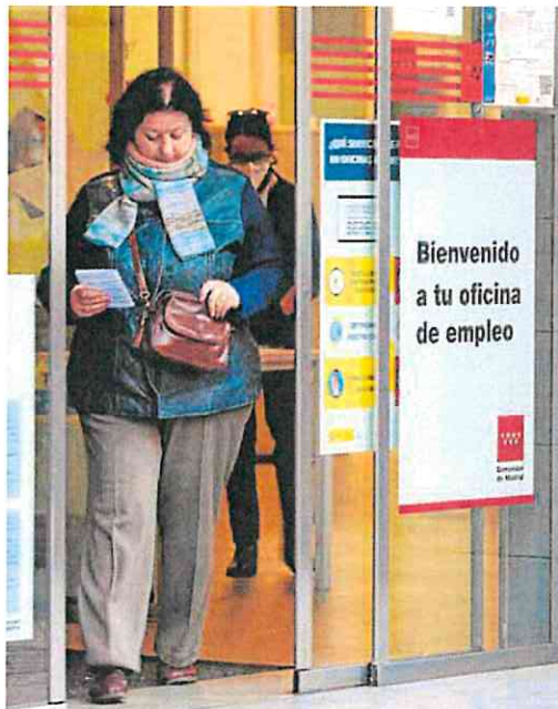
Los mayores de 52 años son casi la mitad de beneficiarios. J. R. LADRA

El Consejo de Ministros aprobará hoy subir el Salario Mínimo Interprofesional (SMI) un 5% para 2024 desde los actuales 1.080 euros mensuales por catorce pagas hasta los 1.134 euros. Esta subida se aplicará con efectos retroactivos, por lo que los más de 2,5 millones de trabajadores que se beneficiarán de esta medida lo cobrarán desde el pasado 1 de enero. Así lo anunció el pasado sábado el propio presidente del Gobierno, Pedro Sánchez, que ayer se defendió de las críticas de los empresarios a este incremento de 54 euros al mes y alegó que distribuir la riqueza «es de sentido común». Así, aseguró que el crecimiento económico de España también se debe a que se va recuperando la capacidad adquisitiva «después de muchos años congelada o deteriorada».