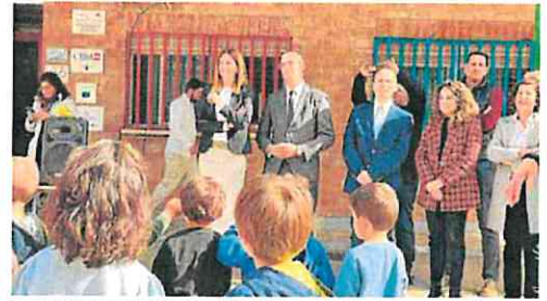
La alcaldesa, junto al consejero, ayer, en el acto de inauguración. AVTO.