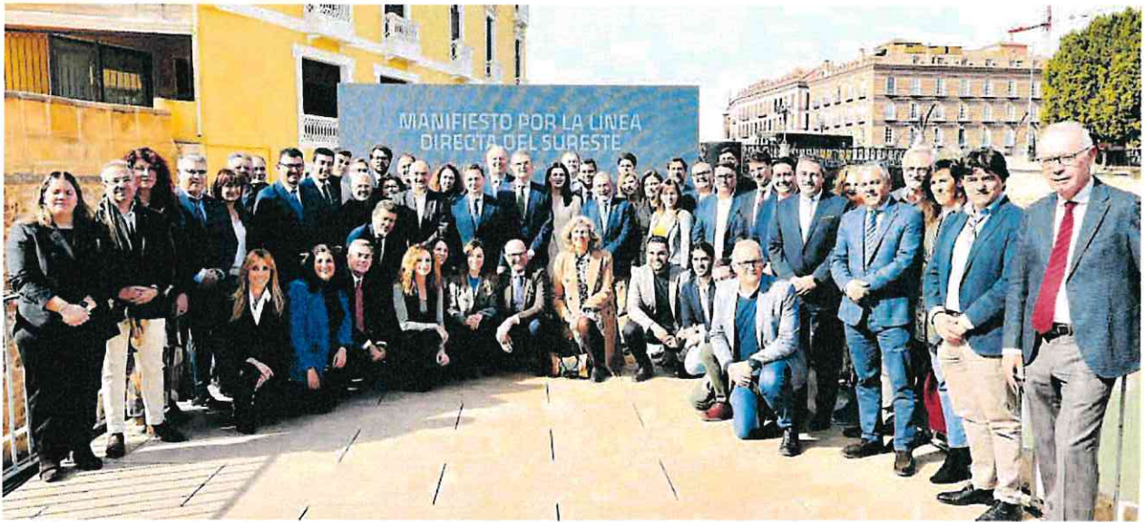
Foto de familia, ayer en los Molinos del Río de Murcia, tras la firma del manifiesto.