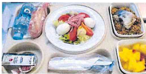
Un menú servido en un hospital de la Región.