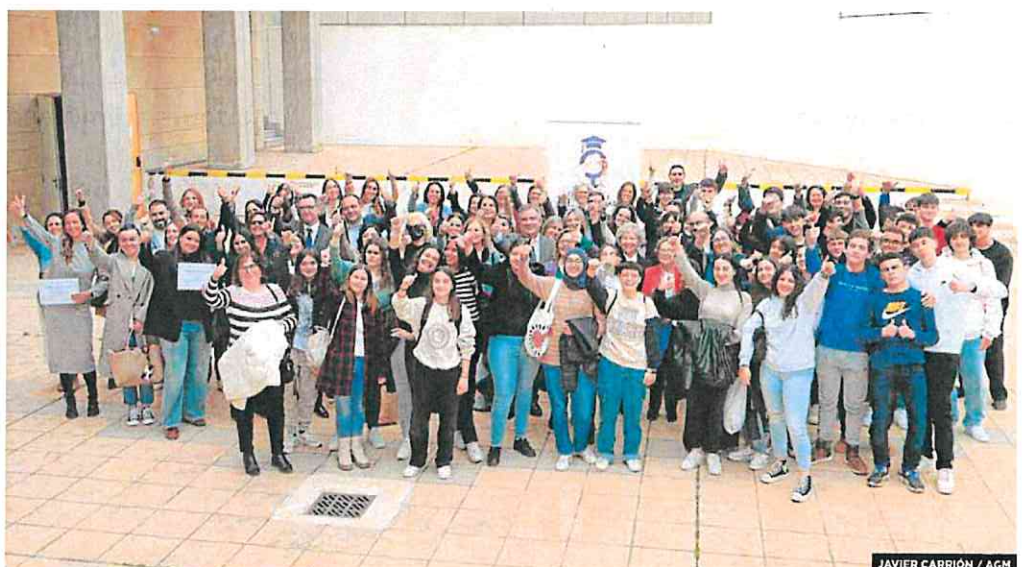
JAVIER CARRIÓN / AGM

El precio final de la matrícula depende del área de conocimiento, pero oscila entre los 800 y los mil euros al año. En las universidades privadas, la cifra se dispara a entre 9.000 y 10.000 euros.