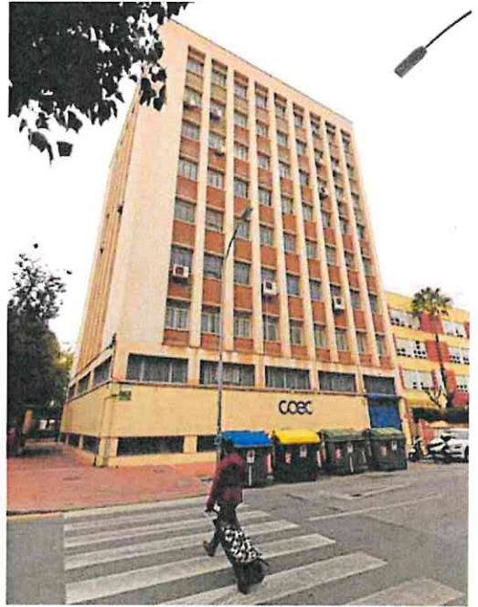
Un vecino va por el paso de cebra frente al edificio de Coec.

La próxima reunión de la Comisión Consultiva del Patrimonio Sindical aún no tiene fecha establecida, pero el secretario general de ese sindicato cree que no se demorará mucho, porque se trata de un trámite que el Ministerio debe resolver en el menor tiempo posible. Lo que sí habrá el próximo lunes es una reunión de UGT con la