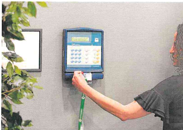
Una trabajadora ficha tras terminar su jornada laboral.

Lo que en ningún caso podrán hacer las mutuas es firmar las altas, algo que solo podrá hacer el médico de la Seguridad Social, pese a que las mutuas llevan tiempo pidiendo poder hacerlo. Estas sí colaborarán un informe en el que se indique que el trabajador ya está listo para recibir el alta, pero deberá ser supervisado por un médico público.