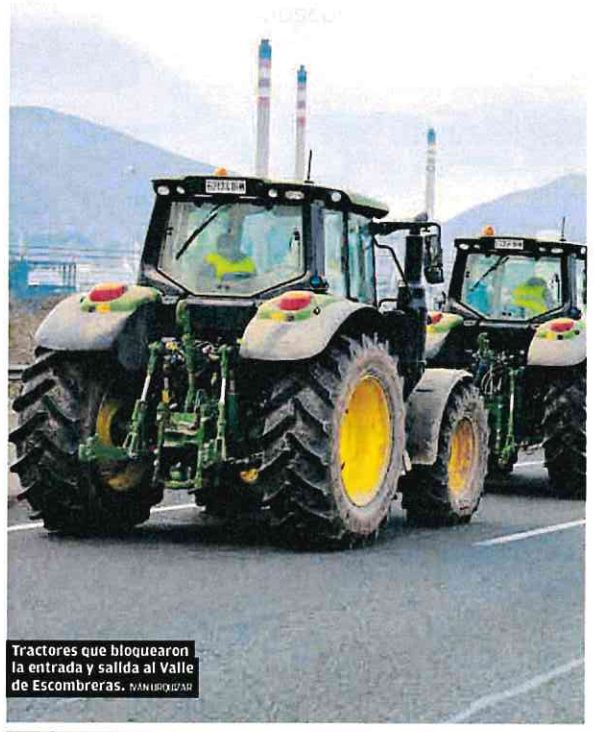
Tractores que bloquearon la entrada y salida al Valle de Escombreras. MANUELO RIZAR

Por su parte, CC OO exige a las empresas que garanticen la seguridad de los profesionales del transporte ante los bloqueos.