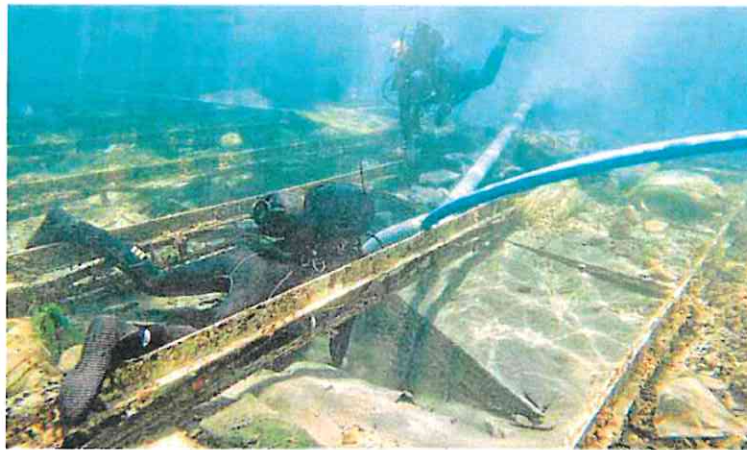
Arqueólogos supervisan, el verano pasado, el estado de conservación del pecio fenicio de Mazarrón.

La subvención directa a las patronales, aprobada ayer en el Consejo de Gobierno, llega tres meses después de que el grupo Parlamentario de Vox registrara en la Asamblea una iniciativa, que no salió adelante, para recortar las compensaciones económicas a las organizaciones empresariales y sindicales de la Región.