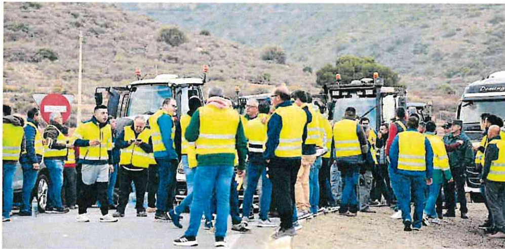
Los tractores cortaron la carretera de Escombreras.