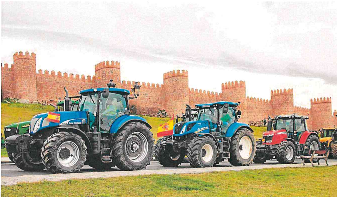
Varios tractores durante la tercera jornada de protestas de los ganaderos y agricultores, ayer en Ávila.