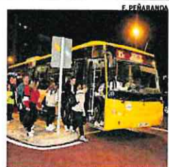
Usuarios montando en autobús.

Sin embargo, en seis comunidades los autobuses urbanos están todavía por debajo de las cifras previas a la pandemia: Galicia (-6,45%), Aragón (-5,70%), Ca-