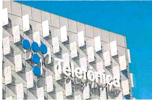
Vista de la sede de Telefónica en Madrid, ERE

Finalmente, la empresa ha aceptado un total de 3.420 salidas, aunque se quede una plaza sin cubrir respecto al acuerdo. En un primer momento se habían denegado más por ser de áreas consideradas críticas y exceder el 35% pactado, pero UGT solicitó a la empresa que reduje