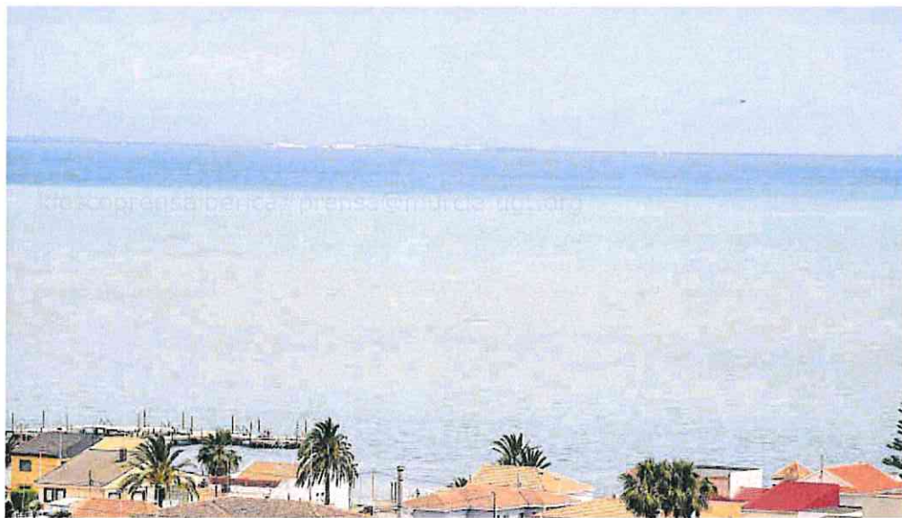
La 'mancha blanca' que hay en el Mar Menor es visible desde El Carmolí.