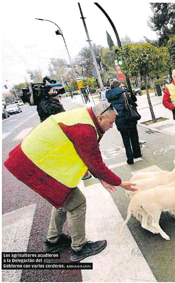
Los agricultores acudieron a la Delegación del Gobierno con varios corderos. JUAN CARLOS CAVIL

Apela a la responsabilidad de los agricultores para que ejerzan «su derecho legítimo de manifestación» y recuerda que «el Gobierno de España, como demuestra cada martes en consejo de Ministros, está al lado de los agricultores y por eso aprueba continuamente ayudas millonarias para que puedan seguir desarrollando su actividad en las mejores condiciones posibles».