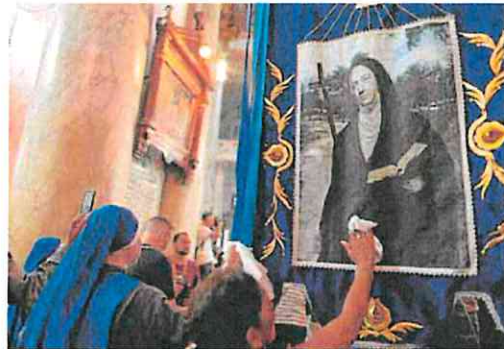
Felligreses ante el retrato de Mama Antula en Buenos Aires.

ción de Mama Antula, está previsto que el Papa y Milei mantengan este lunes una audiencia privada en el Palacio Apostólico del Vaticano. El encuentro servirá para que ambos terminen de acercar posturas tras las duras palabras que el político populista dedicó a su compatrio-