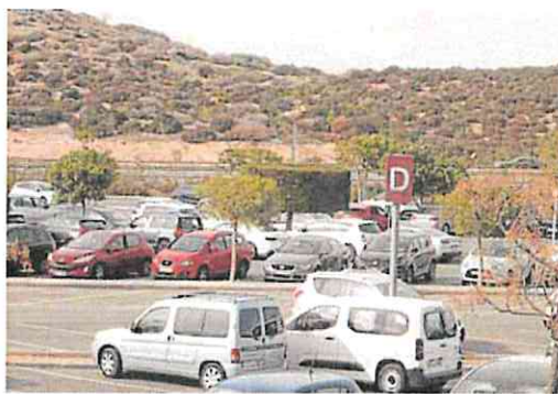
Parcela donde irá la futura Ciudad de la Justicia, con el aparcamiento del Hospital Santa Lucía en primer término.

El Ayuntamiento cedió al Ministerio una parcela de 66.485 m 2 , que debe dividirse en tres para destinar 27.700 m 2 , aceptados verbalmente por la exministra de Justicia Pilar Llop, a cubrir las necesidades