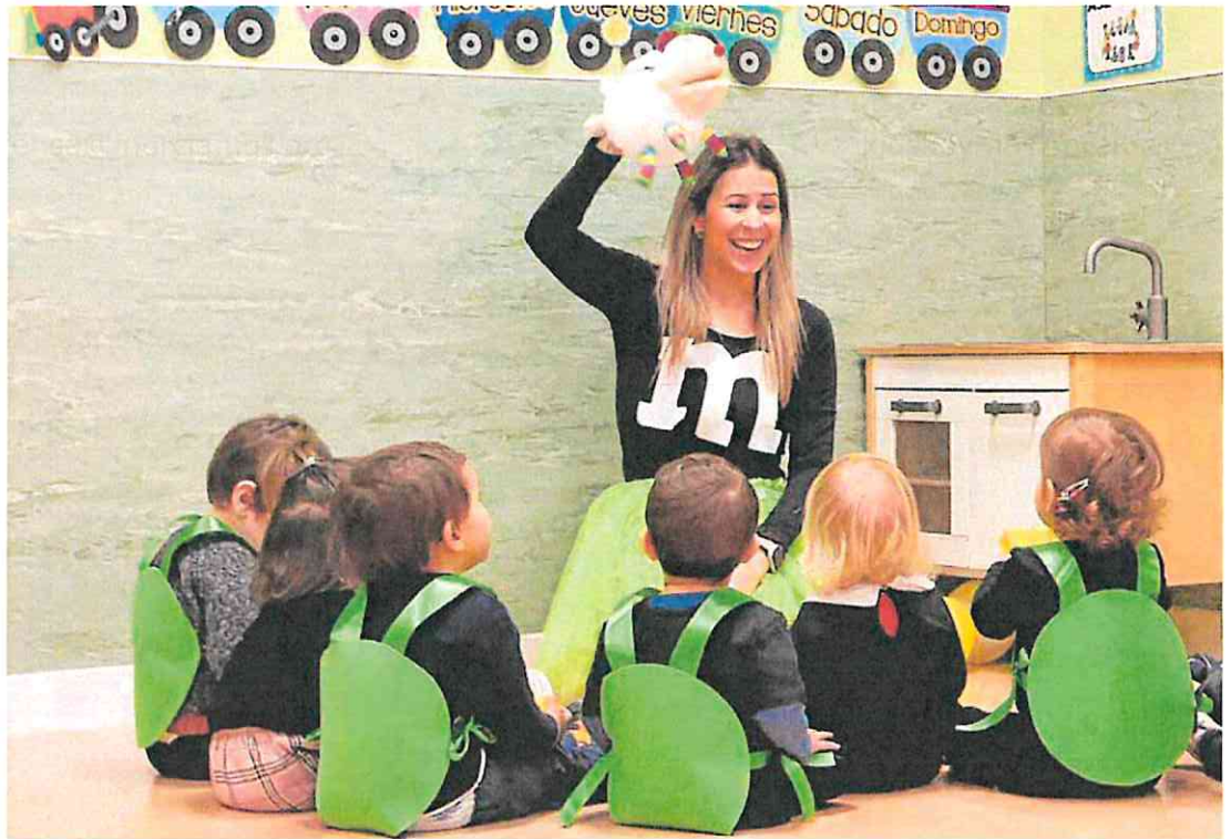
Niños de dos años en la escuela Infantil Crecemos, en Murcia.

La Administración subvencionará las plazas, como ya hace desde este curso en los colegios concertados, y los centros las ofrecerán de forma gratuita a los alumnos. La partida, que inicialmente se ha presupuestado en tres millones de euros, irá directamente a las guarderías privadas, que quedan así incluidas en el plan de gratuidad de plazas de Infantil que comenzó a desarrollarse hace dos años. En cualquier caso, cada centro tendrá una sola aula gratuita, el equi-