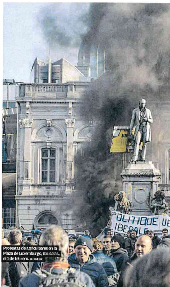
Protestas de agricultores en la Plaza de Luxemburgo, Bruselas, el 1 de febrero.

Ante la gran pregunta, ¿estamos ante el germen de un partido político? Corbalán no sabe qué responder. «Venimos a cambiar políticas, no políticos. Si para ese cambio de políticas el campo necesita tener representantes con las mismas reglas del juego que tienen los políticos, que al final son los que hacen las normas, pues habrá que hacerlo».