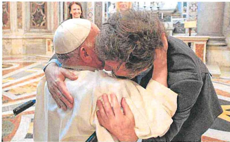
Papa Francisco recibe al Presidente de Argentina, Javier Milei, en la Basílica de San Pedro.

Tras la canonización de Mama Antula, está previsto que el Papa y Milei mantengan hoy una audiencia privada