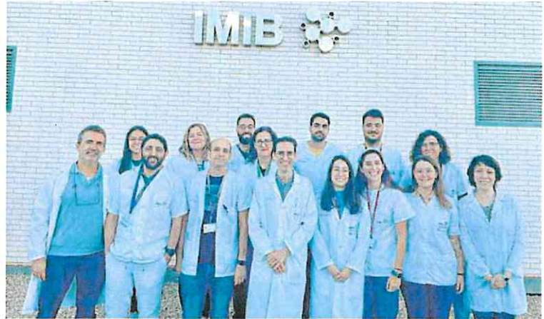
El equipo del Instituto Murciano de Investigación Biosanitaria (IMIB) que ha logrado este avance. IMIB