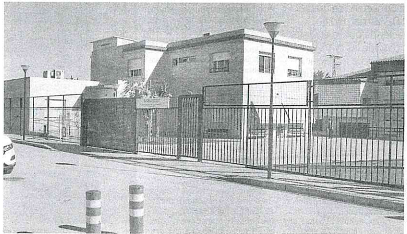
Instalaciones de la residencia Julio López Ambit, en la pedanía murciana de El Palmar.

Por este motivo, la consejera citó el pasado lunes a los representantes de la asociación a un encuentro en el que abordar sus reclamaciones, según confirmaron fuentes de Política Social. Sin embargo, los familiares no encontraron la respuesta que esperaban. «Nos han hecho las mis-