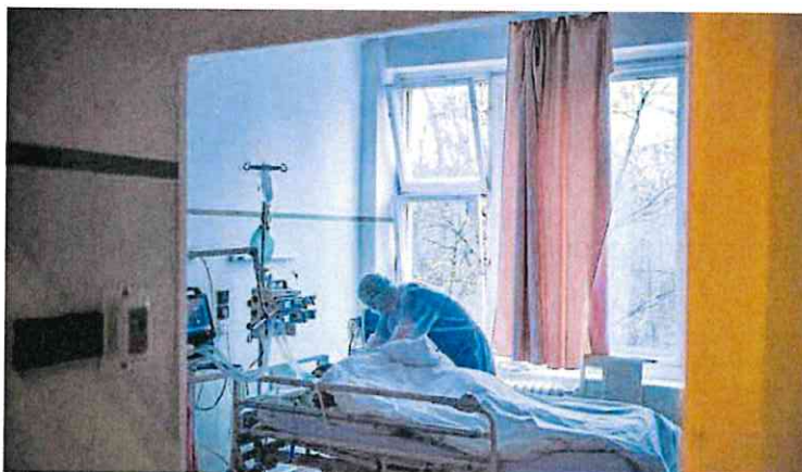
Una enfermera atiende a un paciente grave ingresado en un hospital.

► El Colegio aborda la situación de la profesión y las mejoras que consideran necesarias en una jornada