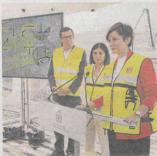
La ministra Isabel Rodríguez (d), en una visita a unas obras en Canarias.

Cuando un comprador quiere comprar una vivienda y necesita una hipoteca, el banco no le concede todo el capital necesario sino, como máximo, el 80% del valor de tasación. Es decir, es necesario tener ahorrado el otro 20%. Por ejemplo, para un inmueble de 200.000 euros hace falta disponer, de primeras, con 40.000 euros. Muchos jóvenes carecen de estos ahorros, por lo que será el Estado el que avale ante la entidad financiera esa cuantía bajo determinadas condiciones: que sean jóvenes de menos de 35 años, con una renta inferior a 37.800 euros al año, un patrimonio que no supere los 100.000 euros y que se destine