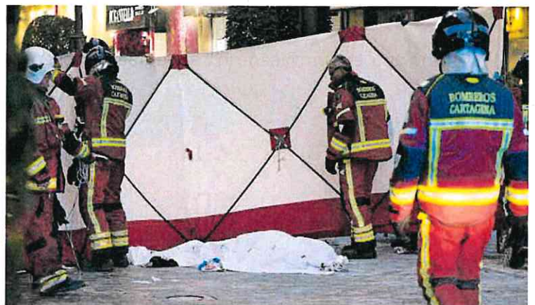
Bomberos cubren el cuerpo sin vida del hombre en la calle Santa Florentina, ayer.

Lo sucedido causó un gran impacto entre las personas que lo presenciaron. «Pavor, horroroso», escribía en sus redes sociales un testigo, que agregó que lo acontecido «parecía una película de ciencia ficción».