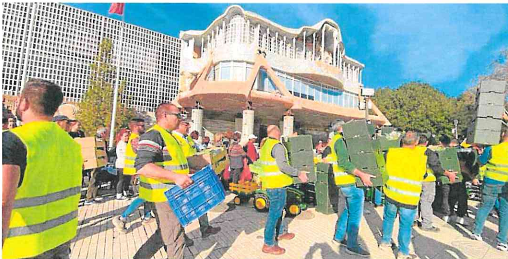
Agricultores con cajas de productos para el reparto en la puerta de la Asamblea Regional, ayer.