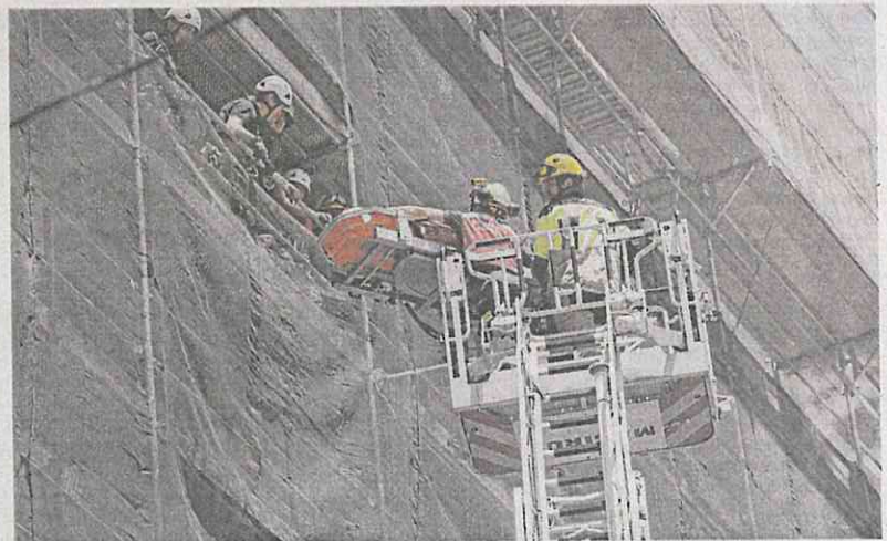
Los bomberos rescatan a un obrero de la construcción herido, tras caer este de una de las plantas del edificio en obras en el que trabajaba, en una imagen de archivo.

La ley abre la puerta a que los ayuntamientos puedan cobrar a los usuarios por entrar con el coche en Zonas de Bajas Emisiones (ZBE), habitualmente el centro de las ciudades. El ministro recordó que son peajes «opcionales» a los que la ley «no obliga, solo habilita», es decir, da cobertura legal para que se implementen si algún ayuntamiento quiere hacerlo.