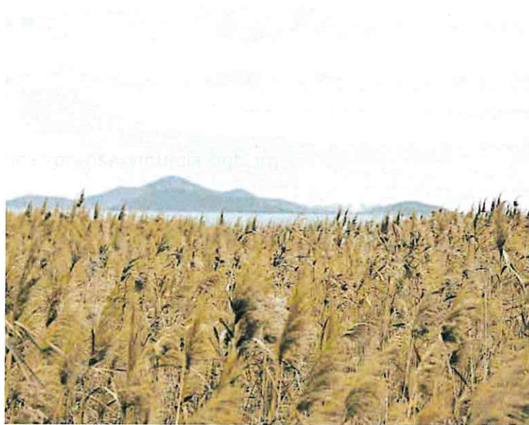
Imagen del entorno del Mar Menor, con la laguna salada, al fondo.

En este sentido, insistió en la necesidad de disminuir el nivel de