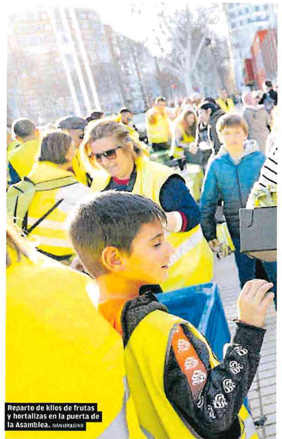
Reparto de kilos de frutas y hortalizas en la puerta de la Asamblea.

Una idea de unión dentro del mundo agroalimentario y con llamamiento a otros sectores para ser capaces de aunar el mayor número de apoyos, demostrar el músculo del mundo rural en la Región de Murcia y plantear las soluciones del «sector agrario regional».