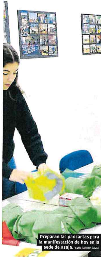
Preparan las pancartas para la manifestación de hoy en la sede de Asaja. JUAN CARLOS CAVAL

La Delegación del Gobierno y la Consejería de Agricultura, puntos de concentración para los manifestantes