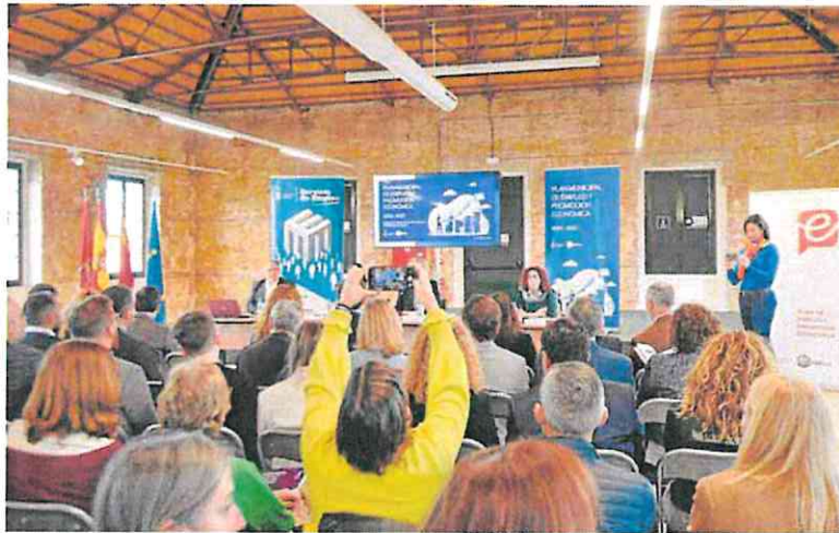
Miembros del Consejo Territorial de Empleo, durante la jornada de ayer.

«La participación y colaboración entre distintas administraciones y con las asociaciones y