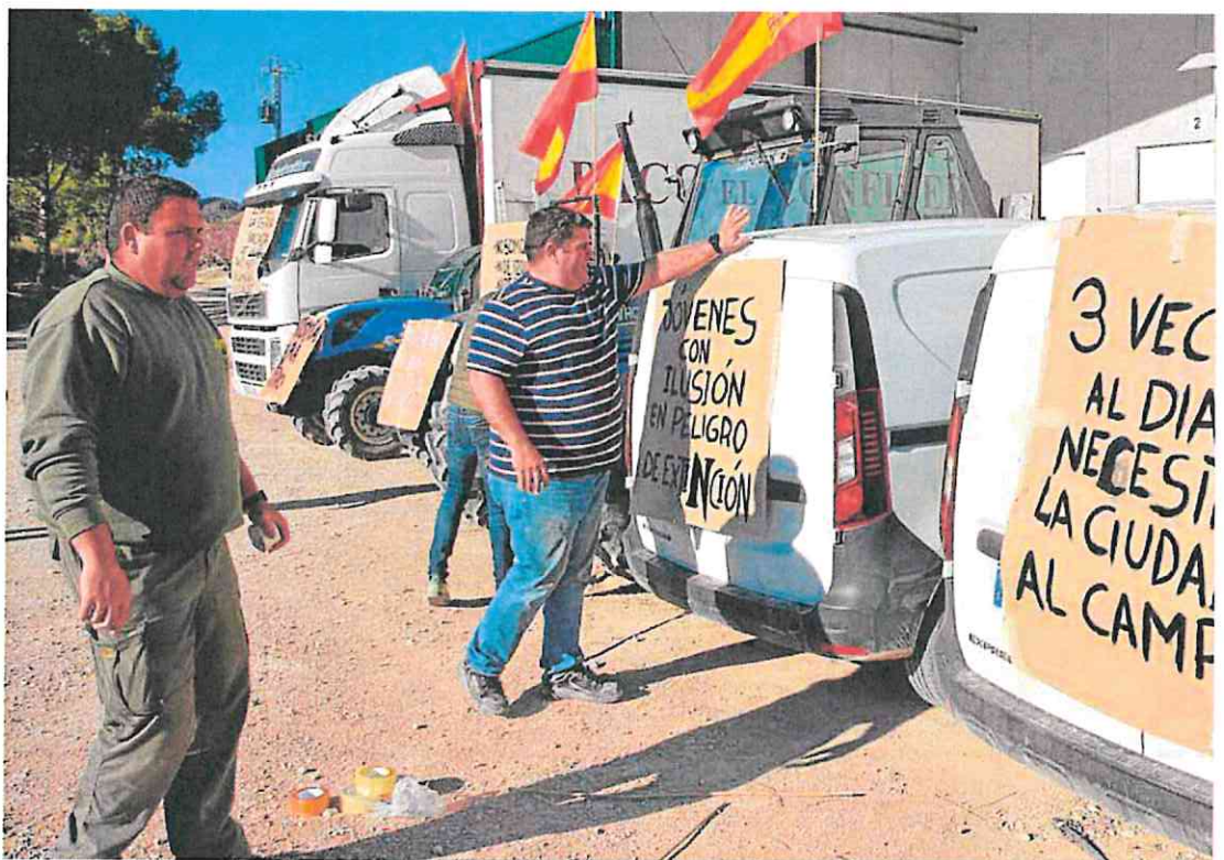
Varios agricultores preparan la cartelería de sus tractores, camiones y furgonetas en la empresa de frutas Paco el Confitero, en Cieza.

ca del Noroeste, las organizaciones agrarias han creado otro nuevo recorrido para que los agricultores de Mula y Pliego también puedan participar en la manifestación del 21-F. La empresa Co-frusa es el punto de partida a las 8.30 horas y el final será el polígono de Venta Cavila en Caravaca, por lo que ambos sentidos de la autovía del Noroeste estarán afectados. El resto de itinerarios (Altiplano, Vega Alta y Vega Media) se mantienen intactos.