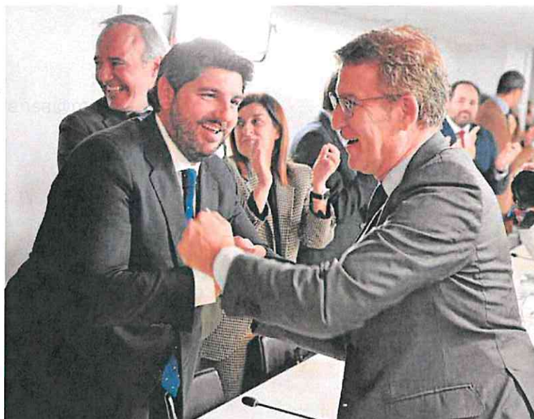
El jefe del Ejecutivo murciano, Fernando López Miras, felicita a Feijóo en el Comité Ejecutivo Nacional, ayer. »

Ante la plana mayor del partido, a la que había convocado en Génova para analizar los resultados electorales, el líder gallego hizo suyo el triunfo y se reivindicó frente a quienes veían en riesgo su continuidad y vaticinaban una crisis interna. «Si querían que fuera un plebiscito sobre mi liderazgo, ahí tienen el resultado», se jactó Feijóo devolviendo el golpe al PSOE, que obtuvo el peor dato de su historia en Galicia no llegando a su-