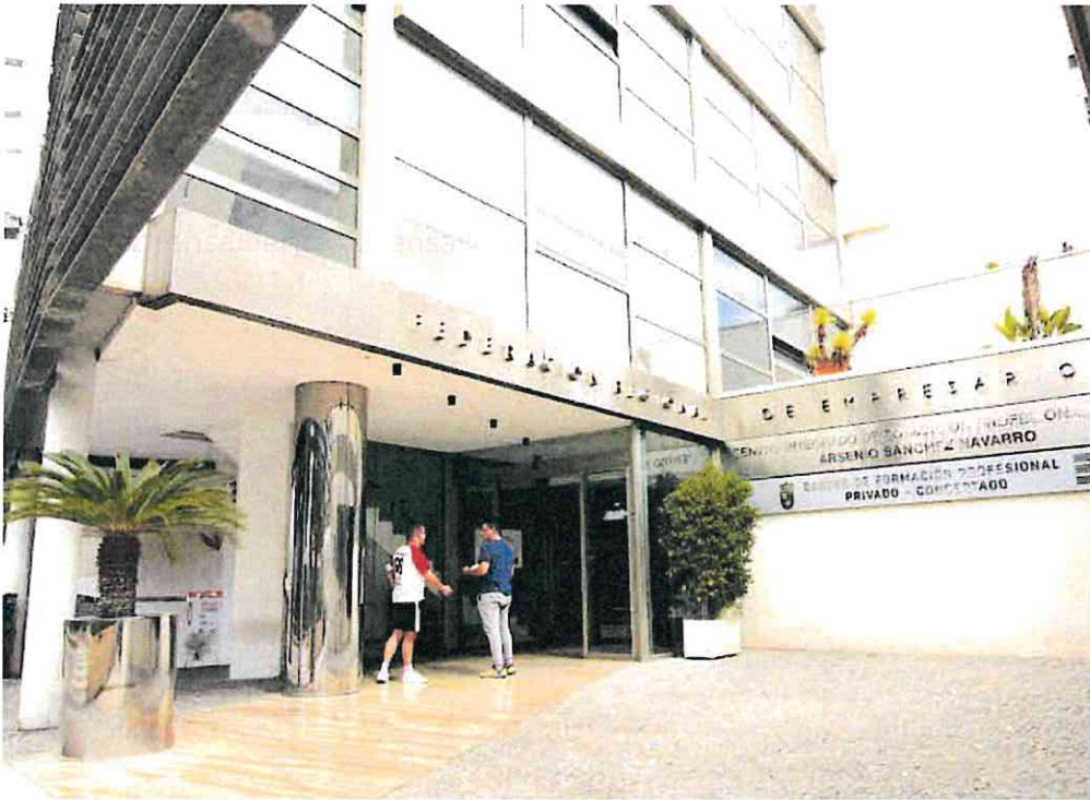
Puerta de acceso a las instalaciones de la Fremm.