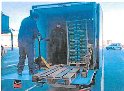
Operarios preparan en Gregal la verdura que se repartirá hoy.