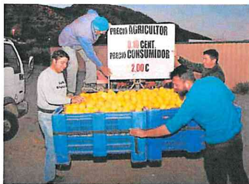
Carga de limones para la protesta, en Puerto Lumbreras.