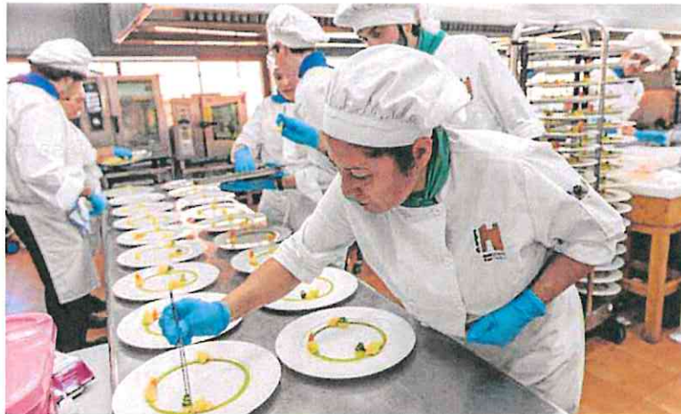
Un grupo de alumnos de la Escuela de Hostelería prepara uno de los platos que fueron servidos, ayer, durante la jornada de acogida a empresarios y proveedores.

La obra supondrá una inversión cercana a los 600.000 euros y tiene un plazo de ejecución de cuatro meses, explicó Marín durante su visita al instituto de FP. Allí asistió a la jornada de acogida a empresas colaboradoras y proveedores, donde los profesores y alum-