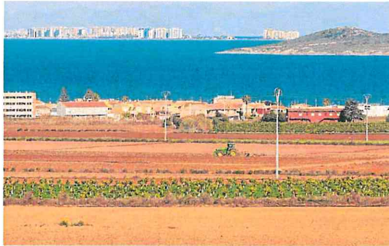
Terrenos agrícolas en las proximidades del Mar Menor.

El enfado en este territorio ha ido en aumento al acercarse el plazo máximo de entrega de la documentación que requiere la CHS a los usuarios de la Comunidad de Regantes del Campo de Cartagena y de Arco Sur para que acrediten que sus cultivos no dañan las masas de agua subterráneas. En concreto, los acuíferos Cuaternario y Andaluciense, declarados en 2020 en riesgo de no alcanzar el buen estado cuantitativo y químico. En un comuni-