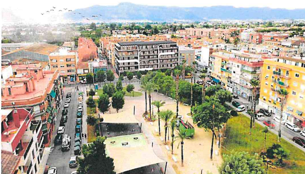
Aspecto que tendrá el edificio proyectado por Urbamusa para su desarrollo en régimen de cooperativa en la pedanía de Puente Tocinos.