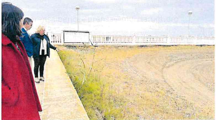
Los vecinos y representantes de MC supervisan el estado de las playas de Los Nietos.

El concejal de Movimiento Ciudadano exige al Gobierno local una mediación con la Demarcación de Costas y con la Comunidad Autónoma y «dejar ya de tomar el pelo a los vecinos, que viven una auténtica situación de abandono».