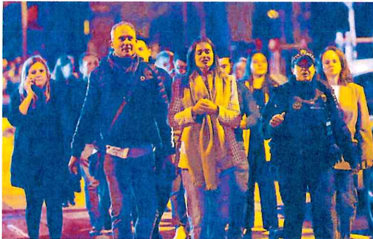
Una agente de la Policía Local acompaña a un grupo de vecinos de la finca.