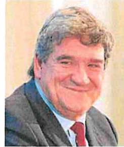
José Luis Escrivá.

El ministro calificó de «perversión» la tasa de reposición, que perpetúa la estructura sin atender a las nuevas necesidades (sólo se cubren las jubilaciones y si el ciclo económico es malo ni eso). Escrivá confirmó que se va a eliminar la tasa de reposición en la Administración a partir de 2025 —medida que implicará también a las comunidades autónomas—