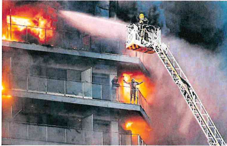
Los bomberos rescatan a una pareja atrapada en una terraza del edificio en llamas.

La historia más desgarradora es la de un matrimonio joven con dos niños, uno de ellos un bebé. Tal como ha podido confirmar este periódico, la familia se encontraba en casa cuando se desató el infierno. Se trata de un