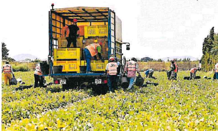
A nivel europeo, España es el primer Estado miembro receptor de estas ayudas.

Las beneficiarias serán 437 organizaciones de productores repartidas en 15 comunidades autónomas entre las que destacan, en términos de valor de producción comercializada y, en consecuen-