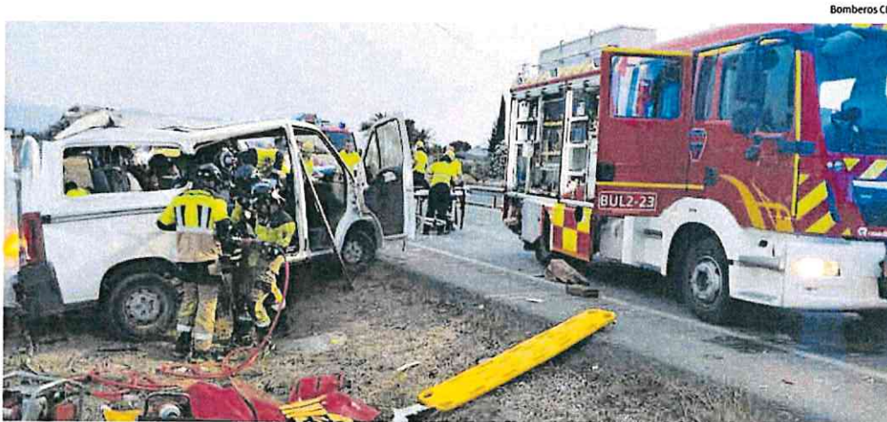
Los bomberos intervienen para liberar a los jornaleros que quedaron atrapados en la furgoneta accidentada.

El más grave se registró en enero de 2001 también en Lorca, cuando perdieron la vida doce trabajadores ecuatorianos al ser arrollada la furgoneta en la que se dirigían al trabajo por un tren de la línea de Lorca a Águilas.