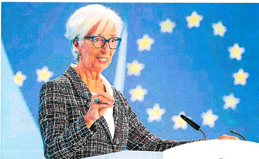
La presidenta del Banco Central Europeo (BCE), Christine Lagarde, ayer en la rueda de prensa posterior a la reunión del supervisor.

Los datos de las próximas semanas y meses servirán para «reforzar la confianza» del Banco Central Europeo