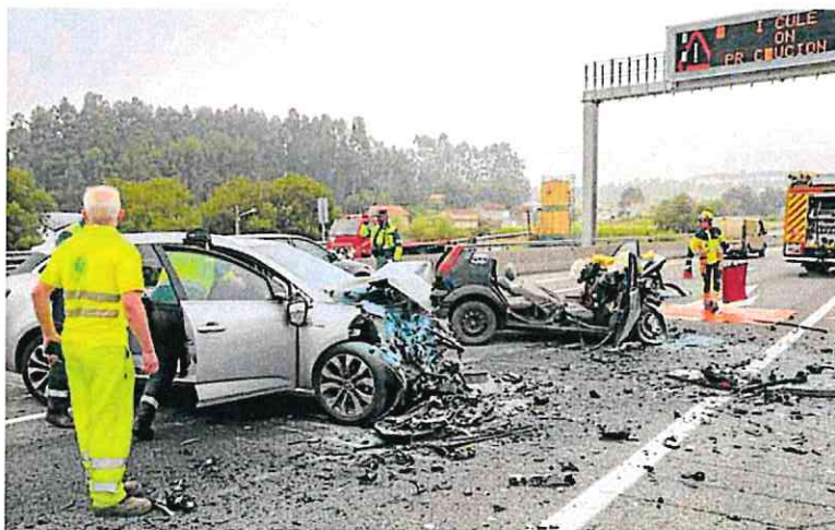
Equipos de emergencia retiran los vehículos destruidos en un accidente en una autovía de Pontevedra.

El informe también analiza las muertes de peatones. Detecta entre ellos un crecimiento anual de los positivos a tóxicos del 16%, hasta alcanzar al 58% de los fallecidos. Un 40% son mayores de 65 años y tiene tanto peso la presencia de alcohol en su sangre como la de psicofármacos.