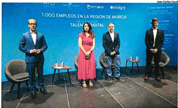
Presentación del proyecto de NTT Data en la Región de Murcia

Añadió que el nuevo 'hub' de la compañía convertirá sus oficinas de Murcia en un centro tecnológico de referencia y que la consultora tecnológica generará empleo para jóvenes recién titulados y expertos en tecnologías de la información. También facilitará el retorno de profesionales murcianos ■