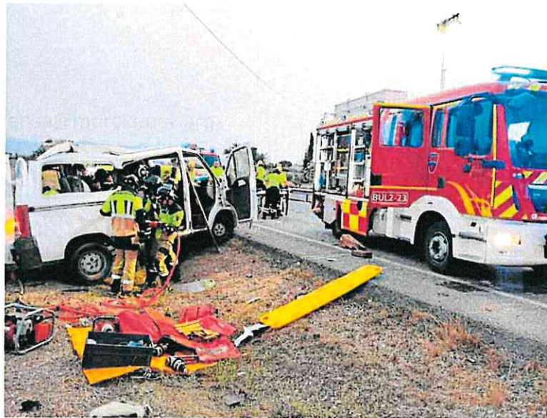
Los bomberos rescatan a los heridos tras el accidente en la carretera que une Lorca y Águilas. cas

Los heridos fueron trasladados en varias ambulancias al hospital Rafael Méndez con lesiones de diversa consideración y siete quedaron ingresados. Cuatro están graves, dos de ellos fueron operados y otros dos precisan de neurocirugía, y los tres restantes pre-