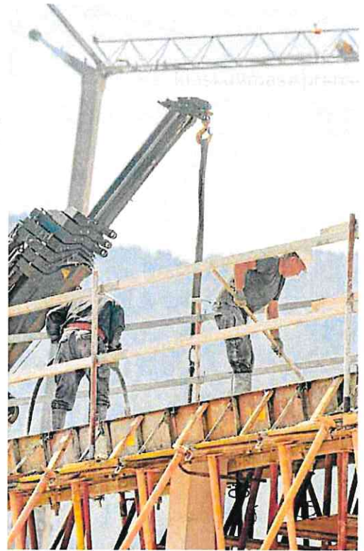
Dos trabajadores en un edificio en construcción en Murcia.

En la jornada organizada recientemente en Murcia con motivo del Día Mundial para la Seguridad y Salud en el Trabajo, un grupo de especialistas debatieron acerca de las reper-