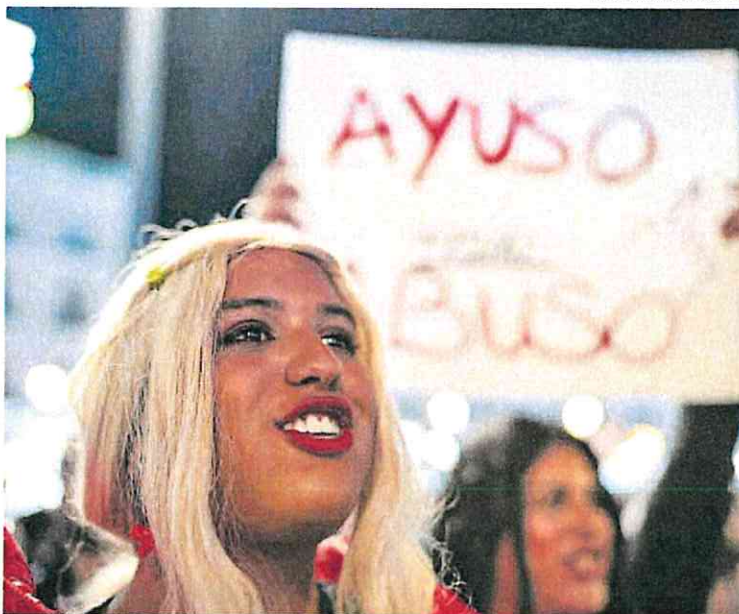
Manifestación contra la modificación de las leyes trans y LGBTI de la Comunidad de Madrid en 2023.

Como el Gobierno de Sánchez invocó en su recurso el artículo 161.2 de la Constitución, el pleno ha suspendido la vigencia y aplicación de los preceptos impugnados de las citadas normas, desde el pasado 26 de junio, que es cuando se interpuso el recurso para las partes del proceso y desde que su publicación en el Boletín Oficial del Estado para el resto. La suspensión se realiza por un periodo de cinco meses, pero pueden ser prorrogables hasta la resolución por el órgano de garantías de los recursos.