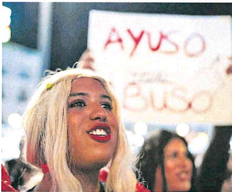
Manifestación contra la modificación de las leyes trans y LGTBI de la Comunidad de Madrid en 2023.

Como el Gobierno de Sánchez invocó en su recurso el artículo 161.2 de la Constitución, el pleno ha suspendido la vigencia y aplicación de los preceptos impugnados de las citadas normas, desde el pasado 26 de junio, que es cuando se interpuso el recurso para las partes del proceso y desde que su publicación en el Boletín Oficial del Estado para el resto. La suspensión se realiza por un periodo de cinco meses, pero pueden ser prorrogables hasta la resolución por el órgano de garantías de los recursos.