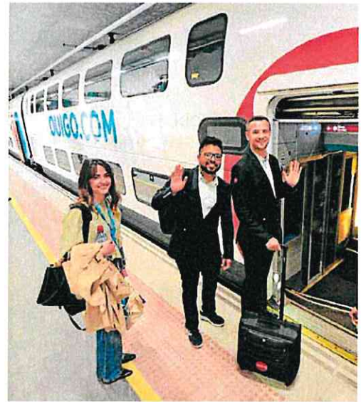
Ouigo presentó su tren en Murcia el pasado mes de mayo. v. vicéns

La Mesa en Defensa del Ferrocarril de Almería, por otra parte, integrada por unas 230 asociaciones y colectivos, señaló