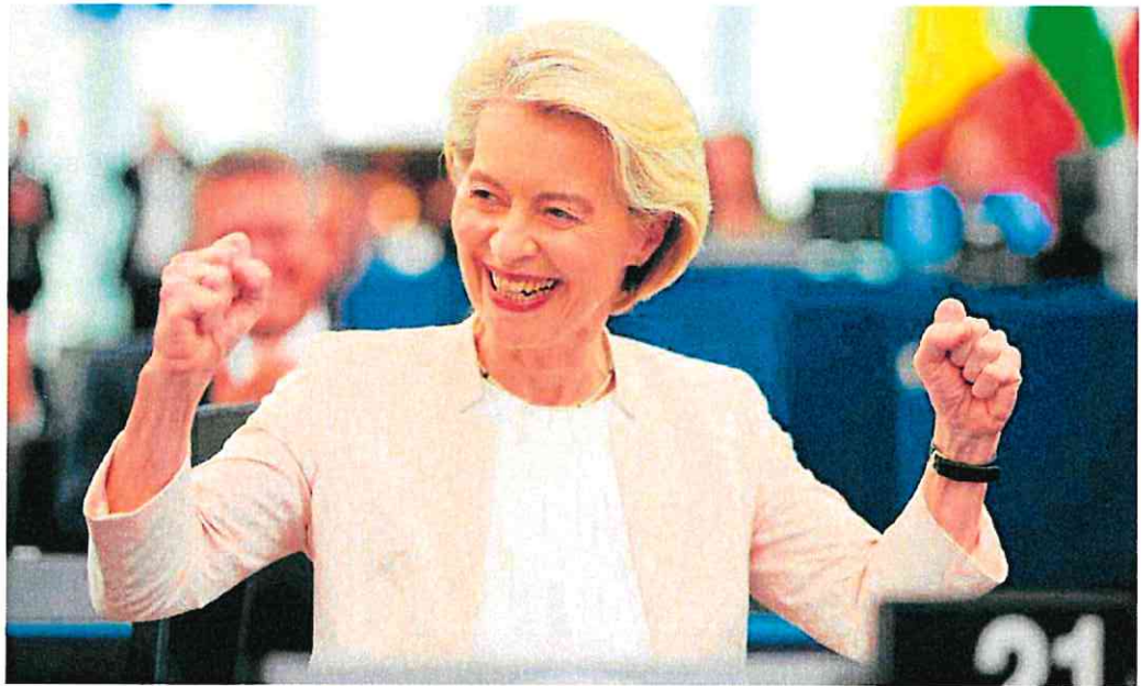
La conservadora Ursula von der Leyen celebra su reelección en el pleno de la Eurocámara en Estrasburgo.

Ya pasado el filtro de la Eurocámara, éste será un verano agita-