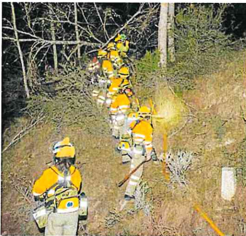
Una brigada de bomberos hace frente a las llamas. ROS CAVAL