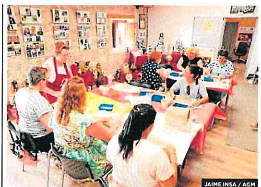
JAI ME INSA / AGM