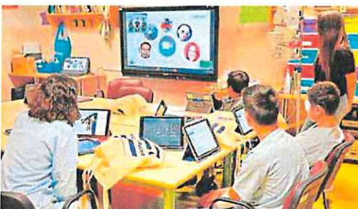
Participantes en el taller 'DGmakers 4Inclusion', ayer, en La Arrixaca.

alumnos mejorar sus habilidades tecnológicas de una forma divertida», según destacó el director general de Transformación Digital, Javier Martínez Gilabert. Para ello, contarán con un proyector interactivo que funciona en superficies horizontales y que permite interactuar con los contenidos a través del movimiento.