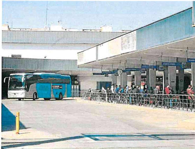
Pasajeros a la espera de tomar una expedición, en la estación de San Andrés.