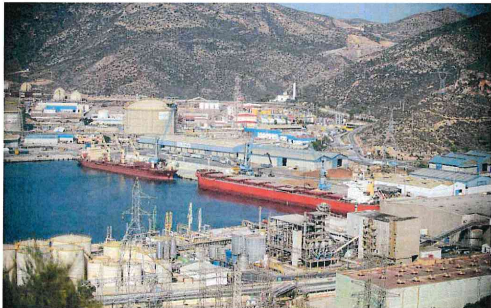
Zona Industrial del Valle de Escombreras en Cartagena.

► Las exportaciones alcanzaron los 14.020 millones en 2023, una cifra inferior en un 2,7% a la del año anterior. Entre los productos que se han salvado del retroceso en las ventas al exterior destacan las frutas y verduras, que suman 150 millones más; los bienes duraderos, con 15 millones más, y los componentes de automóvil, con seis más. Sin contar los productos energéticos, aumentan las ventas a Alemania y Francia, principales clientes de los productos de la Región.