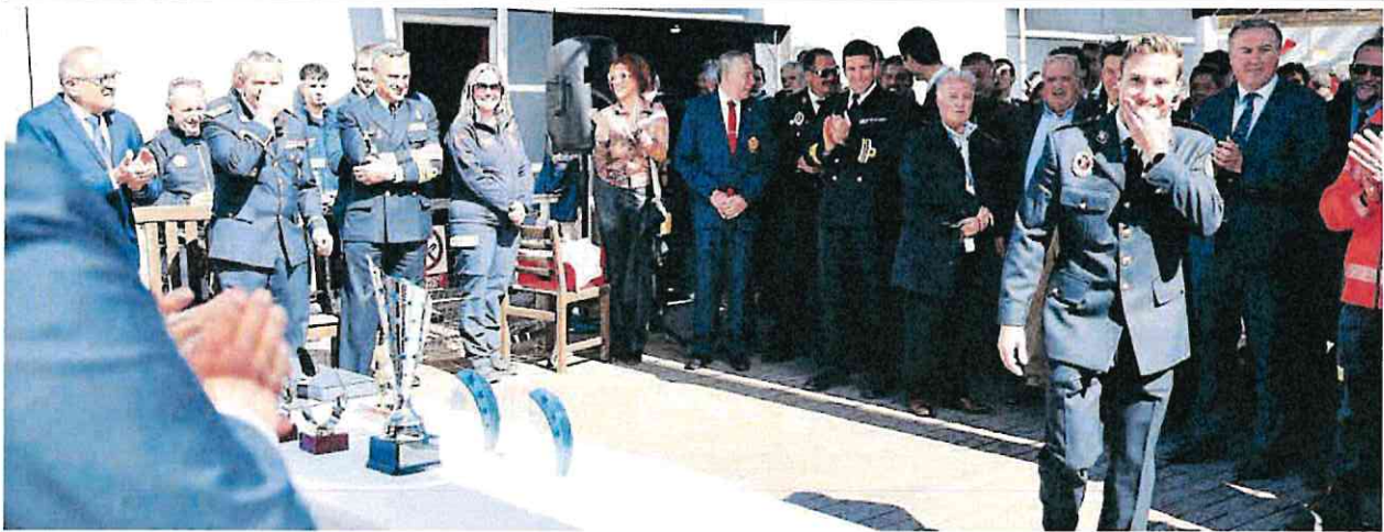
Uno de los bomberos de Cartagena se dispone a recoger uno de los premios entregados durante los actos del patrón del cuerpo, San Juan de Dios, en el Club de Regatas.