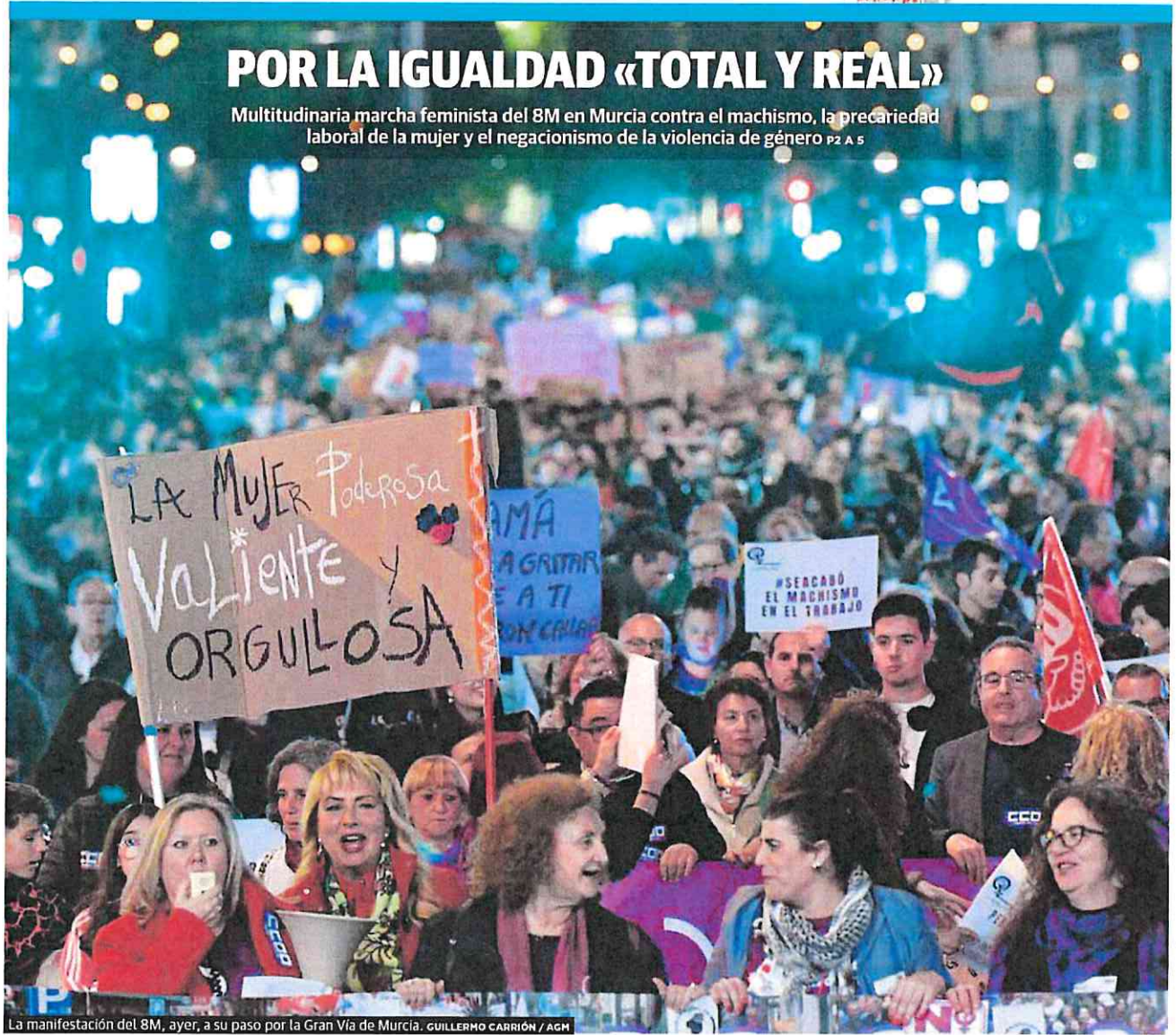
La manifestación del 8M, ayer, a su paso por la Gran Vía de Murcia.

Multitudinaria marcha feminista del 8M en Murcia contra el machismo, la precariedad laboral de la mujer y el negacionismo de la violencia de género P2 A 5