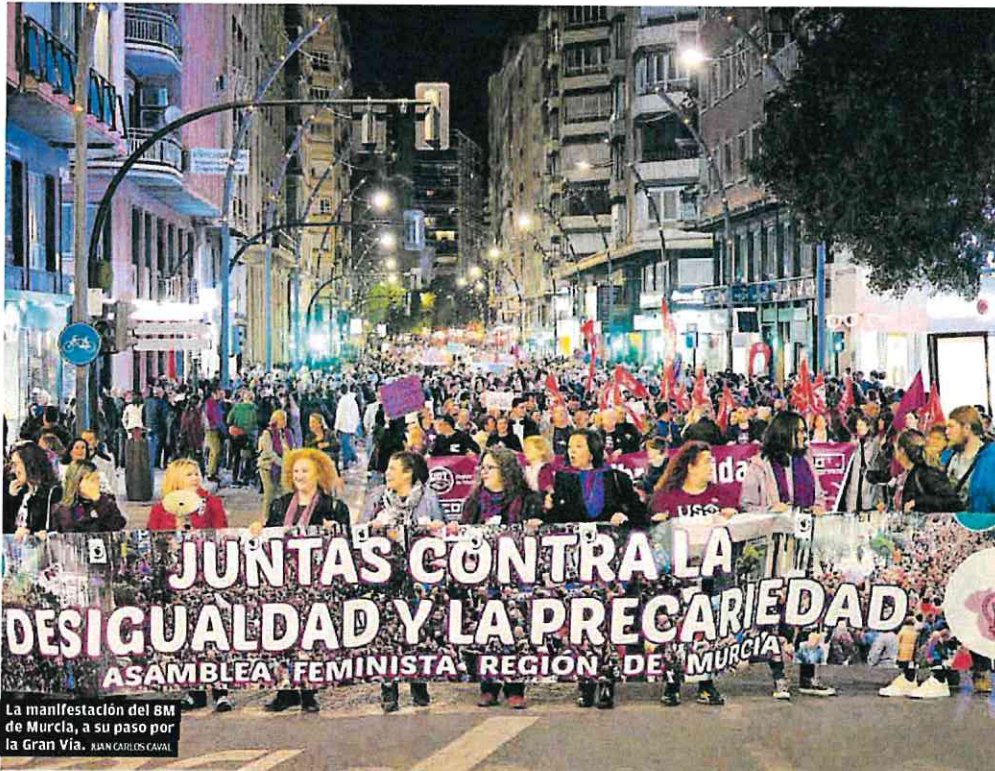
La manifestación del 8M de Murcia, a su paso por la Gran Vía. XAN CARLOS CAVAL