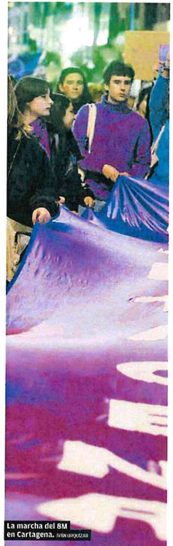
La marcha del 8M en Cartagena. IVAN URRIZAR