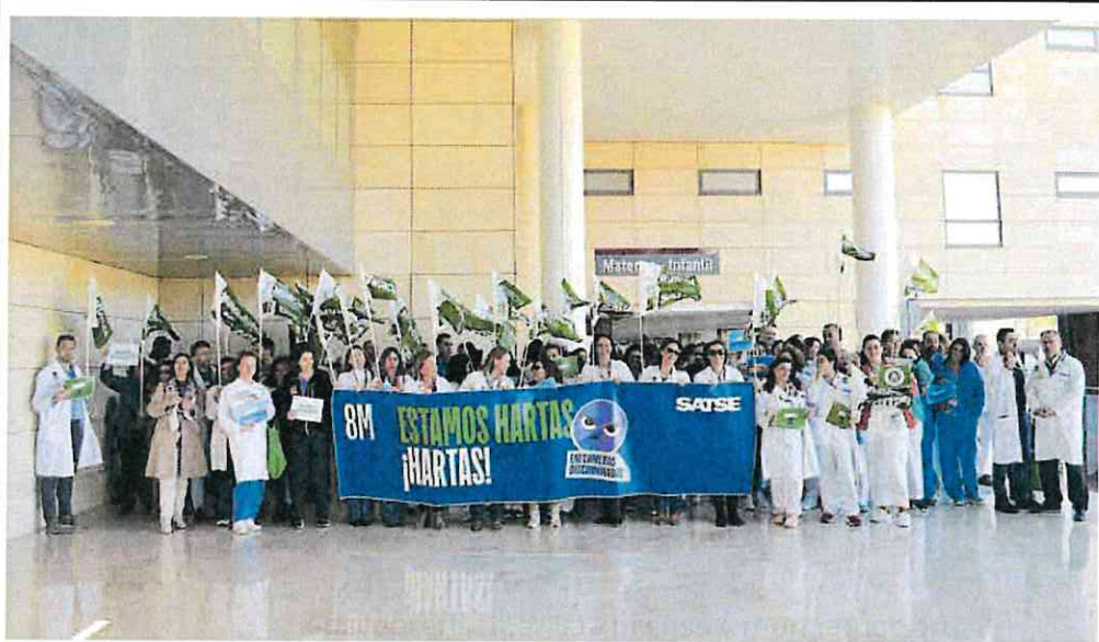
Decenas de enfermeras se concentraron en el exterior de la Arrixaca de Murcia desplegando una pancarta en la que denuncian su hartazgo. RAÚL TORTOSA LÓPEZ

Tras los delitos contra el patrimonio y la violencia de género, las causas que figuran con mayor número de presos son las relacionadas con la salud pública, principalmente por comercio y tráfico de sustancias estupefacientes.