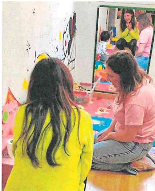
Sesión de atención temprana, en un centro de Abarán.

La nueva oferta supondrá una inversión de 33,5 millones de euros, añadida a la actual, y tiene entre los objetivos «reforzar la