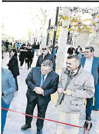
Escolares, inaugurada ayer.

El IES Mar Menor contará a finales de año con un nuevo edificio para incrementar el número de ciclos