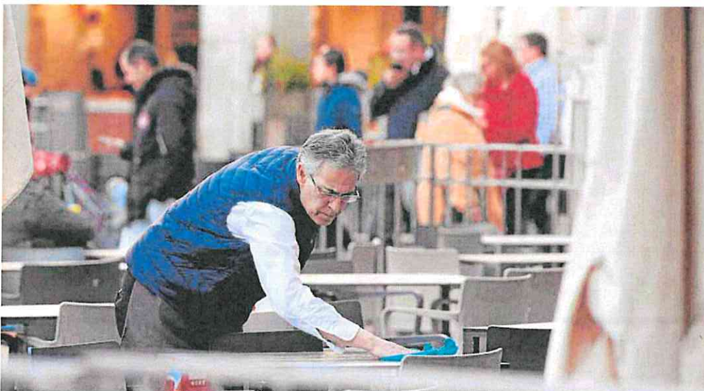
Un camarero limpia una mesa en una terraza. J. R. LADRA

Solo el año pasado se concedieron 32.305 millones de euros en créditos para el día a día, un 7% más que en 2022