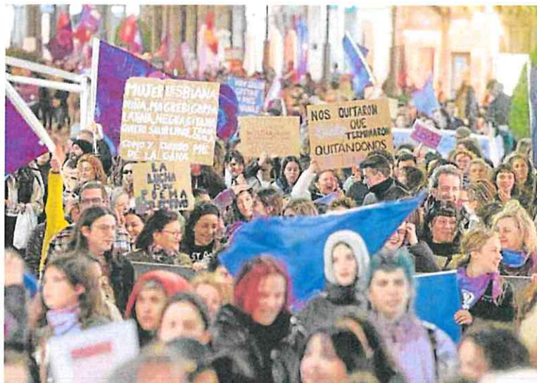
La manifestación atraviesa la calle Puerta de Murcia con banderas y carteles reivindicativos.

Pese a lo multitudinaria de la manifestación, en Alfonso X, separadas, Red Fem pidió el fin de la explotación laboral, sexual y reproductiva.