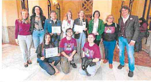
Los premiados muestran sus distinciones, ayer en Convalecencia.