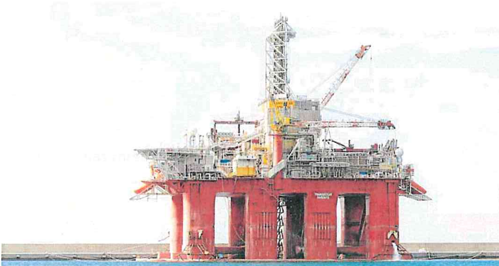
La plataforma 'Transocean Barents', atracada en el muelle suroeste del puerto de Escombreras, vista desde el muelle polivalente.