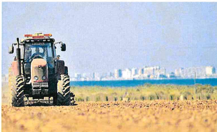
Un agricultor conduce un tractor en terrenos de cultivo frente al Mar Menor.