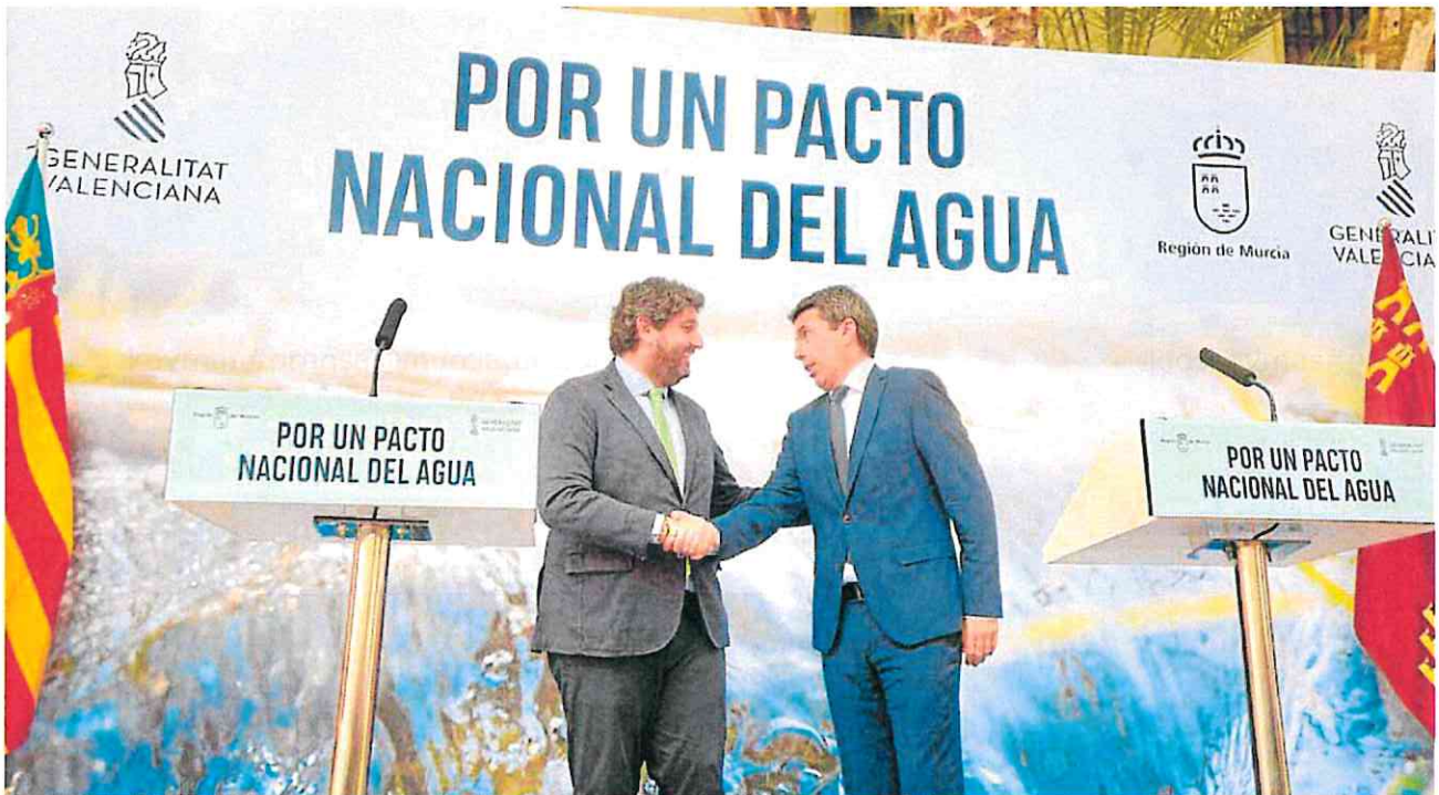
Fernando López Miras y Carlos Mazón se estrechan las manos durante la firma del Manifiesto a favor de un Pacto Nacional del Agua, ayer, en el Palacio de San Esteban.