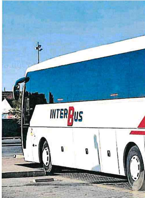
Autobús de la empresa Interbus.

«Por si fuera poco, hace unas semanas nos enteramos por la prensa de que el consejero pretendía po-