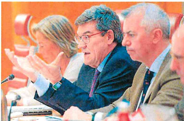
El ministro José Luis Escrivá, durante su comparecencia de ayer en el Senado.