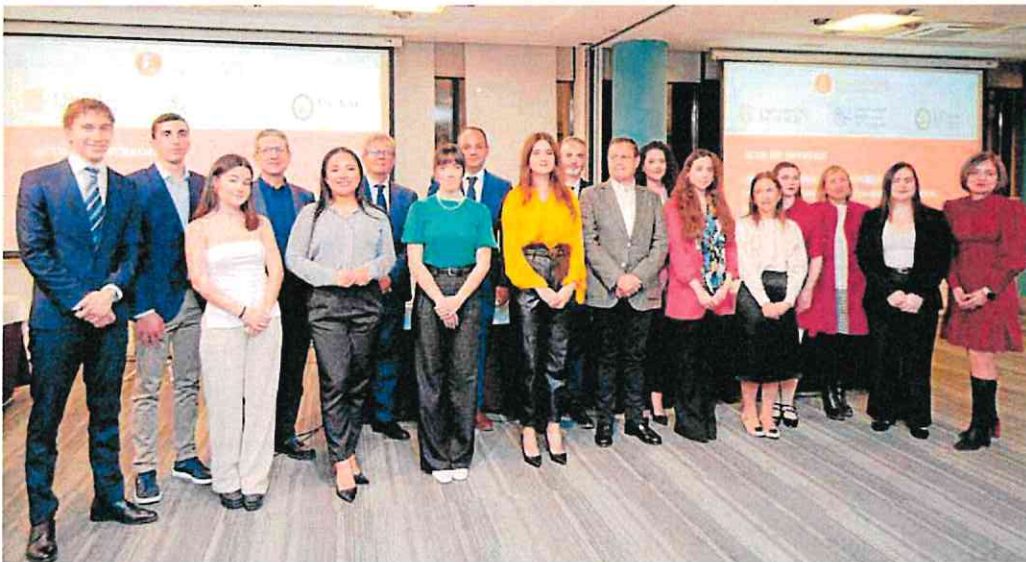
Galardonados en los Premios Economía y Empresa, junto a profesionales del colegio de la Región, ayer, en el hotel Agalla.