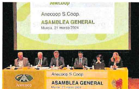
La asamblea general de Anecoop se celebró en el Víctor Villegas.

Por producto, ha destacado el incremento en facturación de un 48% en flores y plantas, una línea