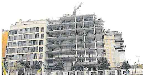
Bloque de edificios en construcción en la ciudad de Murcia.

De las operaciones de compraventa anotadas en enero en Murcia, 1.903 se realizaron sobre viviendas libres y 163 sobre inmuebles de protección oficial. Atendiendo a la antigüedad de los inmuebles, 351 operaciones correspondieron a viviendas nuevas, y 1.715 estuvieron relacionadas con edificios usados. En enero se realizaron un total de 3.128 operaciones sobre viviendas. Además de las 2.066 compraventas, 445 fueron herencias, 93 donaciones y 1 permutas.