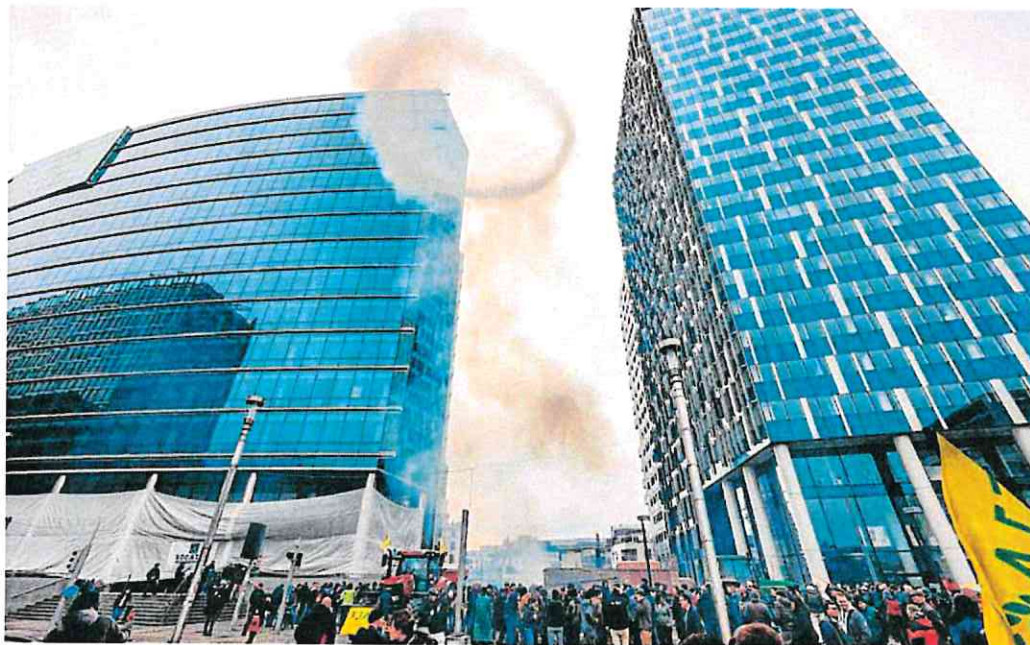
Columnas de humo se elevan frente a los edificios de la Comisión Europea, ayer durante una nueva protesta de agricultores en Bruselas.

En cambio, acrecientan la producción en este quinquenio nueve epígrafes industriales. Cuatro con mucho vigor y, además, invirtiendo la tendencia, como son la confección de prendas de vestir (31%), suministro de energía eléctrica, gas, vapor, aire acondicionado y refino de petróleo (26,3%), fabricación de bebidas (19,4%) y captación y depuración de aguas (18%). Asimismo, otras dos anotan alzas significativas: artes gráficas y reproducción de soportes grabados (11,2%), y fabricación de muebles (5,6%).