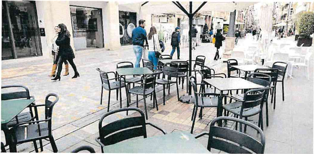
Una terraza desierta en Cartagena este Martes Santo a causa del mal tiempo.

También el presidente de la Asociación de Bares de HoyTú afirma que «es una tasa que en Murcia no se ha planteado».