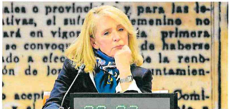
Elena Sánchez Caballero, durante una comparecencia ante la Comisión Mixta del Senado.

El sindicato de UGT en RTVE reaccionó al cese de Elena Sánchez con un comunicado en el que solicita a los grupos parla-