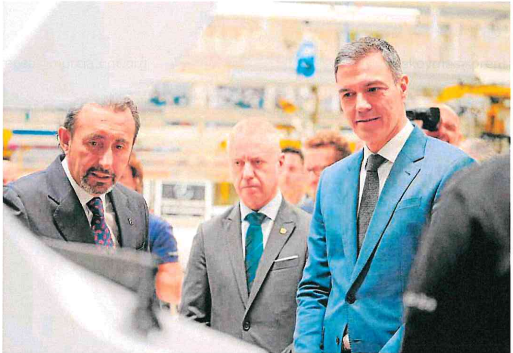
El presidente Pedro Sánchez, ayer en la factoría de Mercedes en Vitoria Junto al lehendakari Iñigo Urkullu.

Los socialistas saben que de lo que ocurra en Cataluña el 12 de mayo puede depender su propia continuidad en La Moncloa y que tanto Junts como los republicanos pueden acabar dándoles la espalda, pero sostienen que no