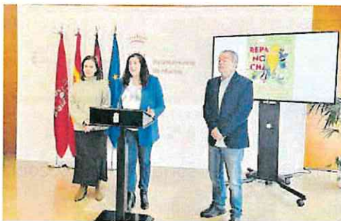
Presentación, ayer, del regreso de La Repanocha.

Por otro lado, «La Repanocha regresa para ofrecer a los jóvenes una alternativa de ocio saludable y seguro en el Bando de la Huerta, con una gran fiesta organizada