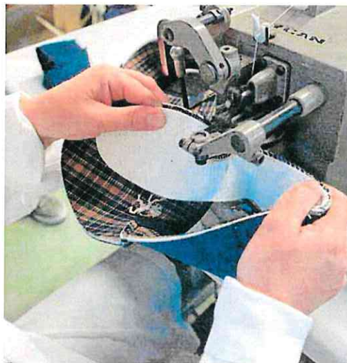
Proceso de fabricación industrial de calzado. M. BUENO

En la misma línea apunta el grado de utilización de la capacidad productiva en la industria regional, cuyo promedio del 64,5% es medio punto porcentual inferior a 2022, ambos por debajo de los