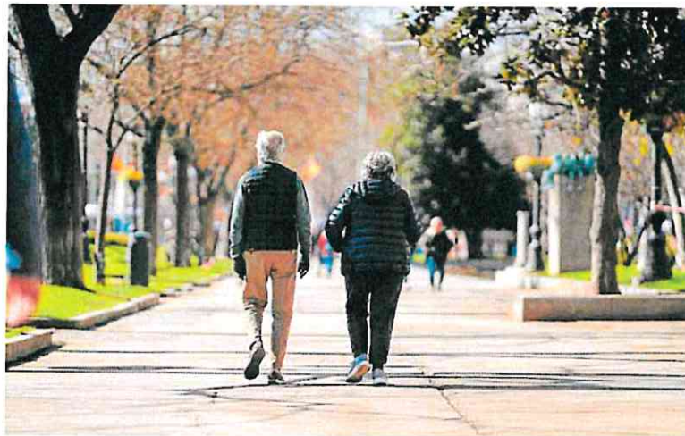
Una pareja de jubilados pasea por un parque. ÓSCAR CHAMORRO

La razón principal del crecimiento del PIB fue la demanda nacional, que aportó 1,7 puntos al crecimiento de 2023, aun así 1,2 puntos por debajo de 2022. El consumo de los hogares se convierte así en el motor de la economía, pero también destaca el tirón del turismo en un año que cerró con record no solo de turistas (85 millones de visitantes extranjeros), sino de aportación económica del sector turístico al PIB (187.000 millones de euros, según cálculos de Exceltur).