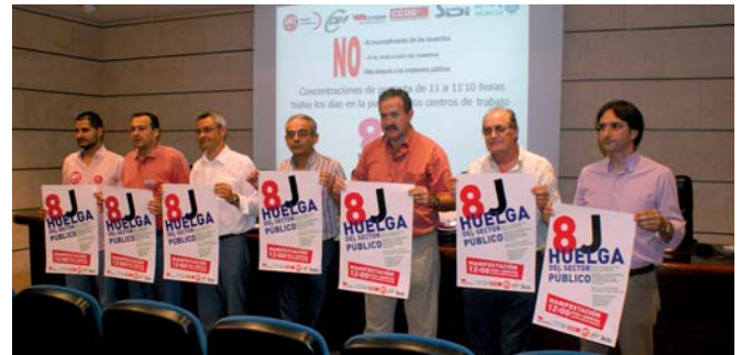
Secretarios Generales de los sindicatos convocantes de la huelga

Con todo, UGT junto a CCOO, CSIF, ANPE, STERM-Intersindical y SIDI sumaron más de 5000 personas venidas de toda la Región que participaron en la Manifestación del día 8 de junio. Las medidas tomadas por el Gobierno Central afectan, entre otras partidas, a los salarios de los empleados