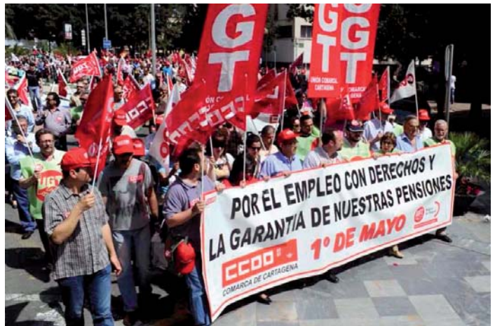
El 1º de mayo por las calles de Cartagena