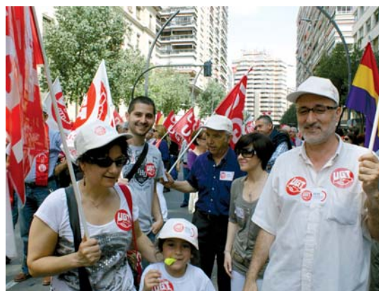
Participantes de la manifestación