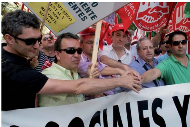
UGT encabeza la manifestación del 8J