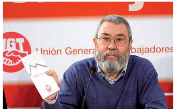
Cándido Méndez, Secretario general UGT

Méndez señaló que la fecha del 29 de septiembre “ni está fuera de plazo por retraso ni por anticipación”; más aún teniendo en cuenta que así se podrá medir mejor el ambiente que hay por las calles. Sin embargo, otras dos fechas claves se vislumbran en el horizonte: el 30 de junio, jornada en la que se llevarán a cabo manifestaciones en todas las Comunidades Autónomas; y el 9 de septiembre, día en el que tendrá lugar un acto masivo de representantes sindicales en Madrid.