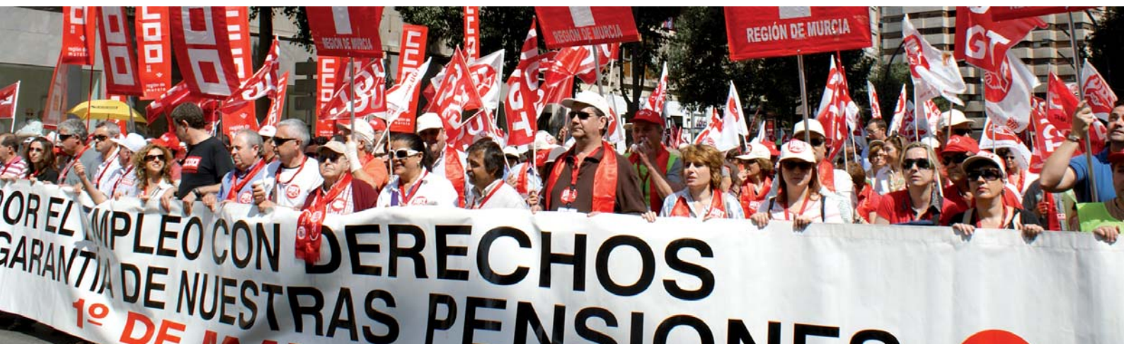
Miles de trabajadores recorrieron la capital murciana en el 122 aniversario del 1º de mayo