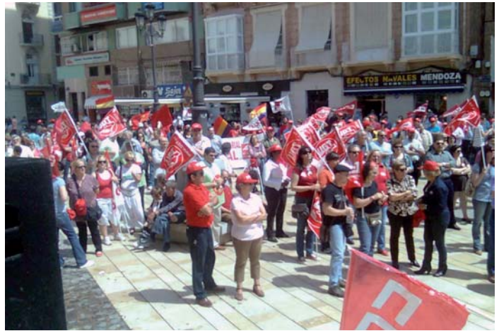
Momento de la manifestación en Cartagena

Es momento de luchar por los derechos logrados y conquistados con tanto esfuerzo y tesón. De apostar por políticas de formación, de igualdad y de integración y de guiarnos por un nuevo modelo productivo que invierta en las personas y en sectores emergentes.