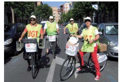
Las bicis de UGT por Murcia

El 5 de junio UGT Región de Murcia celebró el Día Mundial del Medio Ambiente, dando muestra de su voluntad y trabajo por conseguir un modelo de desarrollo sostenible y la realización de buenas prácticas que favorezcan, y no atenten, en contra del Medio Ambiente. La apuesta de la Secretaría de Salud Laboral, Medio Ambiente y Cambio Climático fue del todo novedosa, haciéndose de cuatro bicicletas de paseo para transmitir a la sociedad que un medio de transporte como éste, 100% no contaminante, se puede convertir en uno más para recorrer nuestras calles y acabar con los elevados índices de contaminación o emisiones de CO 2 , de los que el vehículo privado es el principal culpable con un 30% de estas emisiones.