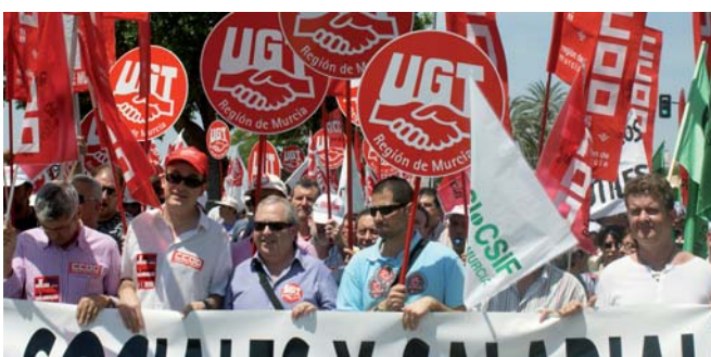
Cabeza de la pancarta que recorrió las calles de Murcia

El 38 por ciento de los empleados públicos son temporales y el 26 por ciento cobra menos de 1.000 euros al mes, siendo de 1.300 euros el salario medio. FSP-UGT Murcia defiende que los ciudadanos tienen derecho a unos servicios públicos de calidad y recuerda que recortar los servicios públicos es recortar el estado de bienestar. (Más información en http://murcia.fspugt.es )