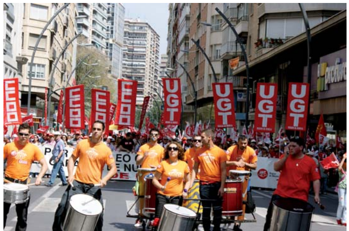
La batucada, en primera línea de la marcha