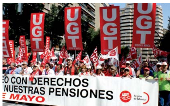
La masiva manifestación recorriendo la Gran Vía de Murcia