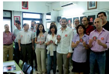
La ejecutiva de FETE muestra el logo de “Yo enseño”