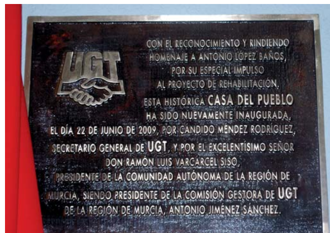
Placa conmemorativa instalada con motivo de la reinauguración

La nueva inauguración fue el colofón a un día lleno de emociones y sentimientos encontrados. Gracias al esfuerzo de todos, ha dado comienzo una nueva etapa para la Casa del Pueblo de El Llano del Beal.