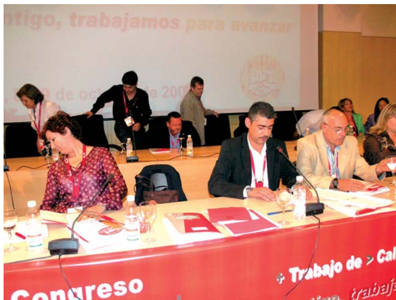
Mesa del XI Congreso, con la Ejecutiva elegida en 2005 al fondo

compartiendo el desarrollo de este evento. Del mismo modo, será inevitablemente objeto de debate la crisis económica y sus efectos sobre el empleo, sobre todo cuando los últimos datos de paro se conocerán el día 2 de octubre, el mismo día de inicio de este Congreso.