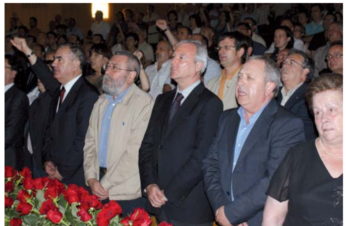
Los máximos representantes de la política y de UGT a nivel nacional y regional