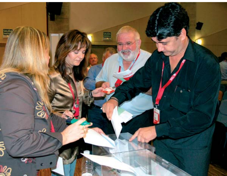
Votación de Candidatura en el XI Congreso Regional de UGT, en octubre de 2005

Esperamos que estos días de debate democrático interno sirva para fortalecer a nuestro sindicato, y valoremos las iniciativas y soluciones para afrontar estos tiempos de acentuadas y persistentes dificultades económicas y sociales que estamos viviendo los trabajadores y trabajadoras de nuestra Región.