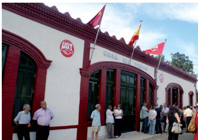
Fachada principal de la Casa del Pueblo

Cuando en 2002 Antonio López Baños fue elegido máximo responsable regional de UGT Región de Murcia, tuvo muy claro que uno de los principales objetivos de su gestión sería la remodelación de la Casa del Pueblo de El Llano del Beal (Cartagena), cuya primera inauguración se remonta al año 1916, y a la que se dice que asistió el fundador del sindicato y del PSOE, Pablo Iglesias.