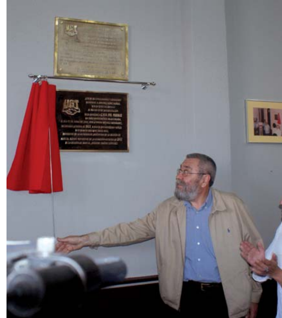
Cándido Méndez inaugurando la Casa del Pueblo