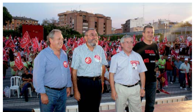
Los líderes regionales y nacionales de los sindicatos convocantes de la HG

Desde UGT , tanto a nivel nacional como en la Región de Murcia, se intentó transmitir a la ciudadanía la necesidad de protestar ante tales abusos. Una importante emisión de carteles, folletos, pancartas y anuncios en radio y prensa, además de lo mencionado en el párrafo anterior sirvió para llevar el mensaje “ASÍ NO”; Cándido Méndez, Secretario General de UGT y Fernández Toxo, de CCOO visitaron conjuntamente hasta en 3 ocasiones en pocos meses nuestra región: en marzo para protestar por la prolongación de la edad de jubilación, en julio para participar en una asamblea de delegados multitudinaria y en septiembre, para profundizar en el mensaje y animar a participar en la Huelga General.