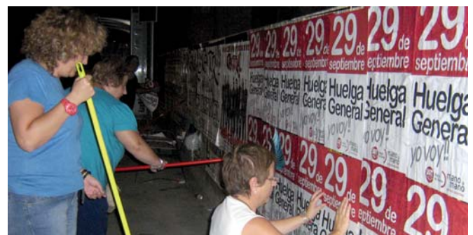
Un momento de la pegada de carteles