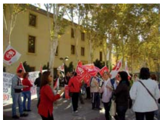
Trabajadores de Halcon Foods protestan ante el Gobierno Regional

Los trabajadores de Halcon Foods llevan más de 18 meses sin trabajo, a pesar de los millones de euros que le facilitaron al propietario para el rescate de la empresa