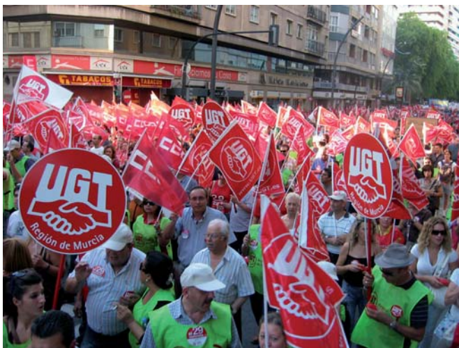
Más de veinte mil personas participaron en la manifestación del 29-S en Murcia y Cartagena

Los meses de Junio y Septiembre han sido meses “calientes”: movilizaciones, encierros, protestas, “caceroladas”, cadenas humanas, rutas de vehículos por las ciudades, conciertos musicales de protesta y cientos de reuniones, asambleas de trabajadores, conversaciones con empresarios y participación en decenas de programas de televisión y radio y apariciones en medios escritos supusieron el aumento de la presión de los