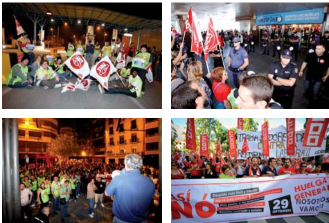
Distintos momentos del 29-S en Murcia y Cartagena

Desde las 00.00 horas del día 29, los piquetes informativos continuaron informando en las empresas con turnos de trabajo nocturnos, en grandes polígonos industriales y las principales estaciones de autobuses y de tren de la región. En todo momento, un amplio despliegue de la Policía Nacional acompañó a los piquetes, sin destacar ningún incidente relevante.