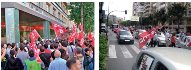
Las movilizaciones han sido continuas en los últimos meses

En la mañana del día 29, grandes piquetes informativos en Murcia y Cartagena, compuestos de varios miles de personas, consiguieron convencer para que cerraran comercios y negocios del centro de dichas ciudades. A las 12 h. en Cartagena tenía lugar una gran manifestación. En Murcia, se realizó a las 18 horas. Bajo el lema "Rectificación Ya", ambas manifestaciones consiguieron elevar el grito de los trabajadores que protestaban por los mayores recortes sociales y laborales que un gobierno democrático había realizado en el último siglo.