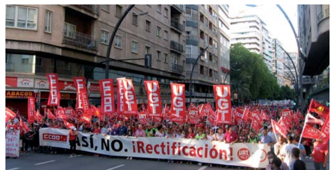
Manifestación del 29-S en Murcia

Mientras tanto, el presidente Zapatero se ha comprometido con banqueros y empresarios (los que más han provocado esta situación de crisis) que va a continuar con los ajustes. Un nuevo Plan que recoge medidas como: la supresión de la ayuda de 426 euros a parados de larga duración, la privatización de grandes empresas públicas, vía libre a las empresas privadas de colocación, rebaja del impuesto de sociedades a PYMES y duplicar la plantilla de orientadores laborales, entre otras que según afirma Zapatero nos harán salir más fortalecidos de esta crisis. Ya veremos.