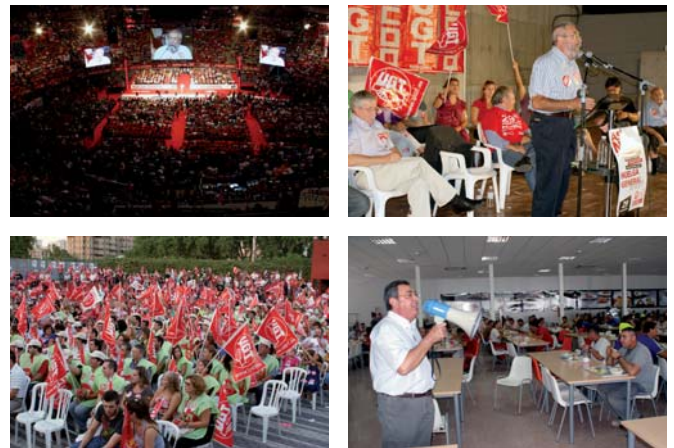
Miles de asambleas de trabajadores se celebraron en toda España

sindicatos ante tales atropellos a los derechos de los trabajadores. Una crisis que en la Región de Murcia ha hecho que lleguemos en la actualidad a más de 129.000 parados registrados, que no tiene horizonte de remontar a corto o medio plazo y unas reformas que cargan sobre los más débiles los recortes más acusados. Por cierto, la patronal no dice “ni pío”, ante la ventajosa jugada que le está haciendo el gobierno de España.