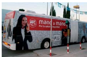
El autobús de la prevención de la UGT

Secretaría de Salud Laboral, Medio Ambiente y Cambio Climático