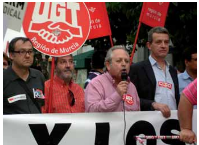
El Secretario general de UGT se dirige a los manifestantes

Las propuestas de la Unión General de Trabajadores continúan siendo las mismas y tal y como ha señalado el Secretario general de UGT Región de Murcia, “no pararemos de movilizarnos en contra de lo que nos parece una auténtica agresión no sólo a los empleados públicos sino a los servicios públicos que, recordemos, son de toda la ciudadanía”.