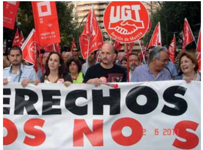
Cabecera de la pancarta de la movilización el 2 de junio

“UGT junto con CCOO, presentó un total de 42 propuestas encaminadas a reducir el déficit público sin atentar los derechos laborales”