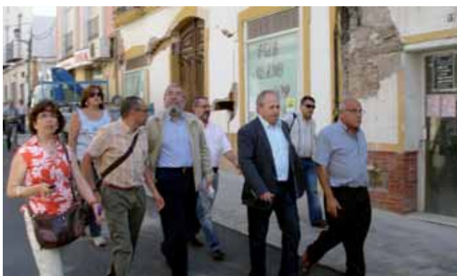
Recorrido a pié del líder sindical junto a los dirigentes regionales de UGT