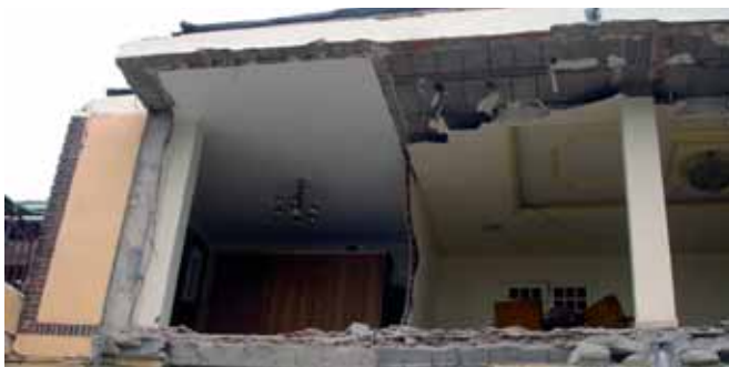
Fachada de uno de los edificios más afectados