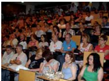
Más de 200 delegados sindicales participaron en los actos celebrados en Murcia el 22 de junio