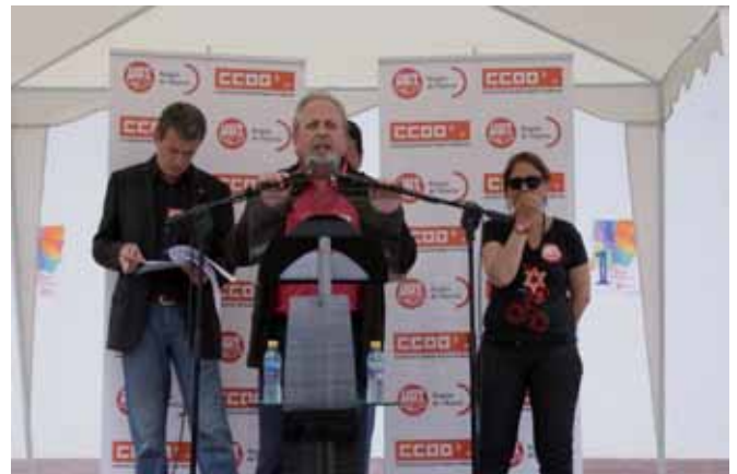
El Secretario general durante su intervención

Los casi 200.000 parados que tiene ya la Región de Murcia son un claro reflejo de la inutilidad de las medidas adoptadas con la Reforma Laboral. Desde hace unos meses, UGT y CCOO están recogiendo firmas para presentar una Iniciativa Legislativa Popular al Parlamento con el propósito de que sea derogada la Reforma Laboral. A las puertas del recinto, se instalaron mesas de recogida de firmas para conseguir llegar a las 500.000 firmas que se necesitan a nivel nacional.