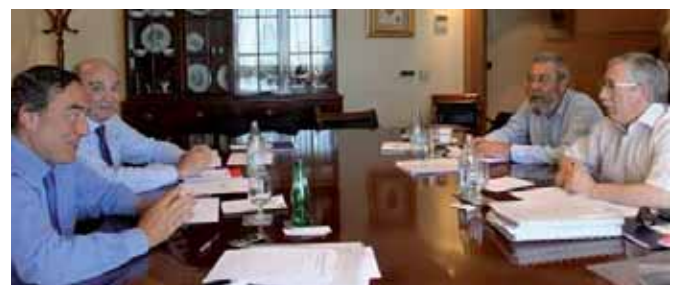
Reuniones entre sindicatos y patronal antes de la ruptura del Diálogo Social

Aunque sí es positivo el protagonismo que adquiere la mediación y el arbitraje como medida de resolución extrajudicial de los conflictos en el ámbito de la negociación. El pasado 22 de junio superó el trámite parlamentario y ahora, la norma se tramitará como proyecto de ley y, muy probablemente, será enmendada.