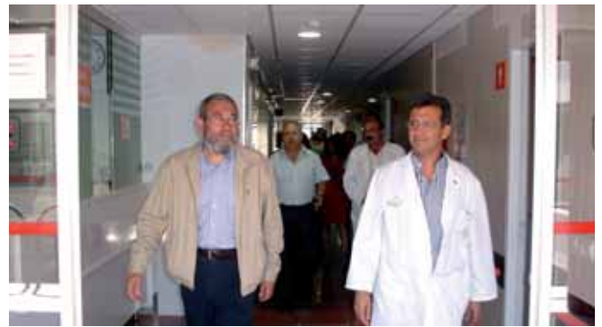
Méndez visitó a los trabajadores/as del Hospital Rafael Méndez (foto) y de Ambulancias Lorca