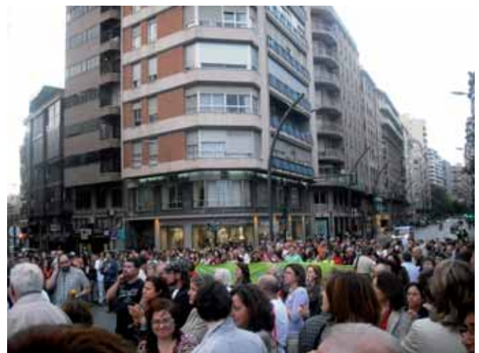
Miles de manifestantes ocuparon de nuevo las calles de la capital

Un par de meses más tarde, el 11 de mayo, la ciudad de Lorca sufrió el mayor terremoto de su historia, de 5, 1º en la escala de Richter, y que dejó 9 víctimas mortales, además de a más de 600 familias sin techo. Tan sólo cuatro días más tarde, el 15 de mayo, UGT , CCOO y la Intersindical firmaron un manifiesto en el que se hacía hincapié en la extraordinaria labor llevada a cabo, desde el primer momento, por el colectivo de empleados públicos de Lorca. Un manifiesto, al que posteriormente se adhirieron más de diez organizaciones sociales y del que se hizo lectura el 17 de mayo en la Plaza Martínez Tornel de la capital murciana, donde los tres sindicatos llevaron a cabo una concentración con tres minutos de silencio en honor a las víctimas.