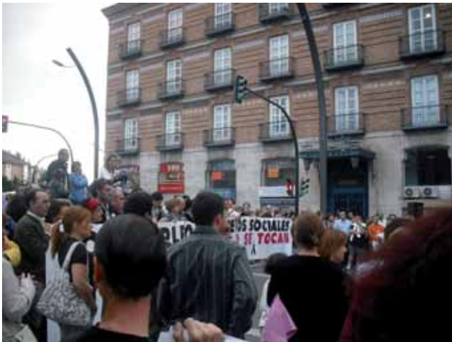
Manifestación del 17 de mayo en Murcia