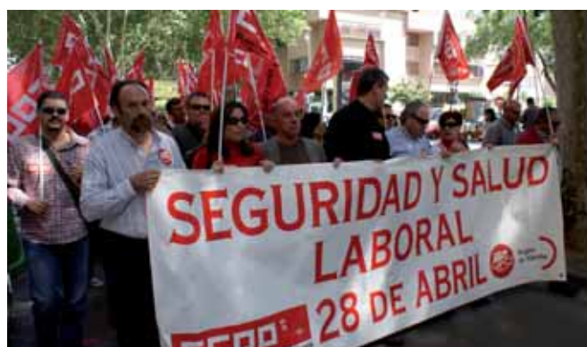
Manifestación de delegados sindicales por las calles de Murcia

Posteriormente, unos 300 delegadas y delegados de UGT y CCOO protagonizaron una manifestación hasta la Plaza de Santo Domingo de la capital murciana, donde mostraron su solidaridad con las 36 personas fallecidas en accidente de trabajo durante el pasado año en la región, encendiéndose una simbólica vela por cada víctima en señal de respeto.