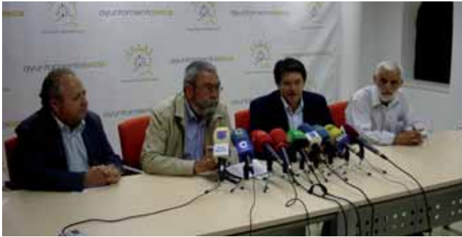
Rueda de prensa de Méndez en el consistorio lorquino

Cándido Méndez visita la ciudad y anuncia el refuerzo de UGT en la Comarca del Valle del Guadalentín en materia jurídica, de orientación de empleo y de prevención laboral