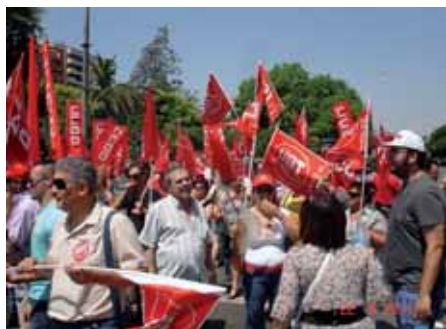
Momento de la concentración a las puertas de la Delegación del Gobierno en Murcia

“Los líderes sindicales de la CES, establecen un nuevo calendario de movilizaciones”