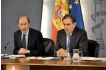
Presentación de la reforma por parte del Gobierno

El Ministerio de Trabajo mantiene la ultraactividad y da más protagonismo al convenio de empresa así como a las comisiones paritarias