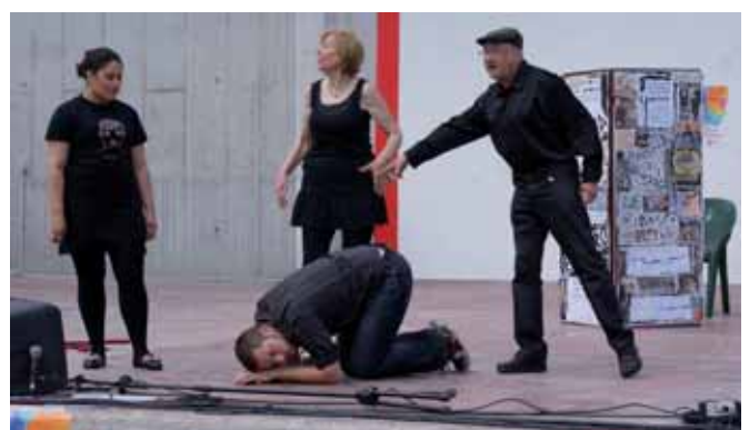
Uno de los momentos teatrales reivindicativos de ese día