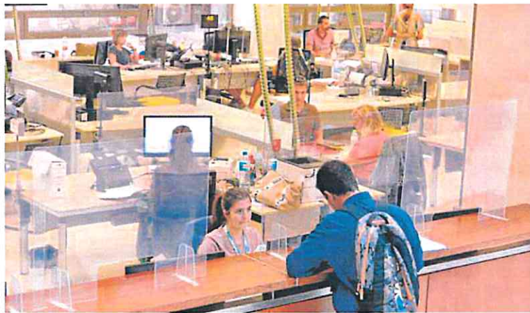
Funcionarios de la Comunidad murciana, en una imagen de archivo.

Por ello, precisó que los roles a eliminar reflejan el resultado de una «revisión rigurosa» realizada en todas las áreas y funciones para garantizar que responden a las principales prioridades de la empresa.