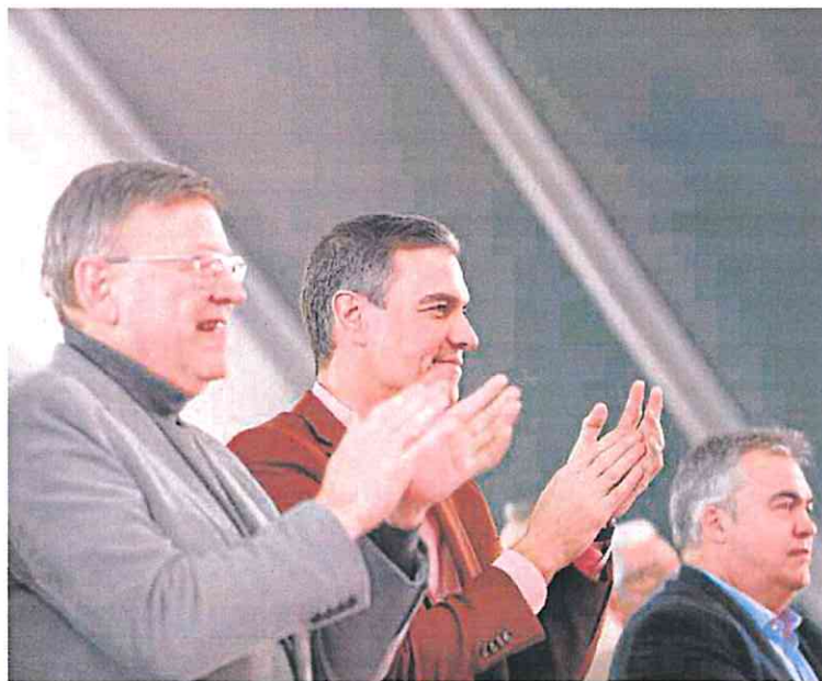
Ximo Puig y Pedro Sánchez, el pasado mes, durante un acto de partido en Valencia. JESÚS SIGNES

«Garantizamos los caudales ecológicos necesarios para la flora y la fauna de los ríos, pensando en sectores como la agricultura, con decretos especiales de sequía, o pensando en el Levante, con infraestructuras en desalación», dijo.