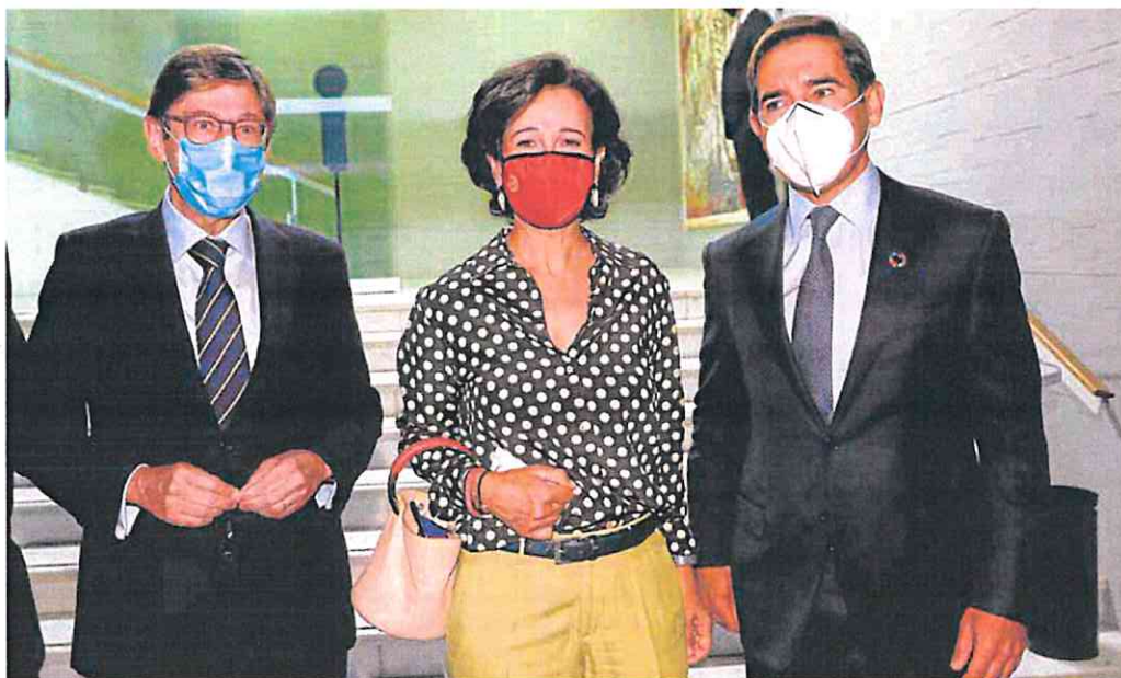
El actual presidente de CaixaBank, José Ignacio Golrizgolzarri; la del Santander, Ana Botín; y el de BBVA, Carlos Torres, en agosto de 2020.

Un alto directivo del sector en España se sitúa al frente del 'ranking' de remuneración, con 14,6 millones en 2021