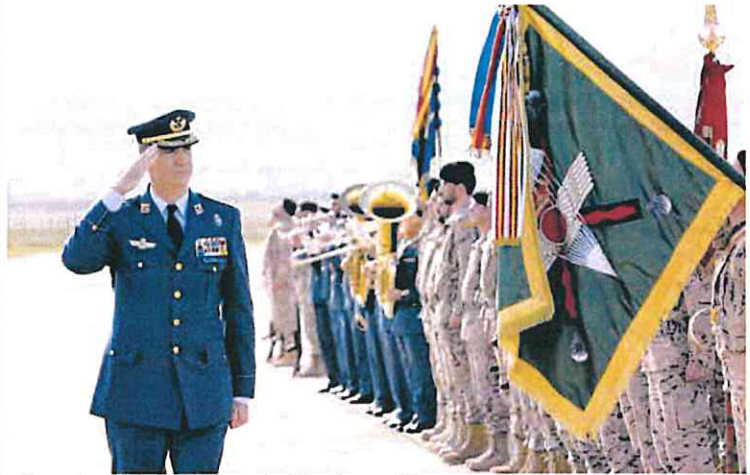
Felipe VI, durante una visita a la Escuela Militar de Paracaidismo Méndez Parada.

«No parece muy razonable que a estas alturas sigan saliendo plazas de cabo, una categoría inexistente en la nueva ley o plazas de subinspector dentro del grupo C1 puesto que la nueva ley los engloba en el grupo B o incluso que se nombren agentes en prácticas sin haber iniciado la fase de academia, realizando trabajos en la calle», hacen hincapié ambas organizaciones sindicales.