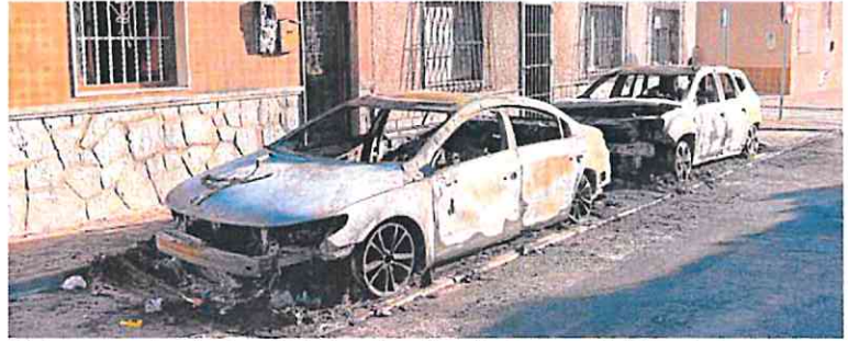
Estado en que quedaron los dos vehículos tras el incendio registrado en una calle de Torre Pacheco.