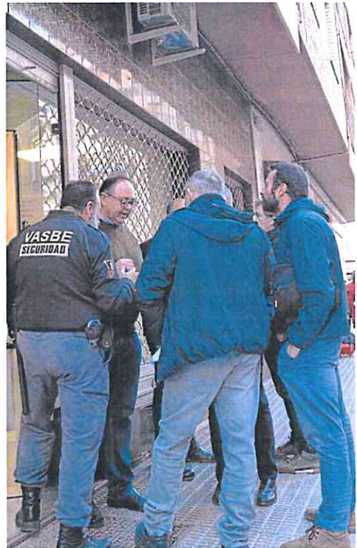
Trabajadores y miembros del comité de empresa de la Autoridad Portuaria en el Juzgado de lo Social número 2 de Cartagena.

Rosique realizó esas declaraciones tras la primera sesión de un juicio celebrado este viernes en el Juzgado de lo Social número 2 de Cartagena. En él se vio una demanda interpuesta por un trabajador del Puerto, el jefe de departamento de Sistemas de Información y Comunicaciones, contra la Autoridad Portuaria y la jefa de área de Planificación y