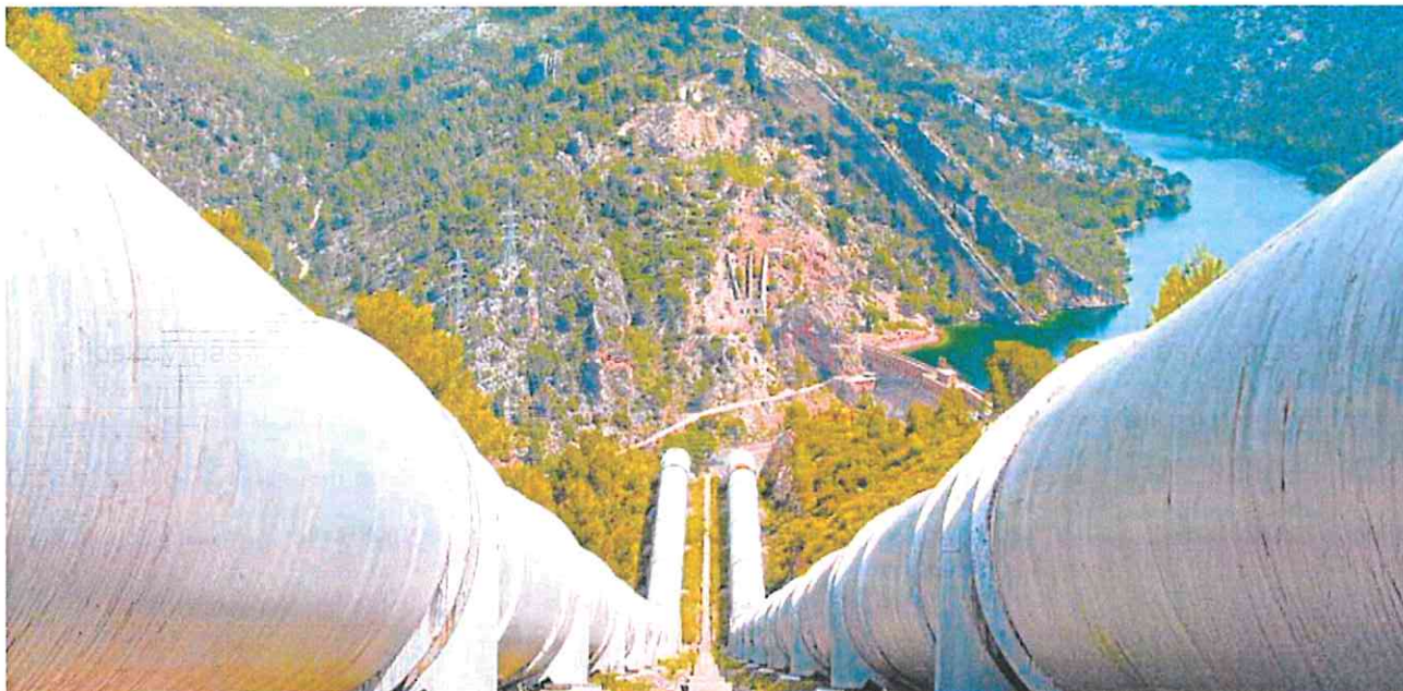
Sistema de impulsión de las aguas de los embalses de la cabecera del Tajo, en el punto de arranque del Trasvase.