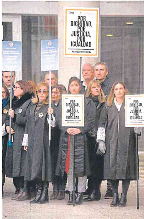
Los letrados, ayer, durante la concentración en Murcia.

El fiscal solicitó dos años y medio de prisión para el ex jefe del Ejecutivo regional por los presuntos delitos de fraude y prevaricación, mientras que la defensa pedía su absolución.