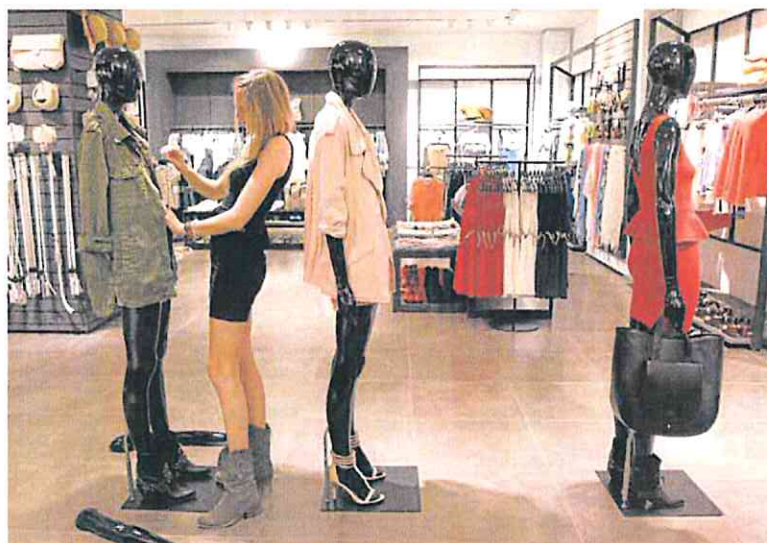
Una empleada da los últimos retoques a un maniquí en una tienda de Zara.

Los expertos tienen claro que el acuerdo entre la empresa y las centrales sindicales Comisiones Obreras y UGT tiene mucho que ver con este comportamiento. No se trata del pacto en sí, sino más