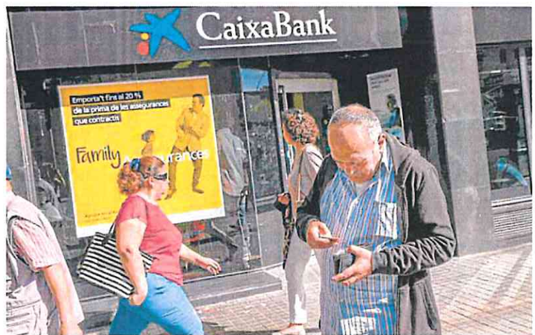
Un hombre guarda dinero en su cartera tras salir de una oficina bancaria.

Además, los criterios de buenas prácticas también recogen que los bancos deben dejar cla-