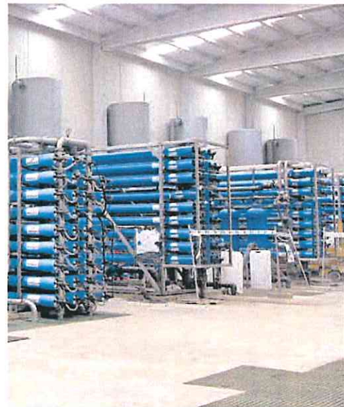
Desaladora de la comunidad de regantes Arco Sur.

Arco Sur justificó esta reclamación indicando que la Comunidad era «concedora de la irregular situación administrativa» por la que pasaba la comunidad de regantes y, también, que el Gobierno autonómico «durante años ha banalizado los requisitos administrativos que deben cumplir las actividades de