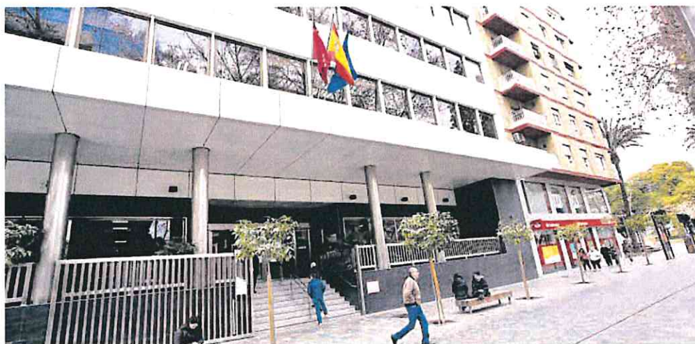
Sede de la dirección provincial del INSS en el Paseo Alfonso X de Murcia.