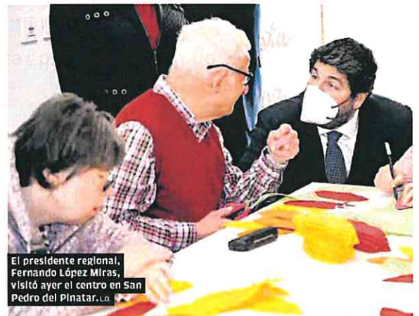
El presidente regional, Fernando López Miras, visitó ayer el centro en San Pedro del Pinatar...

Durante el acto, López Miras señaló que el centro se alinea con «la absoluta prioridad que representa