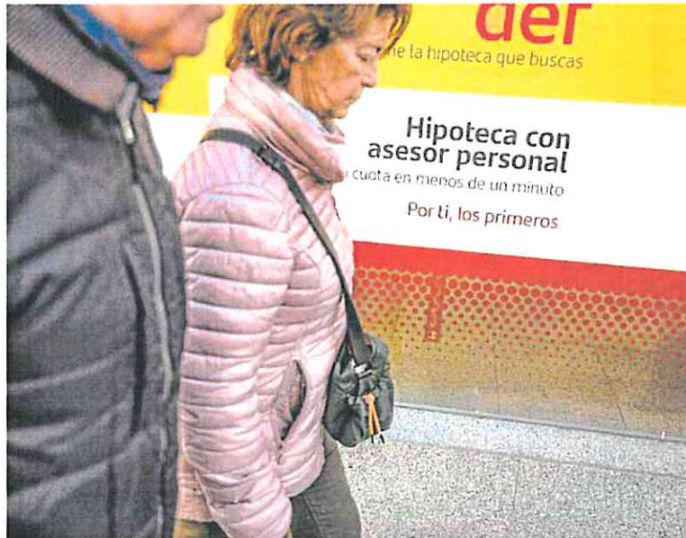
Escaparate de una oficina bancaria con una oferta hipotecaria. PABLO COBOS

Una década después, las cuotas de los préstamos referenciados a interés variable está creciendo a un ritmo superior en muchos casos a los 200 euros al mes. En concreto, un hogar que tenga contratada una hipoteca variable de 150.000 euros a 30 años y con un diferencial del 0,99% más euríbor y deba revisar su tipo de interés en el mes de mayo, registra-