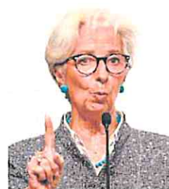
Christine Lagarde. AFP

En 2008, finalmente, Trichet cedió a las voces que le pedían una rebaja de los tipos y anunció una reducción de 50 puntos básicos, hasta el 3,75%.