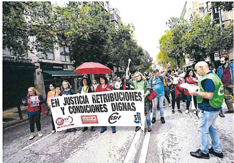
Funcionarios de Justicia, este martes en la puerta de la sede del PSOE en Murcia.

Desde el Ministerio de Justicia «no quieren hablar», lamentaban este lunes afectados de la Región. De ahí que no les quede otra que endurecen sus protestas. La Administración de Justicia sigue en huelga, o por lo menos parte de ella. Los 1.500 funcionarios de Justicia que hay en la Comunidad daban inicio este lunes a una huelga indefinida para reclamar mejoras salariales y laborales. Las cuales, recordaron, sí lograron los secretarios judiciales.