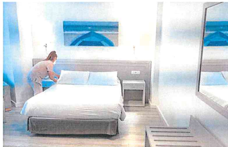
Una empleada prepara una habitación de un hotel en Granada. r. c.

Las pymes tienen una deuda comercial total que roza los 200.000 millones de euros y su coste financiero se ha duplicado respecto al año pasado y escala hasta los 2.649 millones, niveles que no se veían desde 2011.