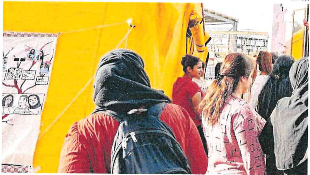
Mujeres refugiadas en el interior de un campo de Grecia.

Mientras que la UPCT es una de las nueve universidades que componen el consorcio EU+ con el objetivo de dar respuesta desde el punto de vista tecnológico a los retos a los que se enfrenta la humanidad, como el cambio climático, la sobreexplotación de los recursos, la creciente desigualdad y las consecuencias sociales de la era digital, así como la de formar nuevas generaciones preparadas para los retos globales. ■