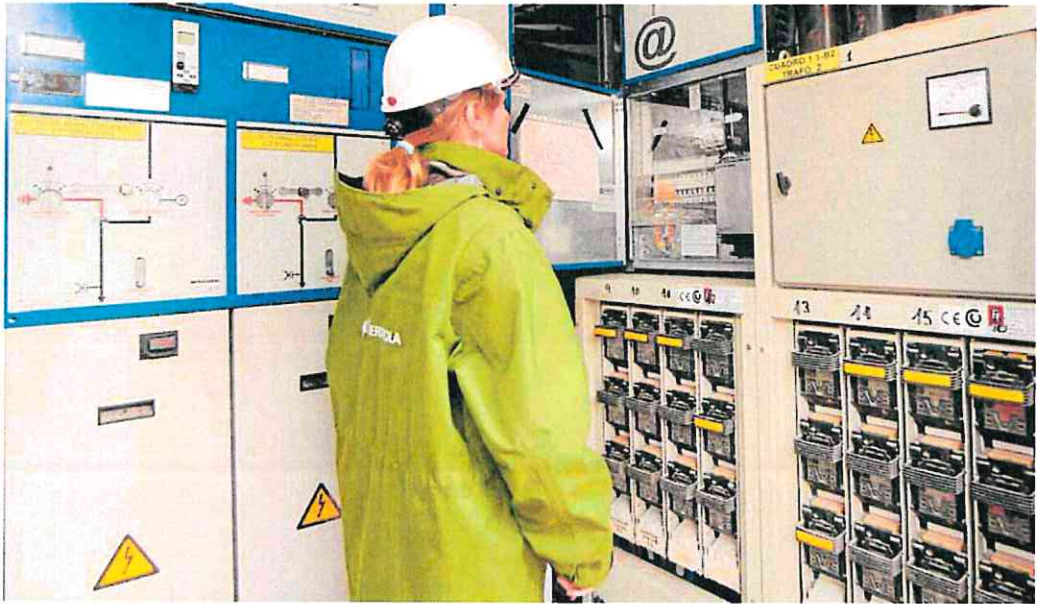
Una empleada de Iberdrola realiza controles en un panel de contadores digitales.

La parte proporcional de precios fijos del PVPC (la tarifa regulada de toda la vida) pasará a representar el 40% del coste en 2025 y alcanzarán ya el 55% a partir de 2026, mientras que la indexación al contado irá perdiendo así su peso pasando del 75% de este ejercicio al 45% al final de toda la reforma.