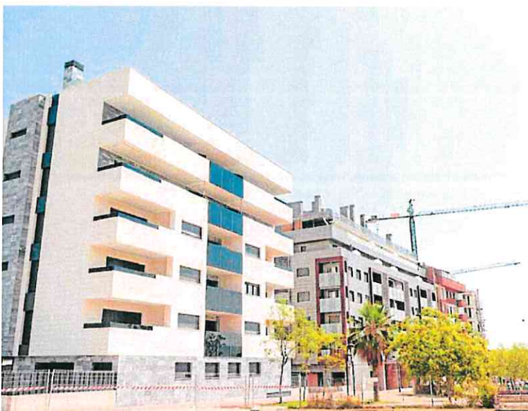
Un bloque de viviendas nuevas junto a la plaza de los Cubos. Al fondo, más grúas.

poco superior para cubrir los costes, que son muy altos. De 'hacer' el suelo y de las infraestructuras, los de construcción y mano de obra se han disparado también, y las exigencias constructivas son cada vez mayores», ex-