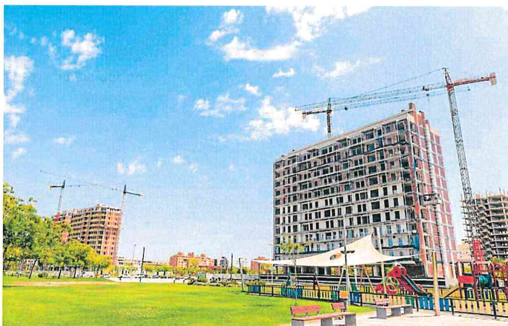
Varios edificios en construcción en la avenida Academia de Infantería, en el entorno de Juan de Borbón.

«Falta obra nueva y está localizada en unas pocas zonas porque es donde hay suelo, ya que es muy complicado ponerlo en el mercado», confirma José Ramón Blázquez, presidente de la Asociación de Promotores Inmobiliarios de la Región de Murcia (Apirm). «La demanda es muy alta», admite, pero choca con una oferta escasa y limitada a zonas donde se paga «un precio un